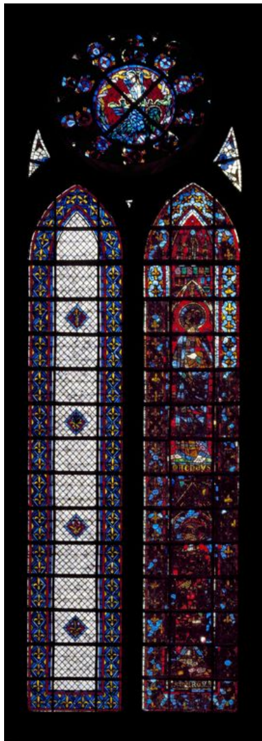
Vue générale. IVR22_20090200149VA