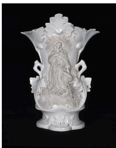
Vue de la face antérieure du vase. IVR22_20020200548XA