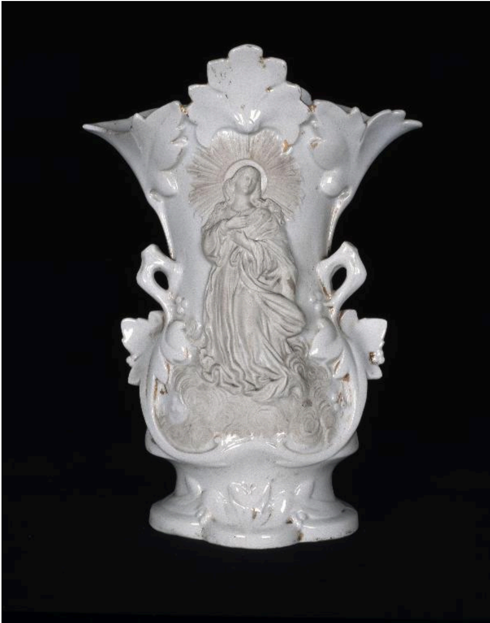
Vue de la face antérieure du vase.