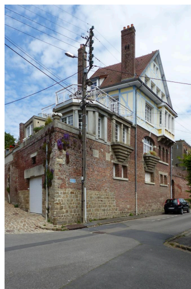
Demeure, 16 rue Fournier, reconstruite vers 1930. Vue depuis la rue du Collège. IVR32_20228005113NUCA