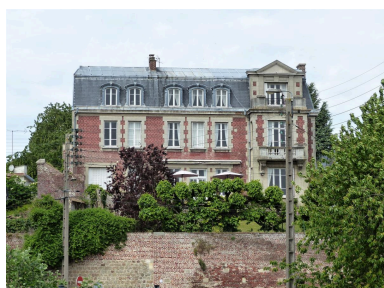
Ancien hôtel Dehaussy de Maigremont. Vue depuis la rue du Collège.