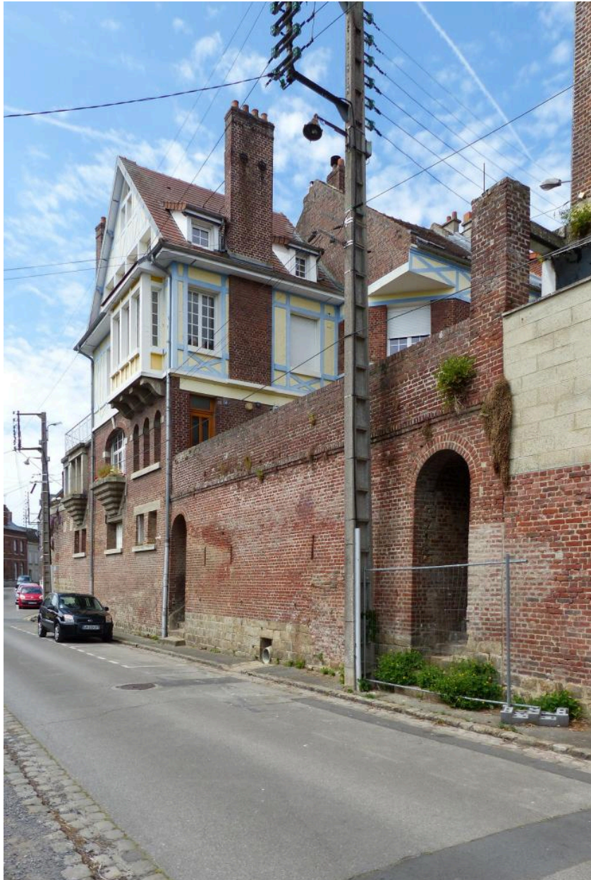
Demeure, 16 rue Fournier, reconstruite vers 1930. Vue depuis la rue du Collège.