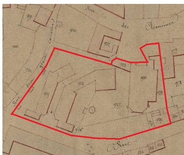
L'ancien couvent de minimes sur le cadastre napoléonien. Section B de la ville, vers 1839 (AD Somme ; 3P 2065/4).