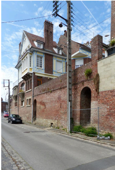
Demeure, 16 rue Fournier, reconstruite vers 1930. Vue depuis la rue du Collège. IVR32_20228005114NUCA