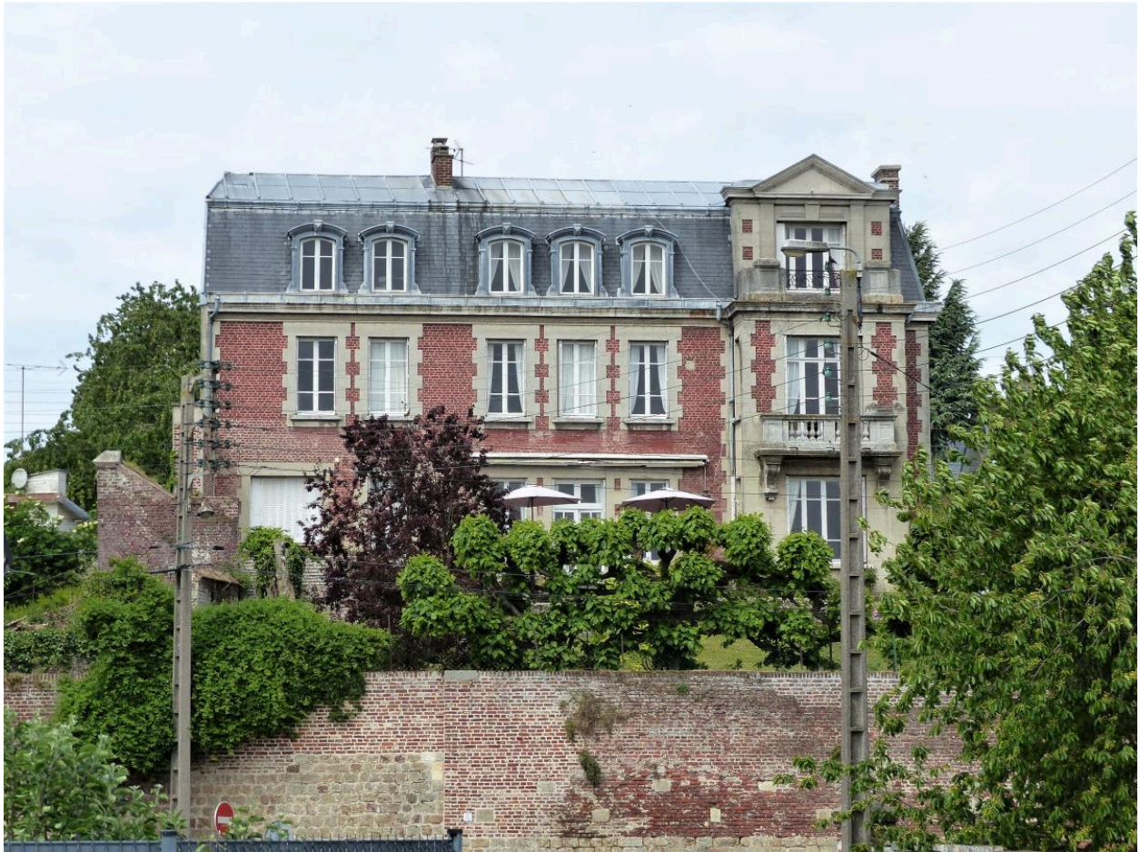
Ancien hôtel Dehaussy de Maigremont. Vue depuis la rue du Collège.