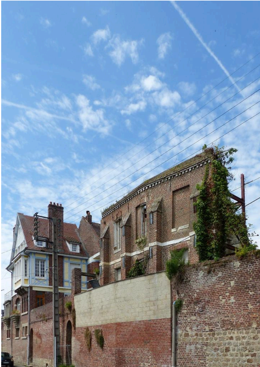
Les demeures de la rue Fournier vues depuis la rue du Collège. Au premier plan, la maison du n°9, partiellement écroulée en 1893.