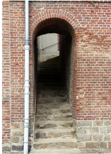
Passage et escalier reliant la rue Fournier à la rue du Collège.