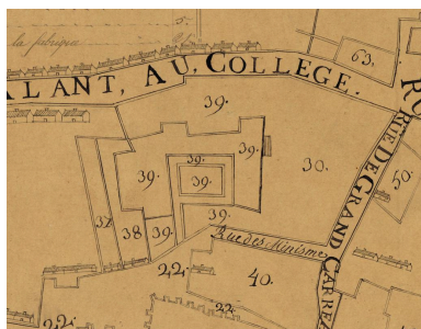
Le couvent de minimes sur le plan et figure des églises, cimetières, maisons et lieux étant de la censive et justice du chapitre de St Fursy de Péronne [18e siècle] (Bibliothèque nationale de France, GED-2757).