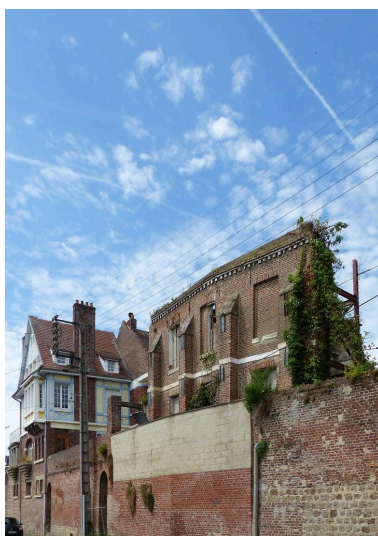
Les demeures de la rue Fournier vues depuis la rue du Collège. Au premier plan, la maison du n°9, partiellement écroulée en 1893. IVR32_20228005111NUCA