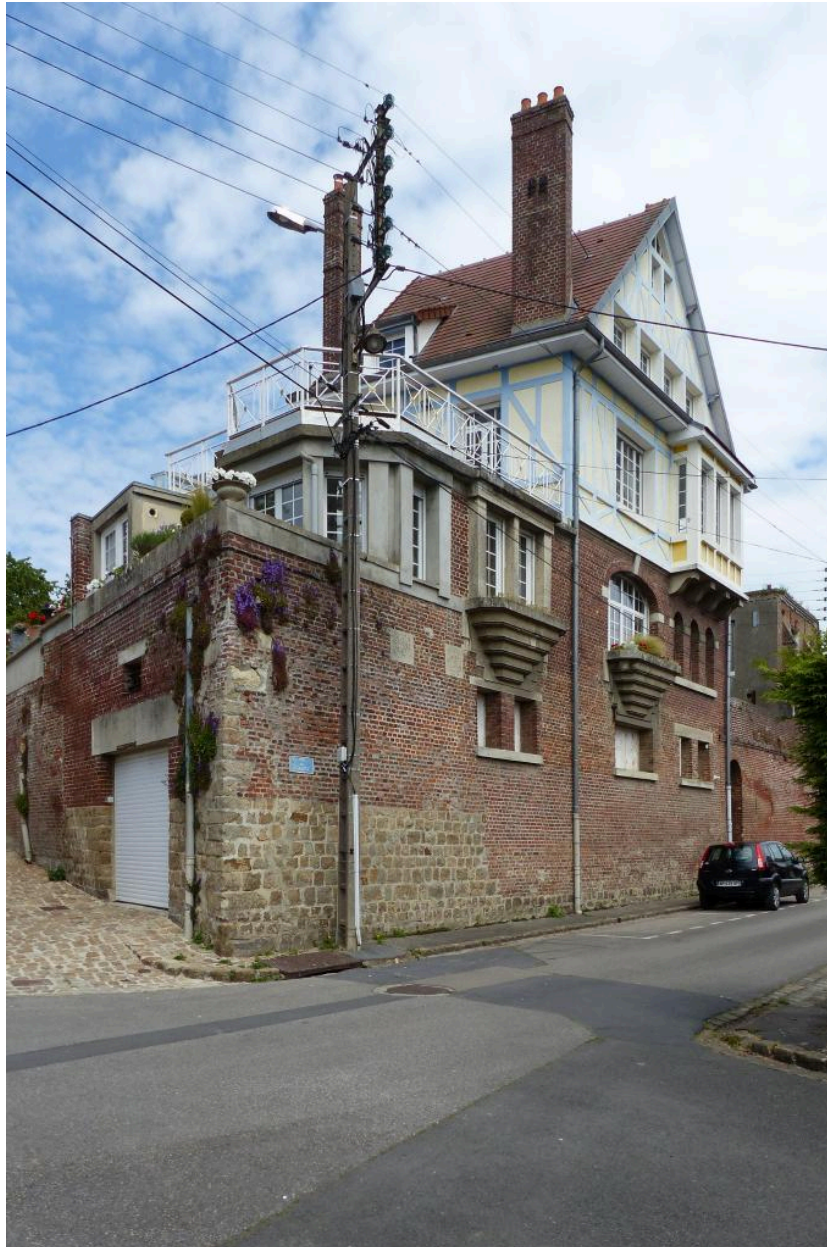
Demeure, 16 rue Fournier, reconstruite vers 1930. Vue depuis la rue du Collège.