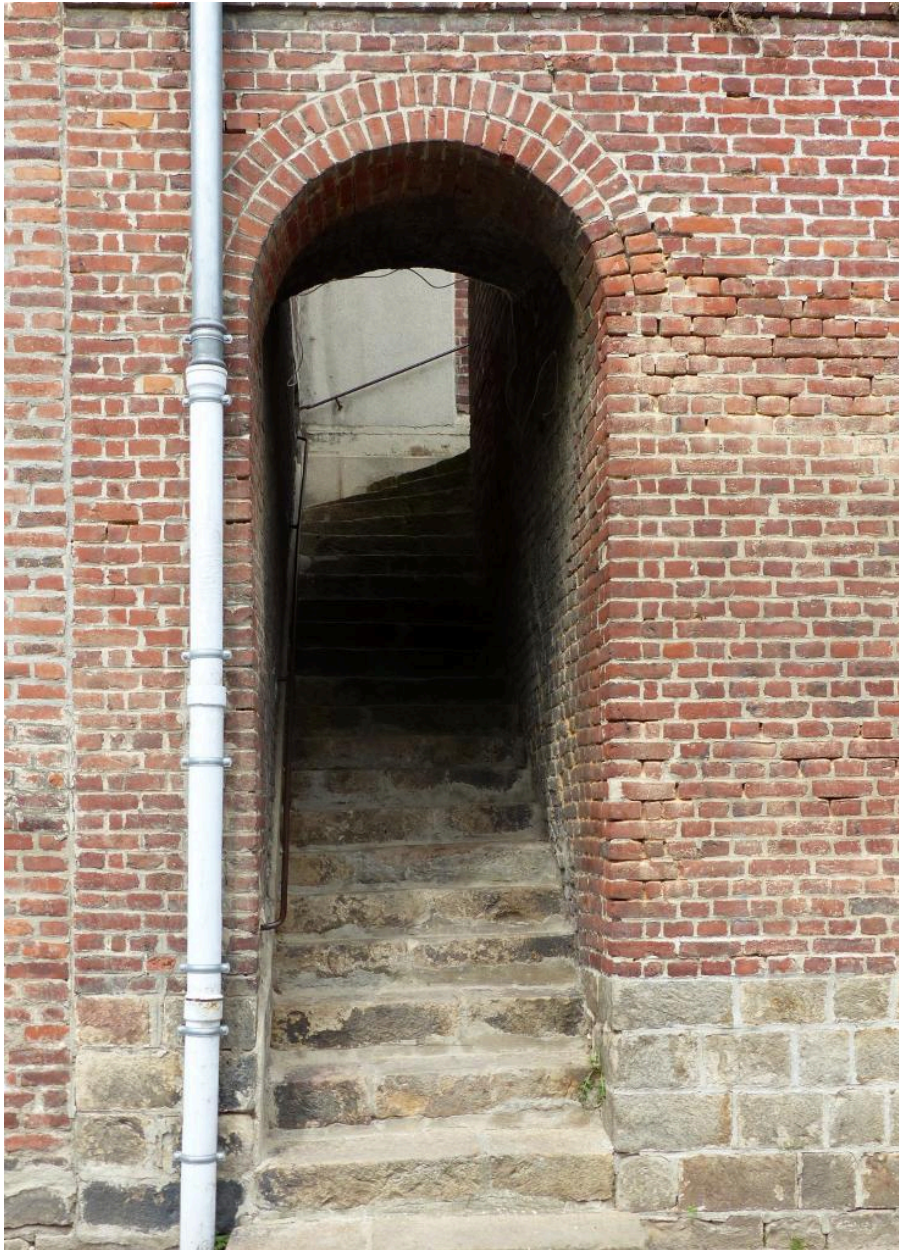
Passage et escalier reliant la rue Fournier à la rue du Collège.