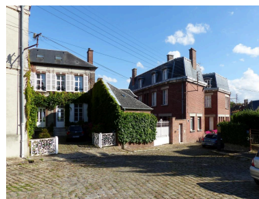
Les demeures reconstruites à l'emplacement de l'ancien couvent de Minimes (anciens hôtels de Boutteville et Dehaussy de Maigremont).