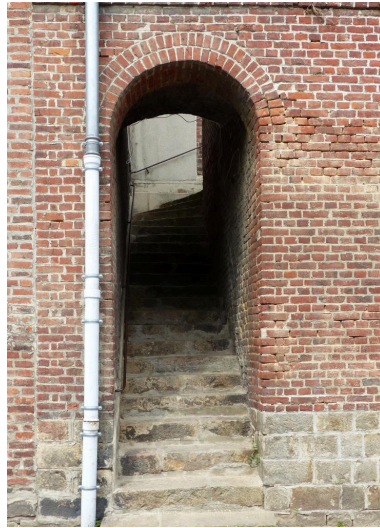
Passage et escalier reliant la rue Fournier à la rue du Collège.