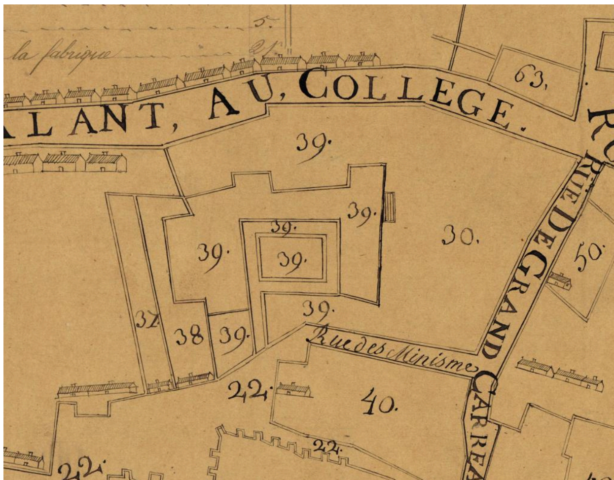
Le couvent de minimes sur le plan et figure des églises, cimetières, maisons et lieux étant de la censive et justice du chapitre de St Fursy de Péronne [18e siècle] (Bibliothèque nationale de France, GED-2757).