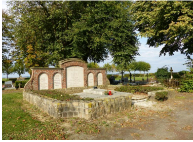
Vue générale. IVR32_20188005116NUCA