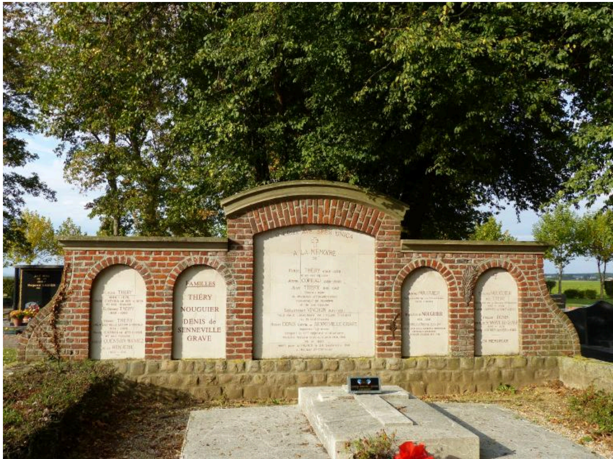
Vue de la stèle.