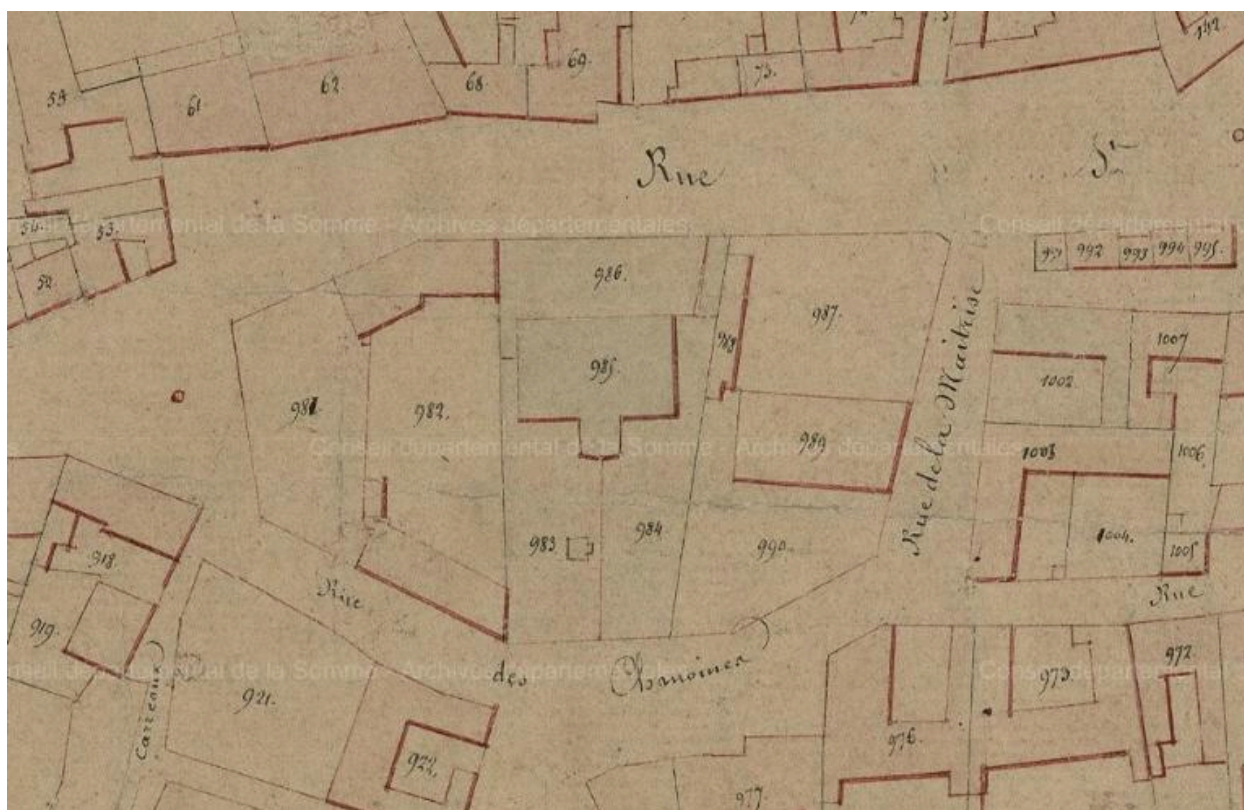
Extrait du cadastre napoléonien, section B, vers 1830 (AD Somme ; 3P 2065/4).