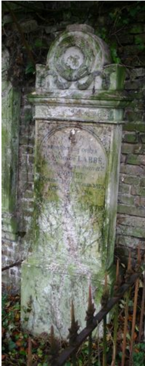
Stèle à fronton cintré.