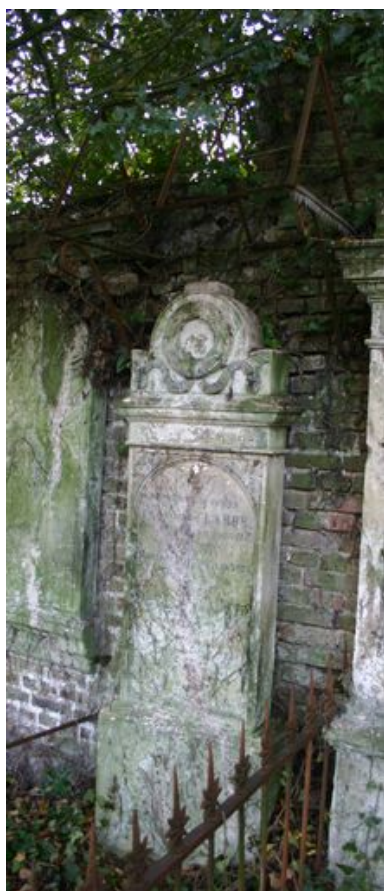
Stèle à fronton cintrée, protégée par un petit auvent.