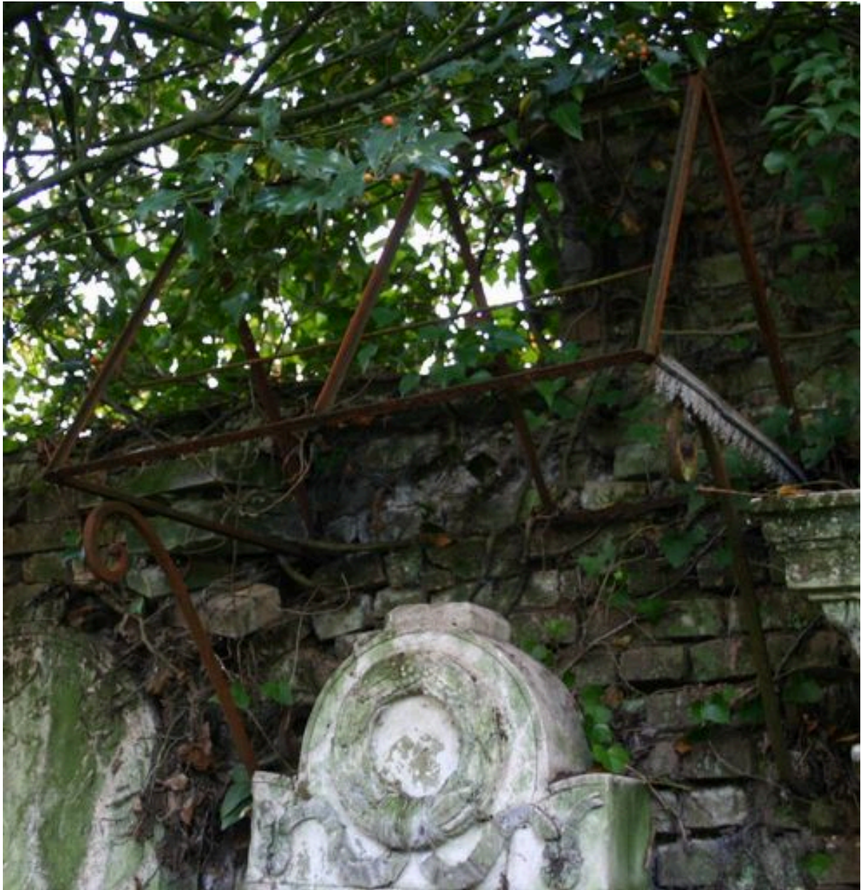
Armature métallique du petit auvent protégeant la stèle à fronton cintré.