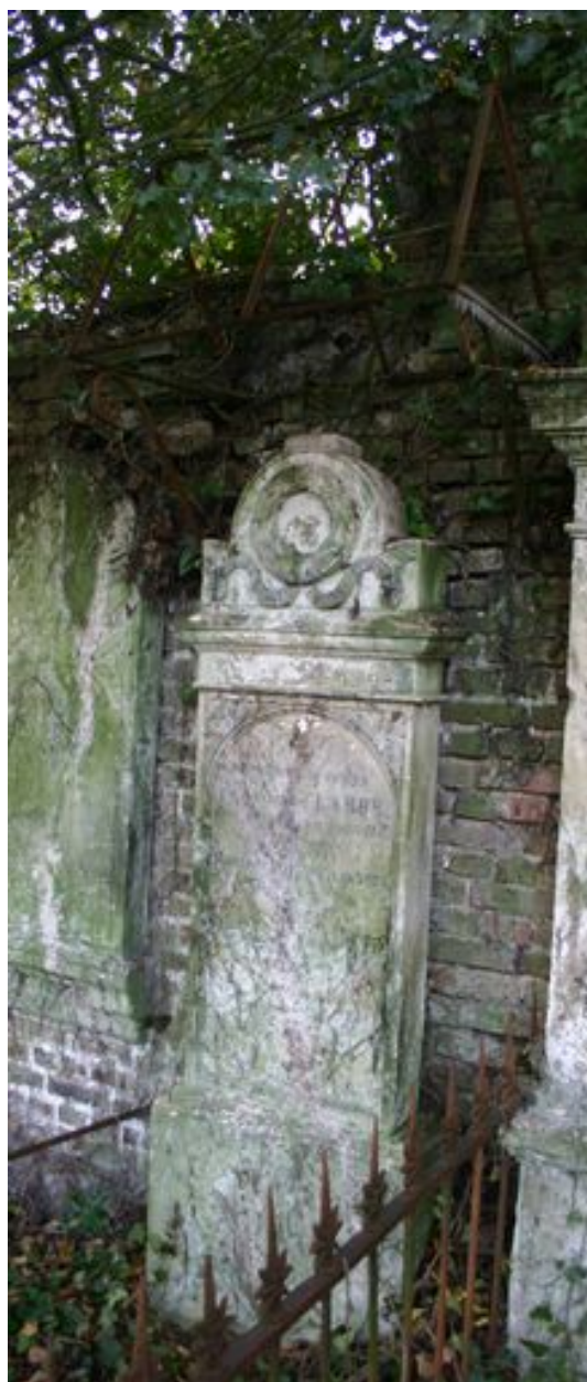
Stèle à fronton cintrée, protégée par un petit auvent.