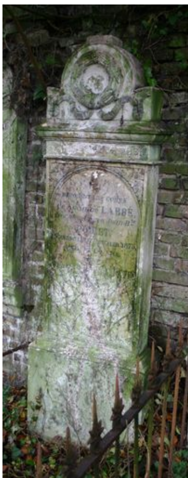
Stèle à fronton cintré. IVR22_20068001692NUCA