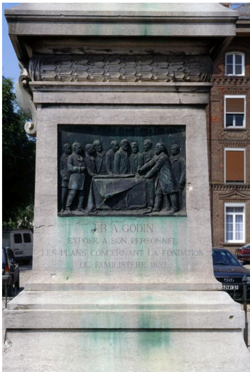
Vue du bas-relief ornant le côté droit du socle du monument : Jean-Baptiste André Godin expose à son personnel les plans concernant le Familistère, 1859.