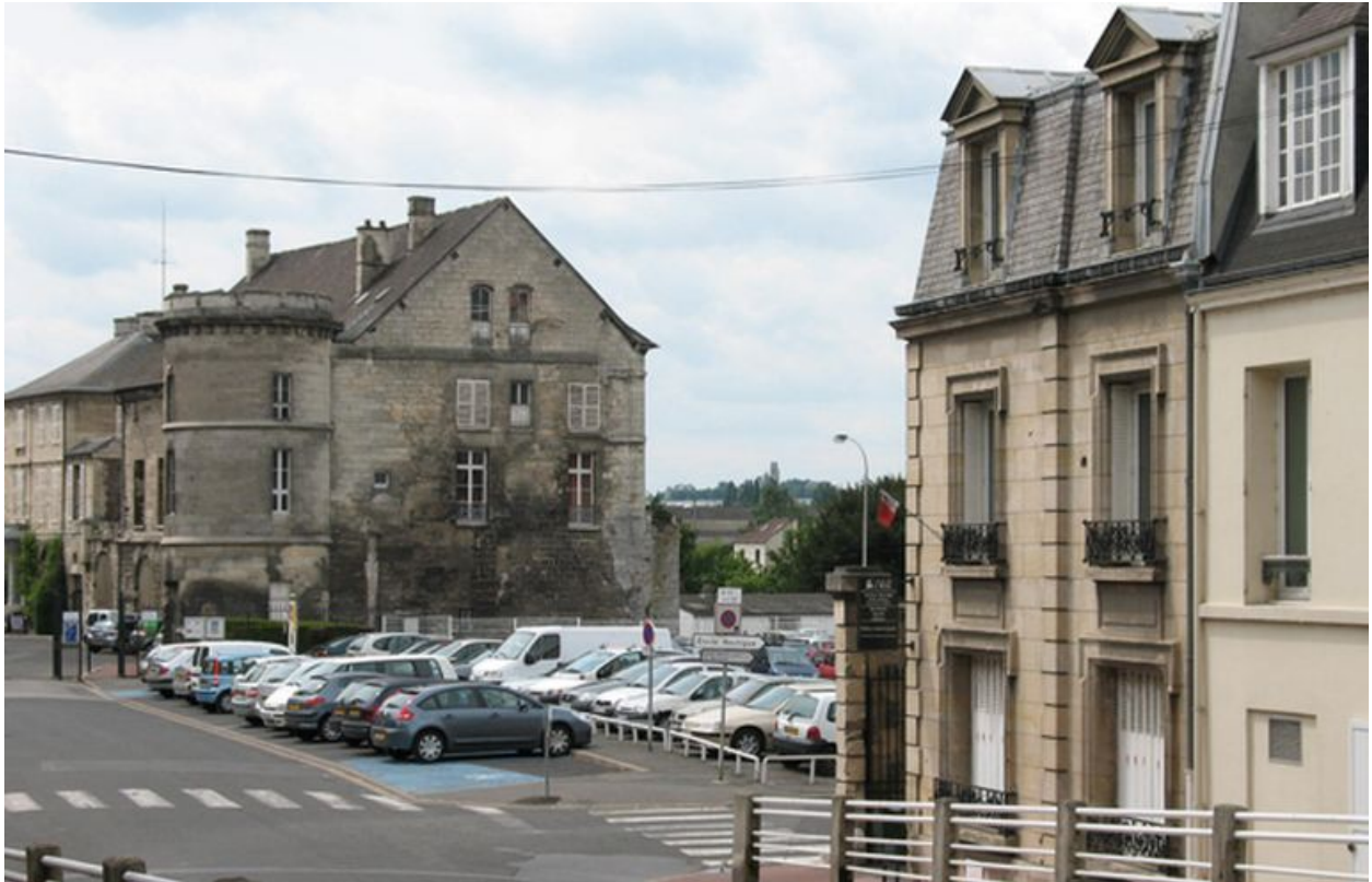
Emplacement des anciens entrepôts Willot.