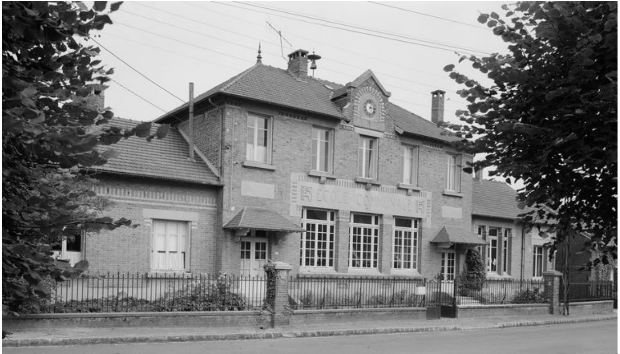
Elévation antérieure, en 1984.