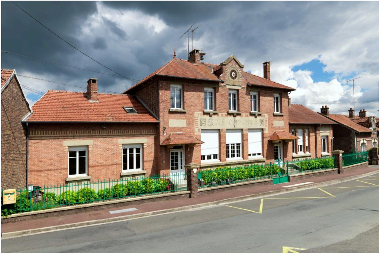
Vue de situation.