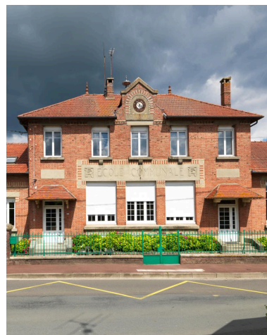
Vue du pavillon central. IVR32_20216000796NUCA