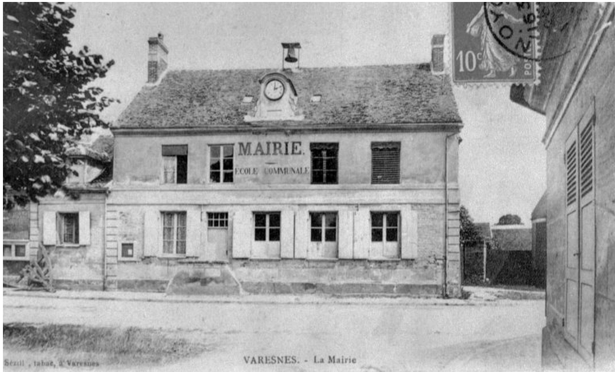
Mairie-école, avant 1914 (AP).