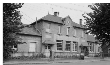
Élévation antérieure, en 1984. IVR22_19846001100X