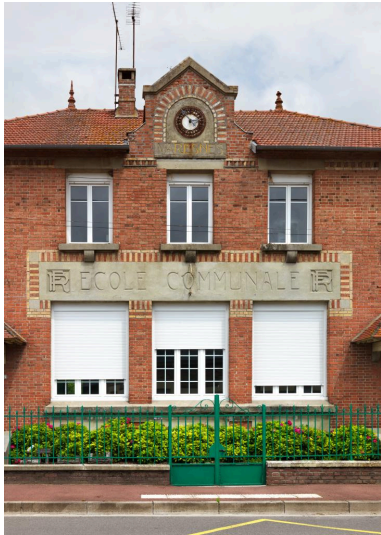
Vue des travées centrales. IVR32_20216000797NUCA