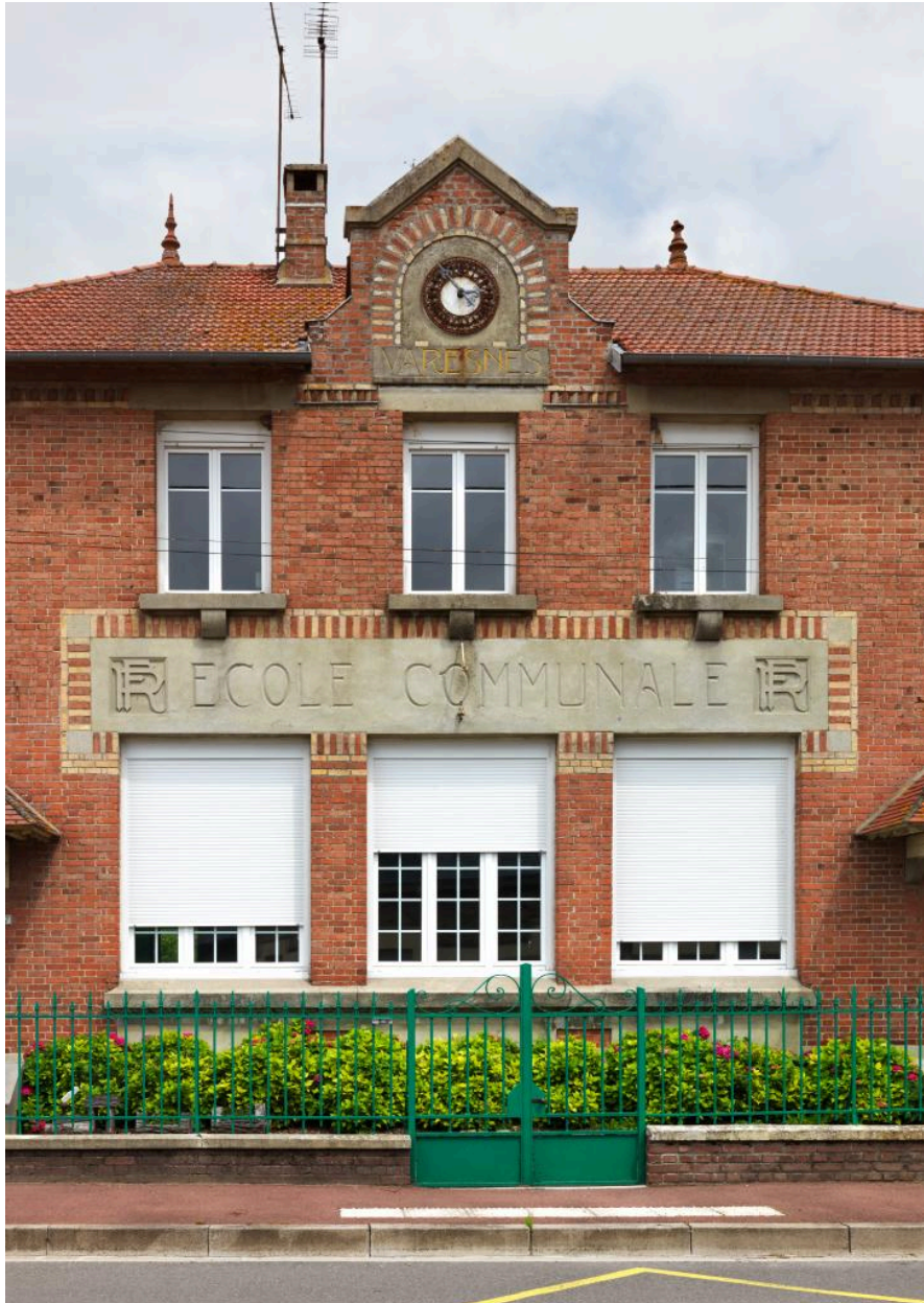
Vue des travées centrales.