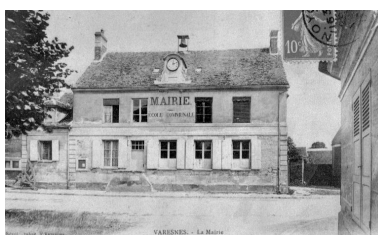
Mairie-école, avant 1914 (AP). IVR22_19856000230VB