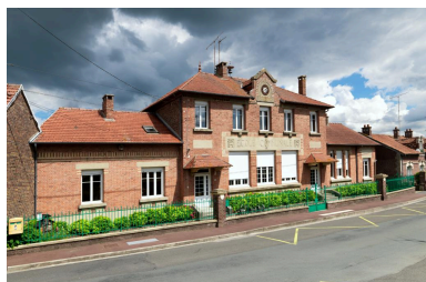
Vue de situation. IVR32_20216000794NUCA