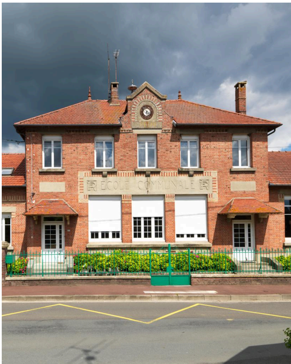
Vue du pavillon central.