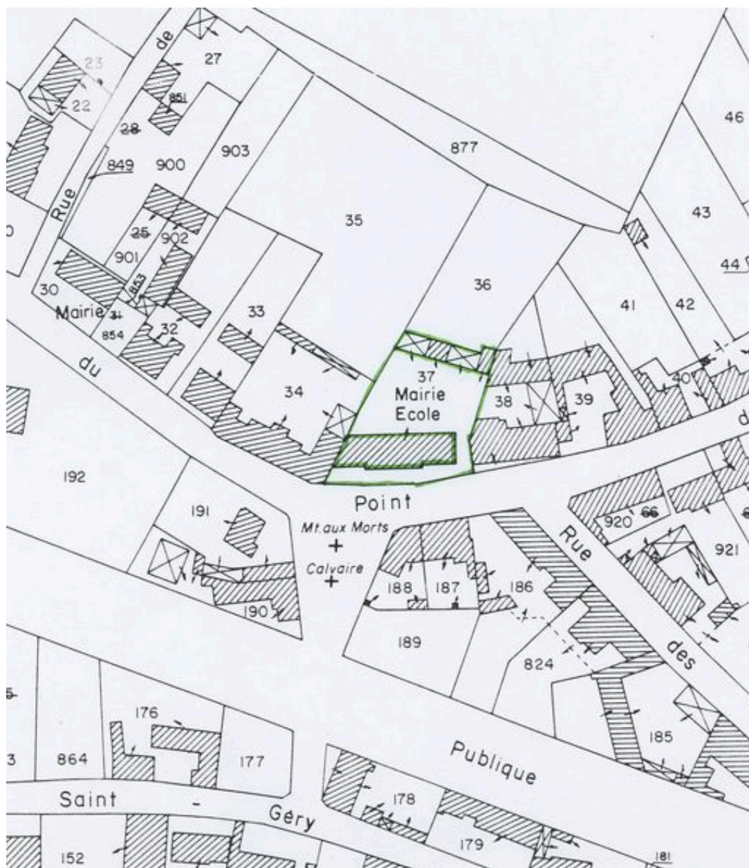
Plan de situation. Extrait du plan cadastral de 1982, section AI 37.