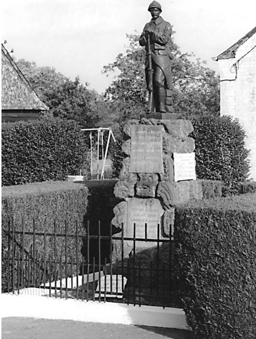
Beaumé. Monument aux morts, rue de l'Eglise.