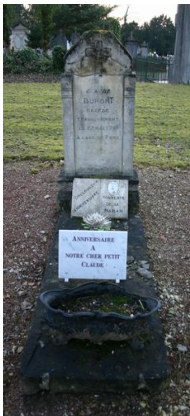
Monument particulier d'une des victimes civiles du bombardement de 1944 : stèle en granito.