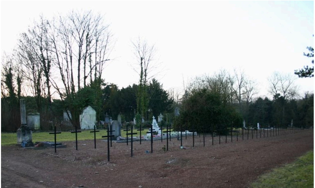
Vue générale, vers le sud-ouest.