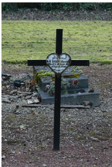
Monument particulier d'une des victimes civiles du bombardement de 1944 : croix funéraire.