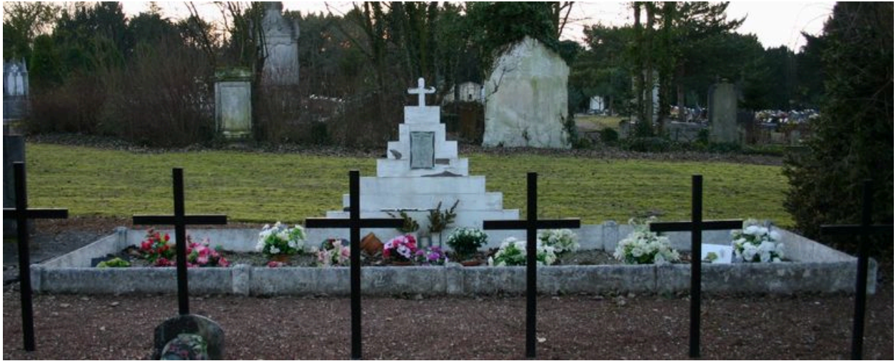
Monument particulier d'une famille victime civile du bombardement de 1944 : stèle de forme pyramidale.