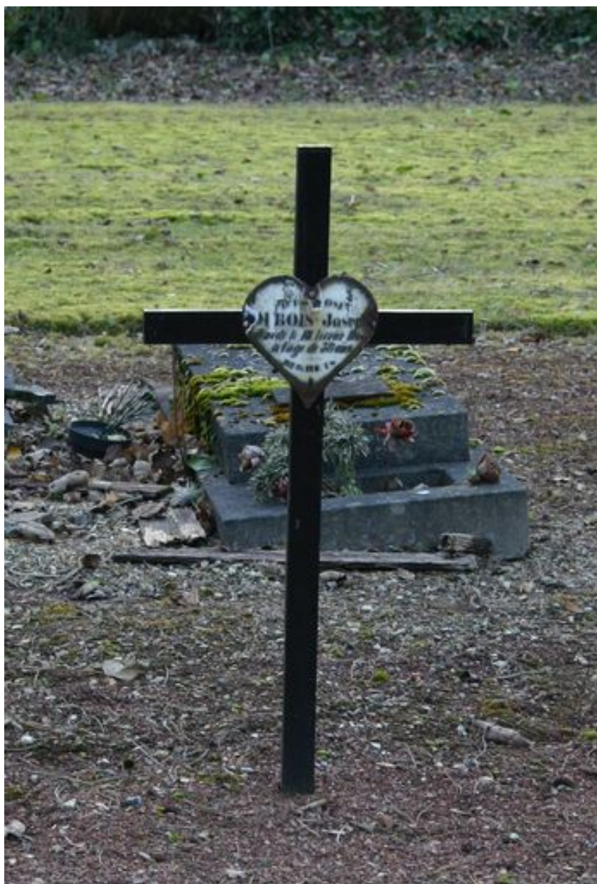
Monument particulier d'une des victimes civiles du bombardement de 1944 : croix funéraire.