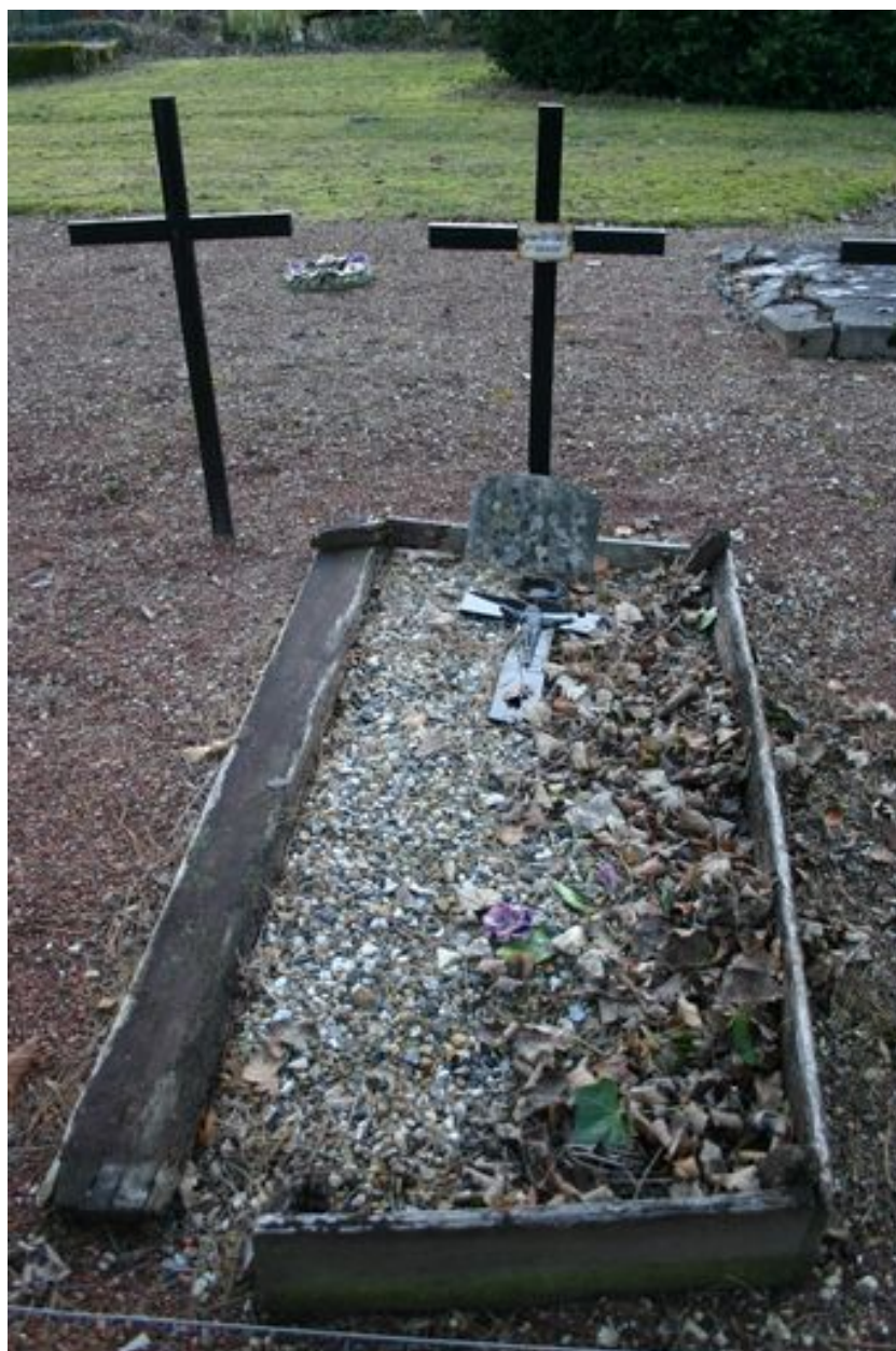
Monument particulier d'une des victimes civiles du bombardement de 1944 : croix funéraire.