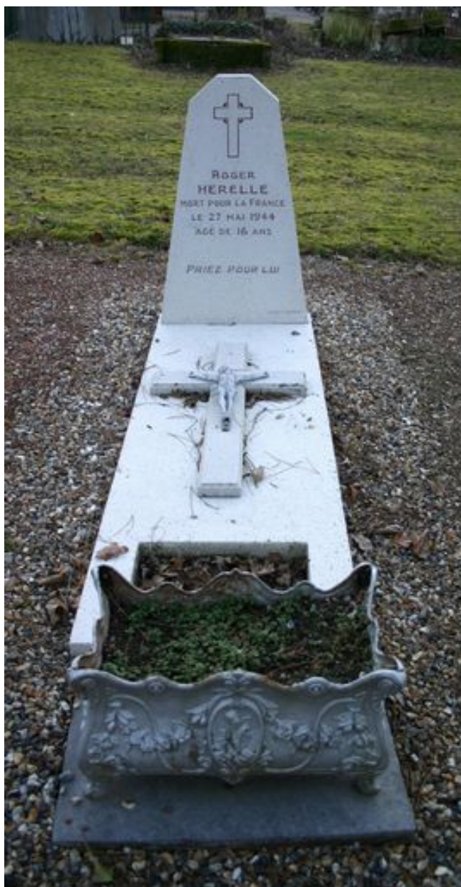
Monument particulier d'une des victimes civiles du bombardement de 1944 : stèle en granito.