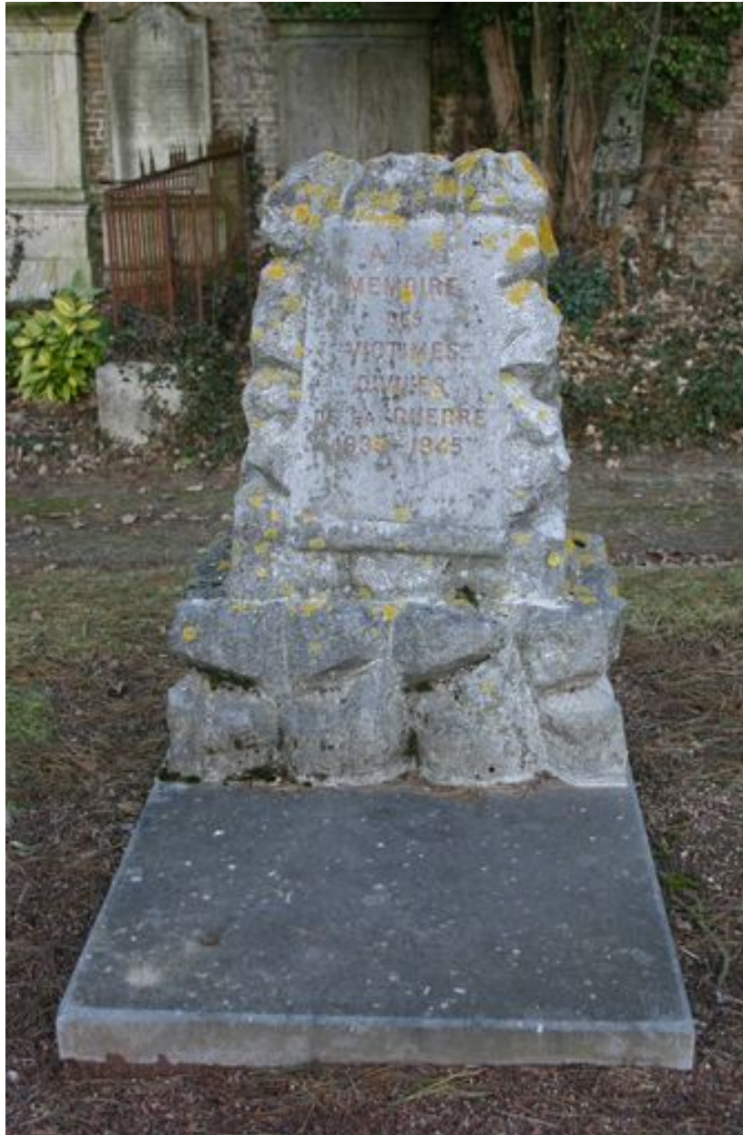
Monument commémoratif des victimes civiles du bombardement de 1944.