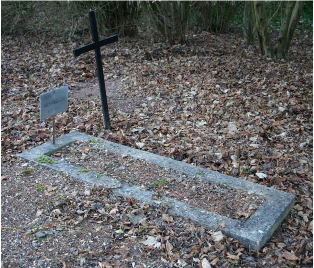
Monuments particuliers de victimes civiles du bombardement de 1944.