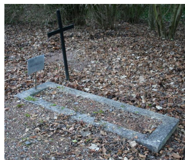
Monuments particuliers de victimes civiles du bombardement de 1944.