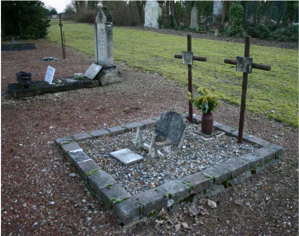
Monuments particuliers de victimes civiles du bombardement de 1944.