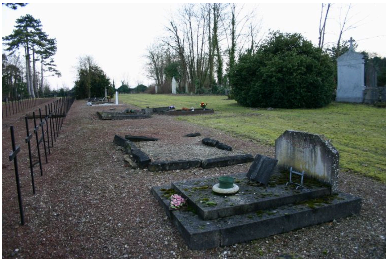
Monuments particuliers de victimes civiles du bombardement de 1944 : vue vers l'est.