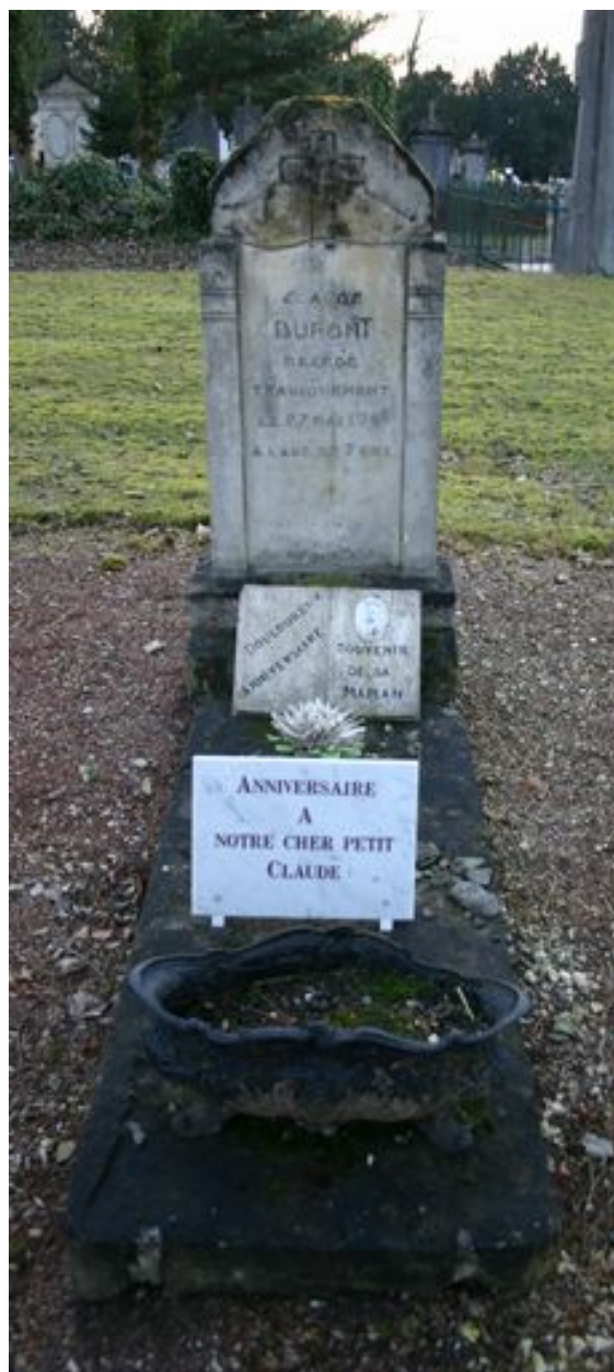
Monument particulier d'une des victimes civiles du bombardement de 1944 : stèle en granito.