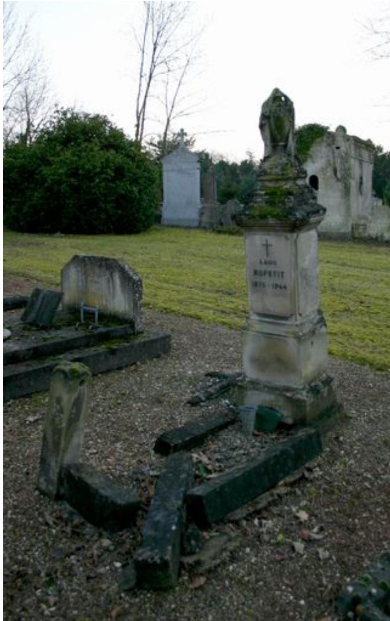
Monument particulier d'une des victimes civiles du bombardement de 1944 : cippe.