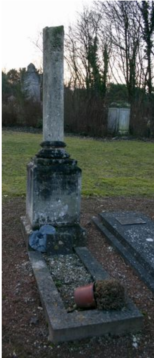
Monument particulier d'une des victimes civiles du bombardement de 1944 : colonne funéraire.