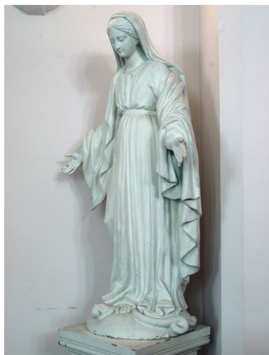
Vue latérale IVR31_20106203140NUCA