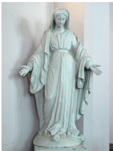
Vue générale IVR31_20106203139NUCA