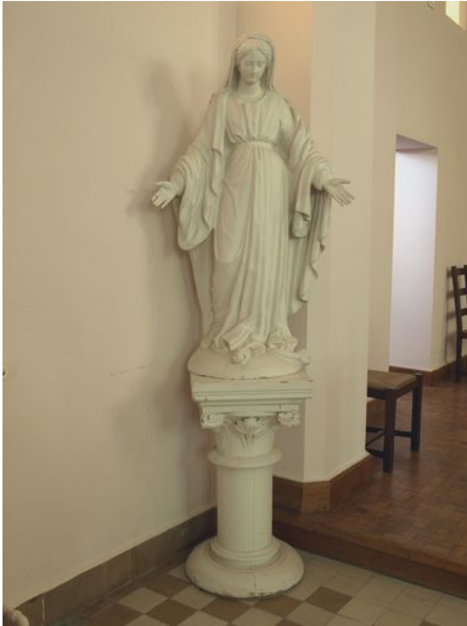
Vue générale, avec socle