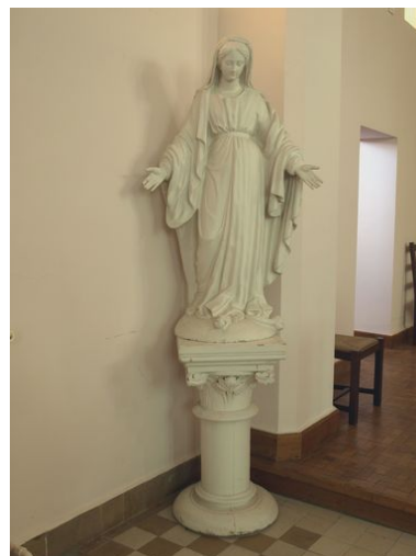
Vue générale, avec socle IVR31_20106203138NUCA