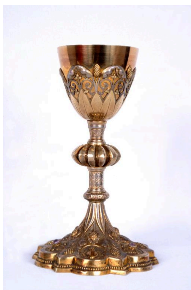
Calice. IVR22_20008000780ZA