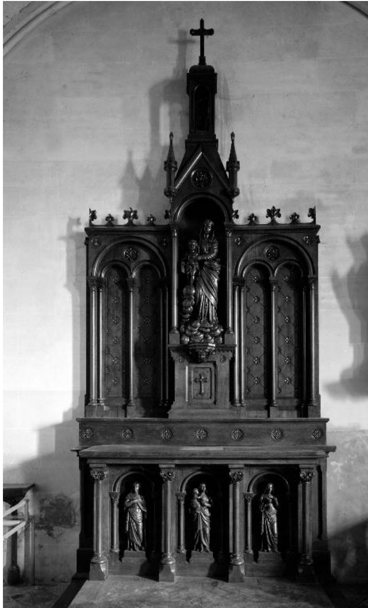
Autel secondaire de la Vierge (Notre Dame des Victoires), chapelle nord.