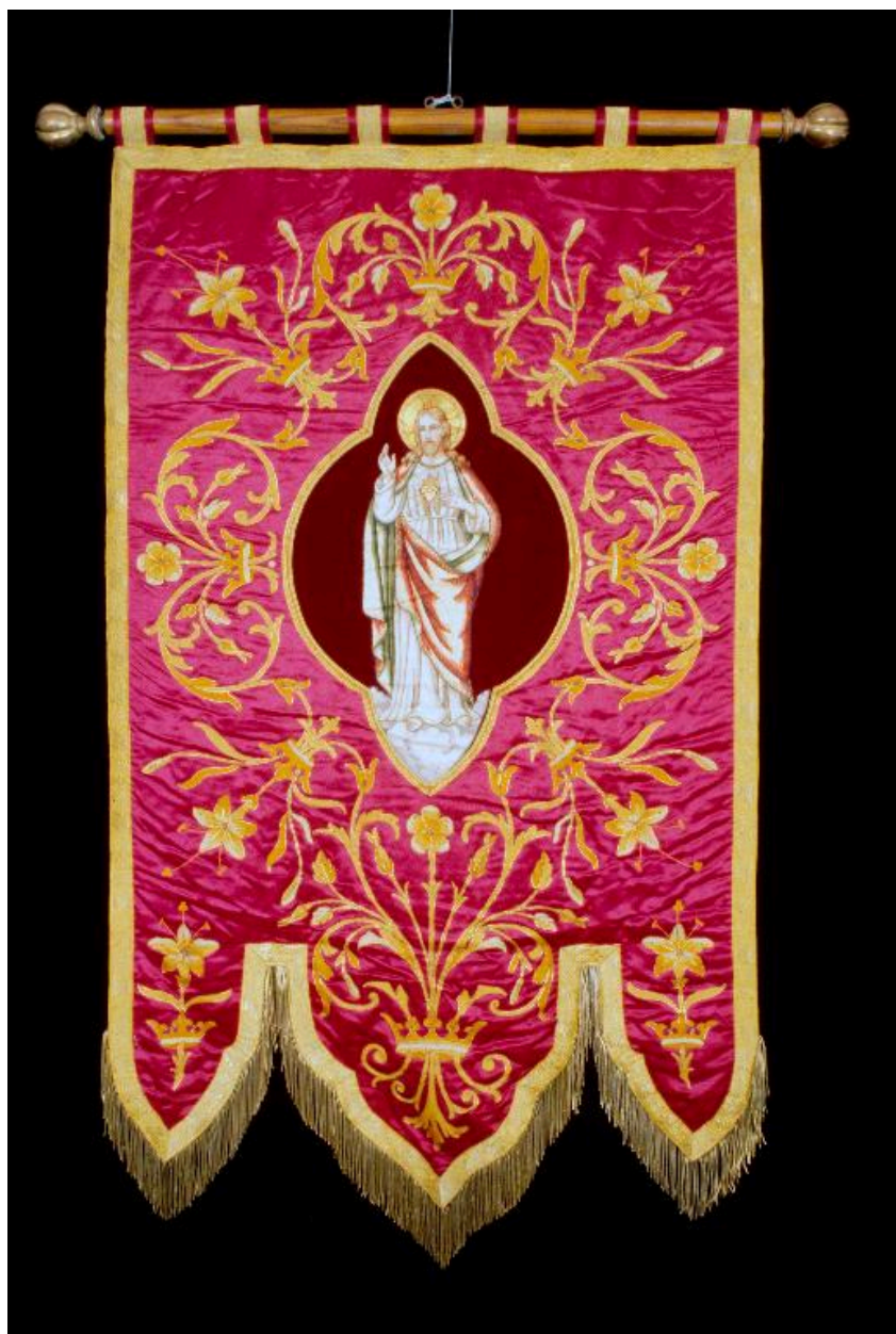
Bannière de procession : Christ du Sacré-Coeur.