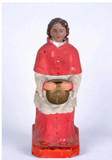
Tronc représentant un cardinal.

Bannière de procession : Christ du Sacré-Coeur.