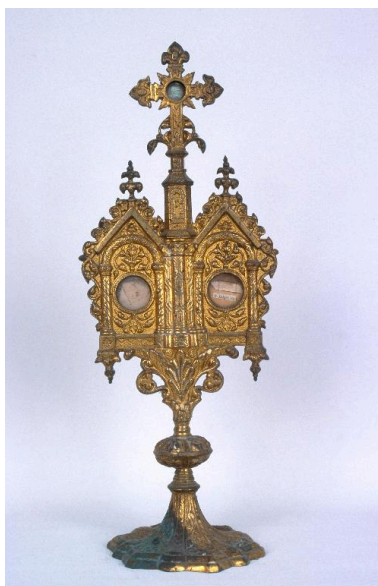
Reliquaire de saint Eloi. IVR22_20008000778ZA

IVR22_20008000784ZA