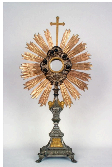
Ostensoir. IVR22_20008000779ZA

IVR22_20008000783ZA