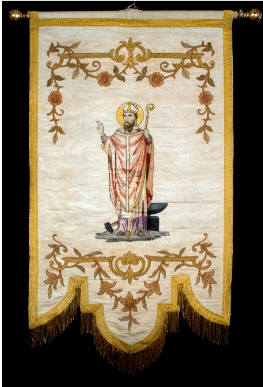
Bannière de procession : saint Eloi.