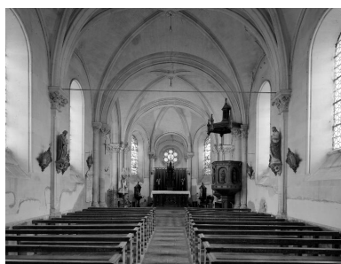
Vue intérieure, vers le chœur. IVR22_19978000868V