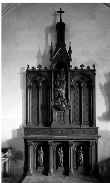
Autel secondaire de la Vierge (Notre Dame des Victoires), chapelle nord.