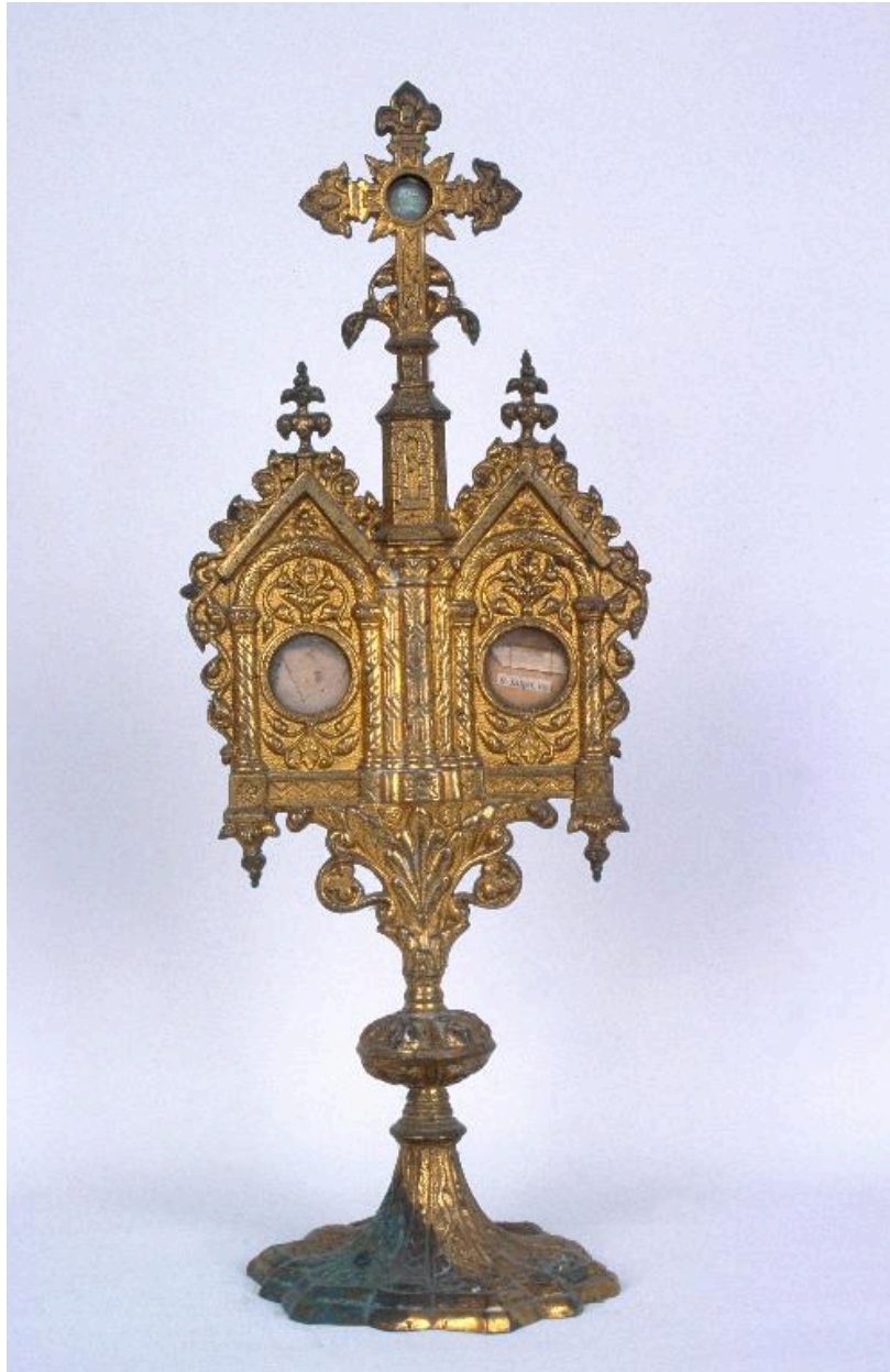
Reliquaire de saint Eloi.