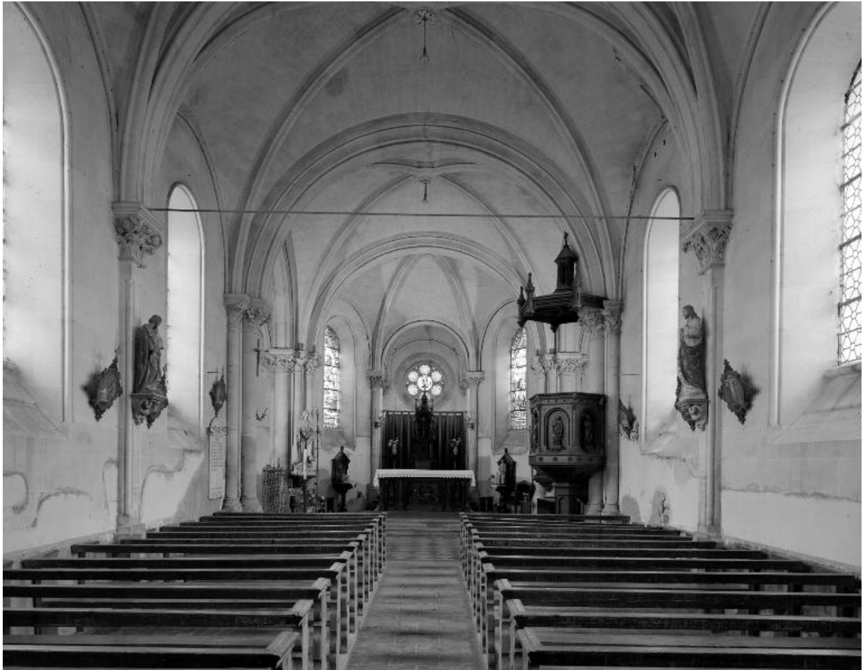
Vue intérieure, vers le chœur.