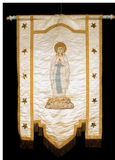
Bannière de procession : Vierge de Lourdes.