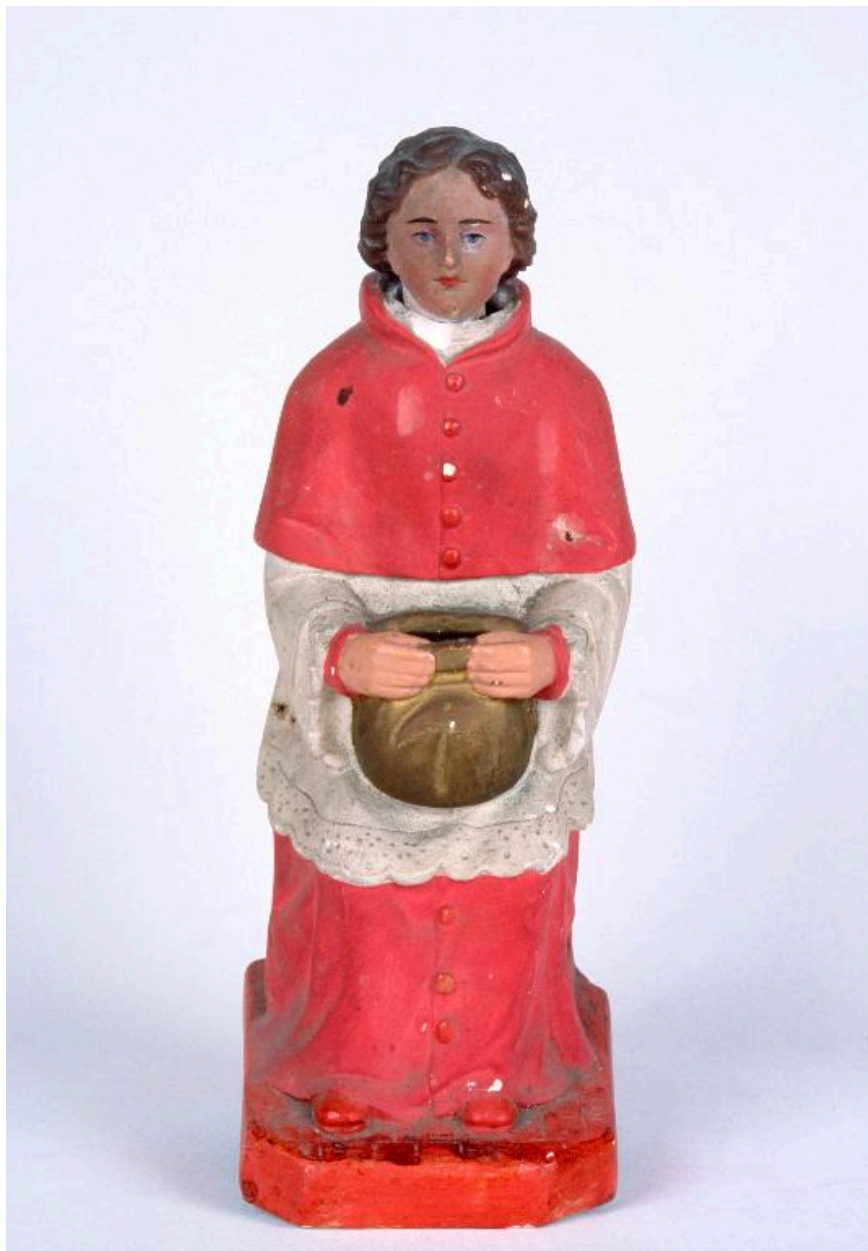
Tronc représentant un cardinal.