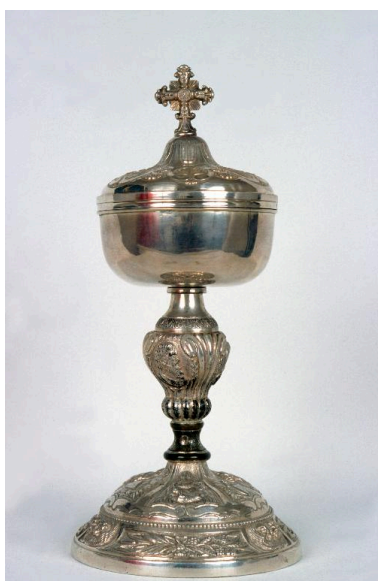
Ciboire. IVR22_20008000781ZA