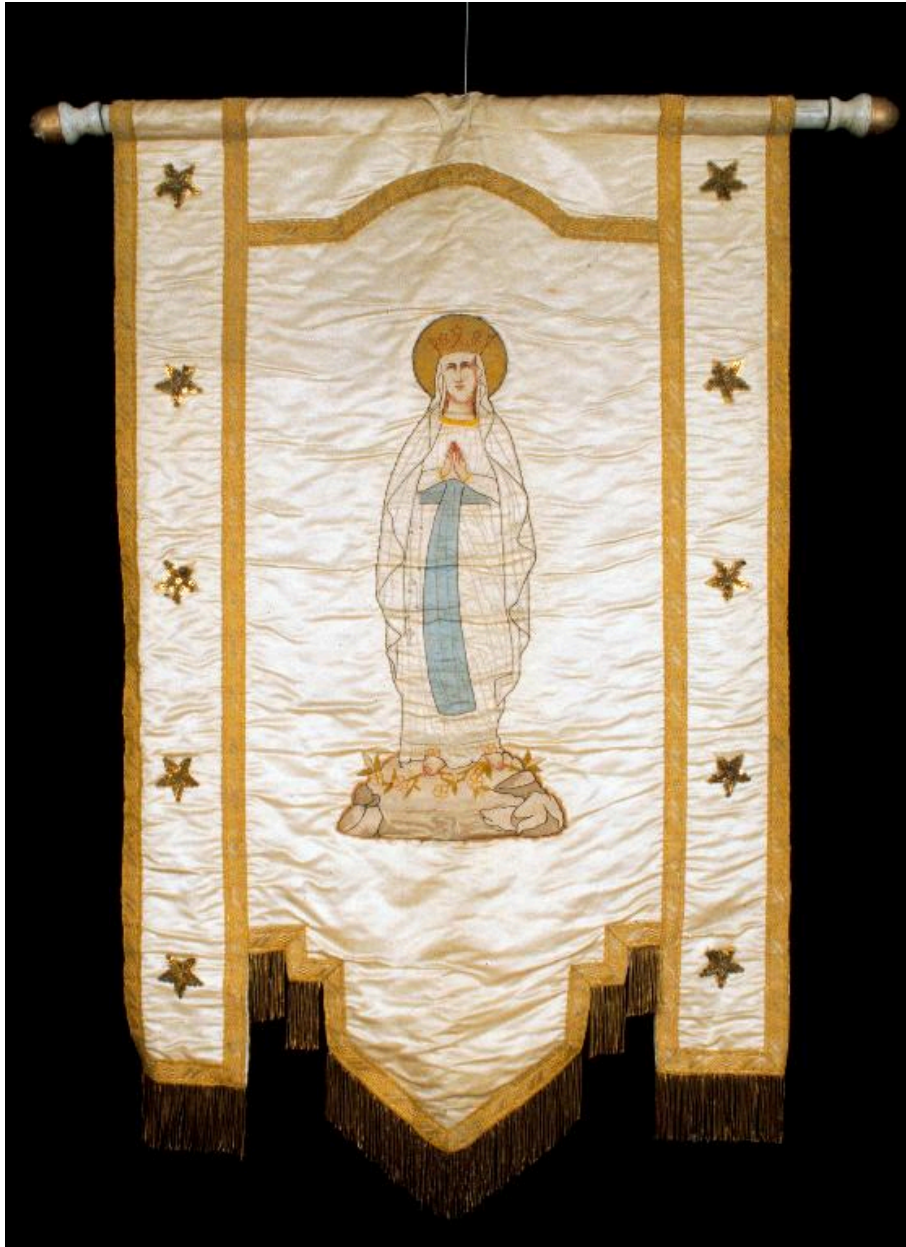
Bannière de procession : Vierge de Lourdes.