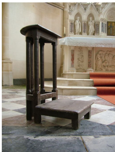
Tabouret de chantre, chêne, 19e siècle. IVR22_20108001719NUCA