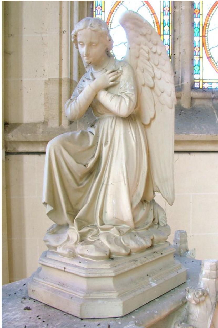
Statue : un des deux anges adoreurs surmontant le maître-autel, plâtre, 4e quart du 19e siècle.