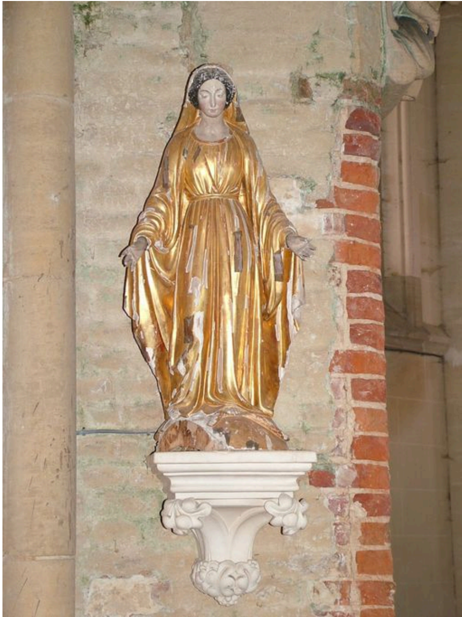
Statue : l'Immaculée Conception, bois polychrome et doré, 3e quart du 19e siècle.