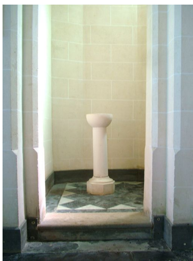
Fonts baptismaux, calcaire, 4e quart du 19e siècle. IVR22_20108001743NUCA