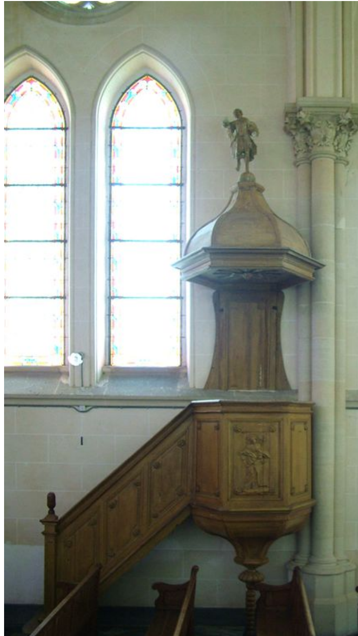
Chaire à prêcher, chêne, 4e quart du 19e siècle.