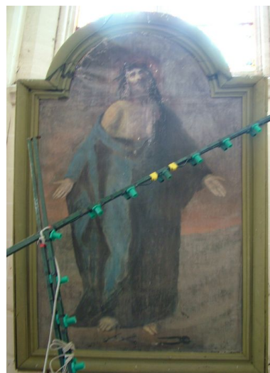
Tableau : Ecce homo, huile sur toile, milieu du 20e siècle. IVR22_20108001727NUCA