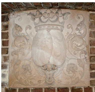
Bas-relief de la crypte aux armoiries d'alliance des familles de Sauzay et des Essarts.