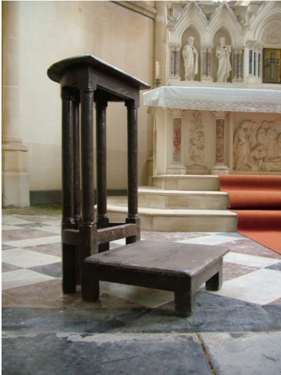
Tabouret de chantre, chêne, 19e siècle.