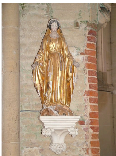
Statue : l'Immaculée Conception, bois polychrome et doré, 3e quart du 19e siècle.