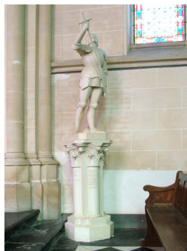
Statue : Jeanne d'Arc et son socle, plâtre, 2e quart du 20e siècle. IVR22_20108001744NUCA