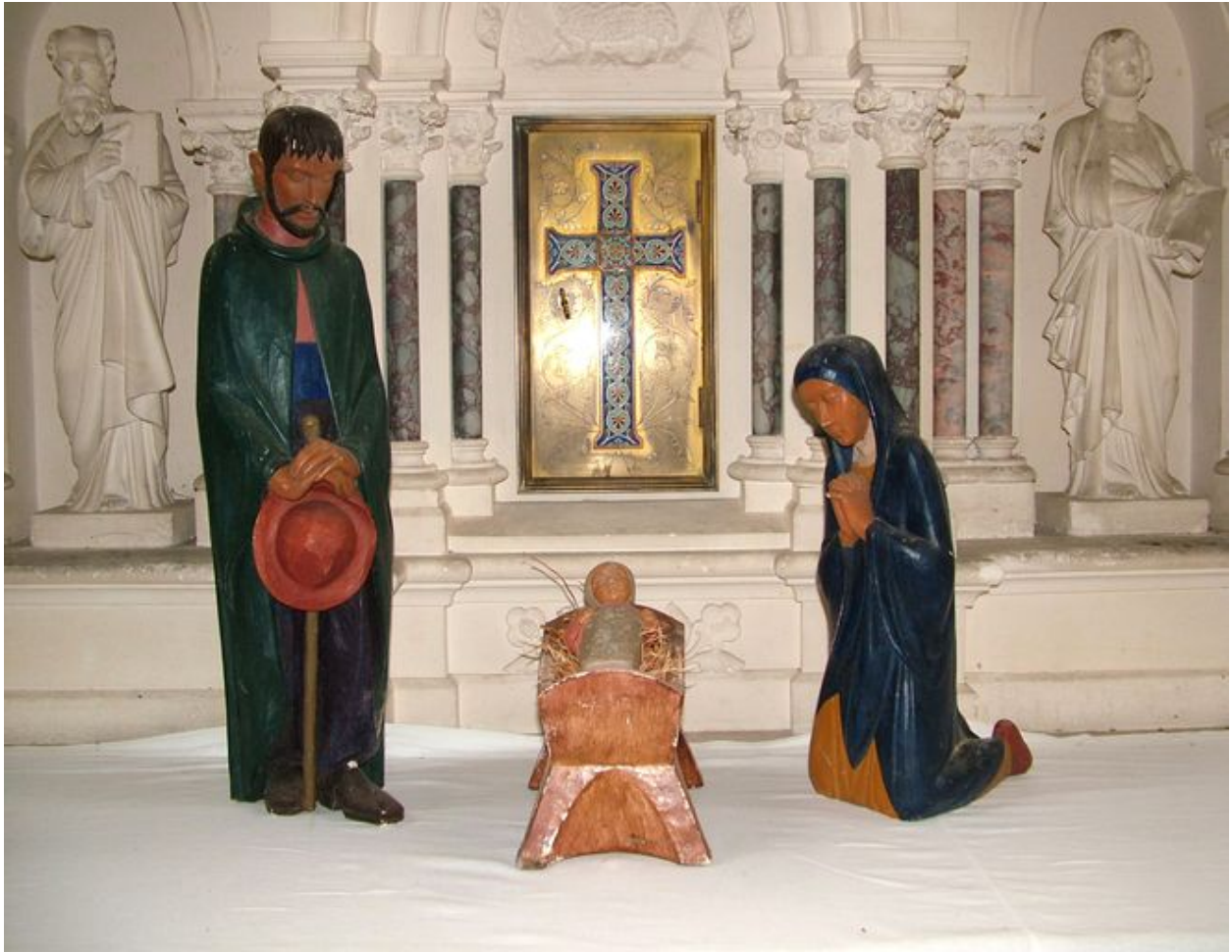
Crèche, signée F. P., plâtre polychrome, 4e quart du 20e siècle.