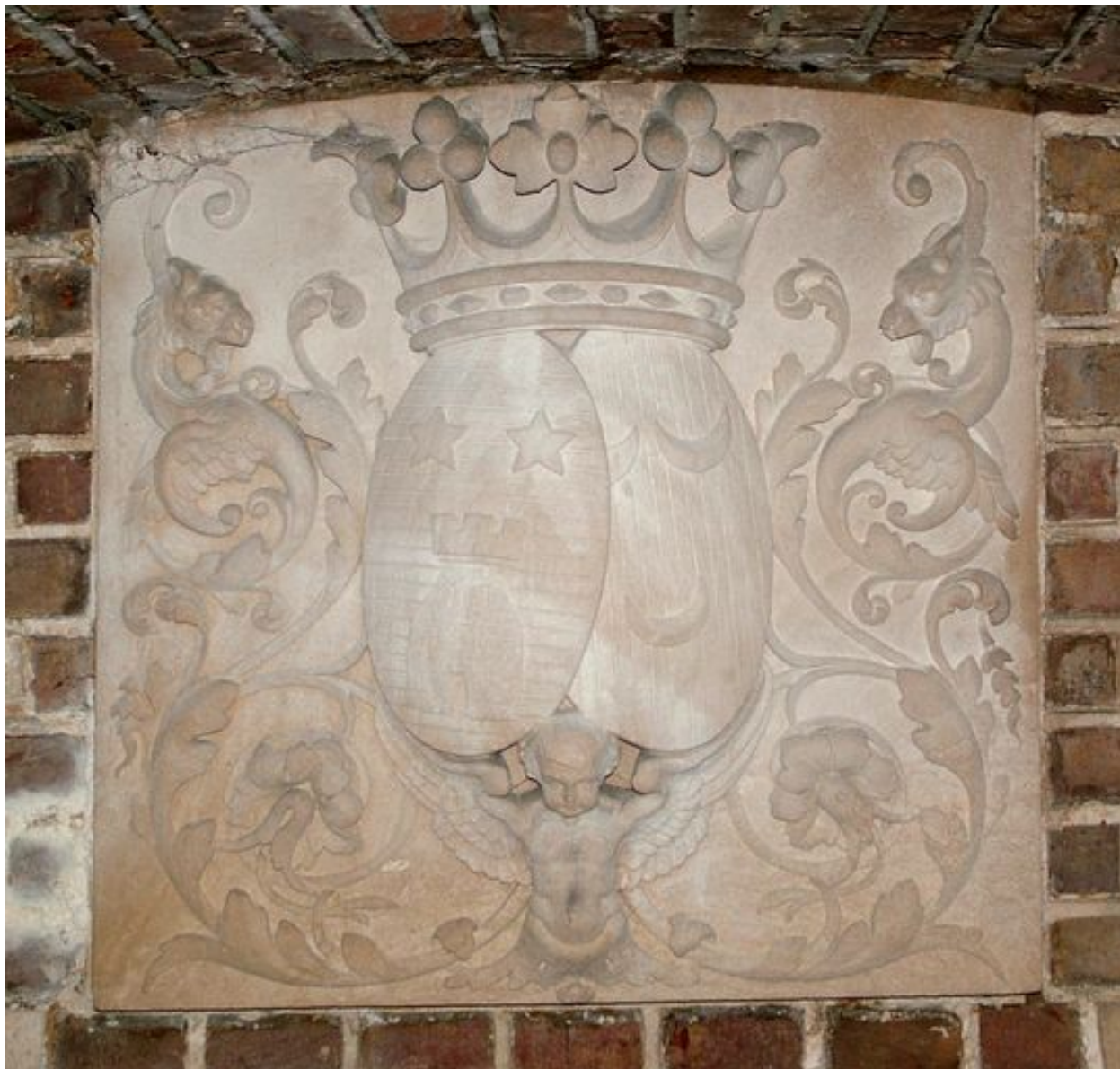
Bas-relief de la crypte aux armoiries d'alliance des familles de Sauzay et des Essarts.