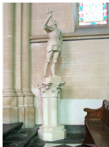
Statue : Jeanne d'Arc et son socle, plâtre, 2e quart du 20e siècle. IVR22_20108001744NUCA