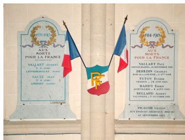
Tableaux commémoratifs des morts des deux guerres mondiales, marbre, 1ère moitié du 20e siècle. IVR22_20108001729NUCA