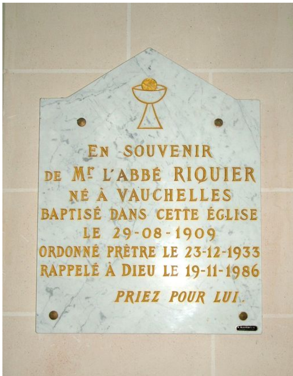
Plaque commémorative de l'abbé Riquier, marbre, 4e quart du 20e siècle.