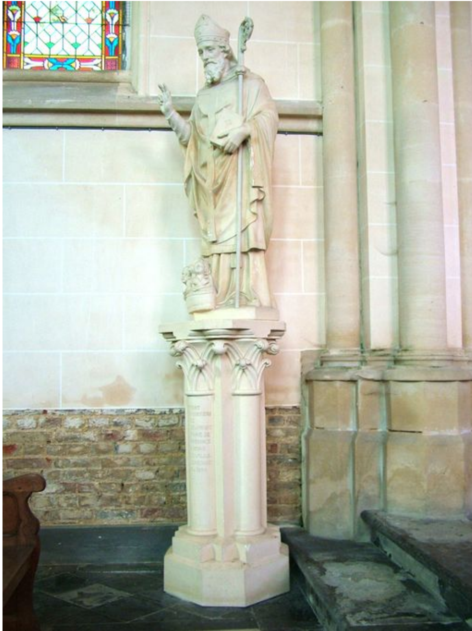
Statue : saint Nicolas et son socle, plâtre, 2e quart du 20e siècle.