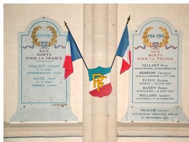
Tableaux commémoratifs des morts des deux guerres mondiales, marbre, 1ère moitié du 20e siècle.