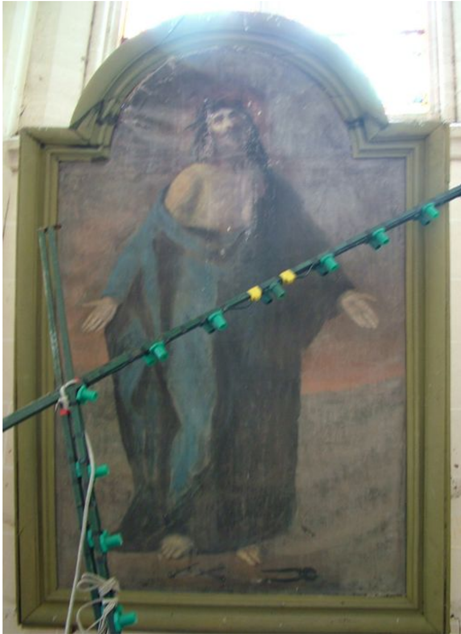
Tableau : Ecce homo, huile sur toile, milieu du 20e siècle.