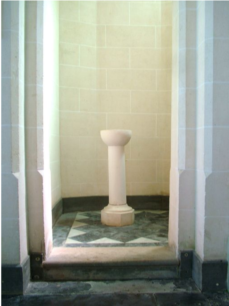
Fonts baptismaux, calcaire, 4e quart du 19e siècle.