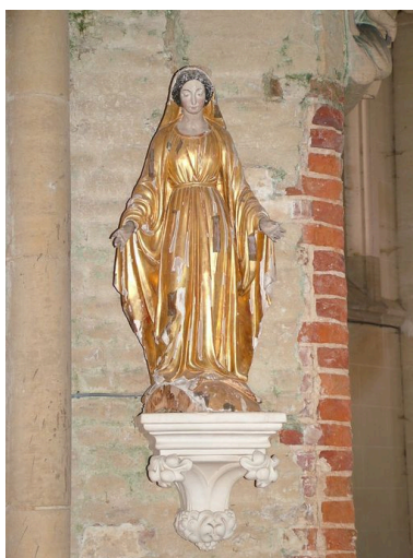
Statue : l'Immaculée Conception, bois polychrome et doré, 3e quart du 19e siècle. IVR22_20108001720NUCA