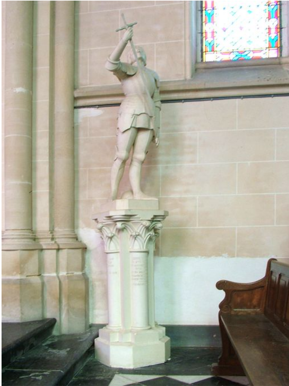
Statue : Jeanne d'Arc et son socle, plâtre, 2e quart du 20e siècle.