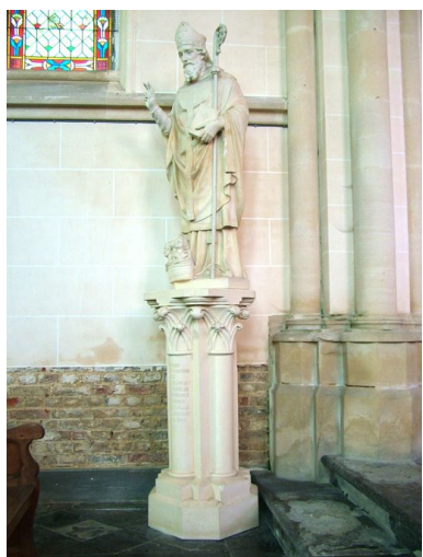
Statue : saint Nicolas et son socle, plâtre, 2e quart du 20e siècle. IVR22_20108001709NUCA