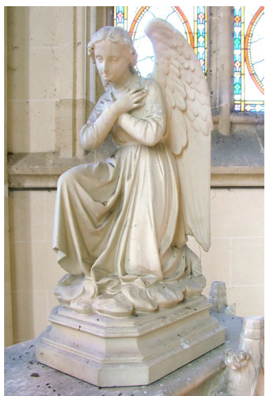
Statue : un des deux anges adorateurs surmontant le maître-autel, plâtre, 4e quart du 19e siècle.