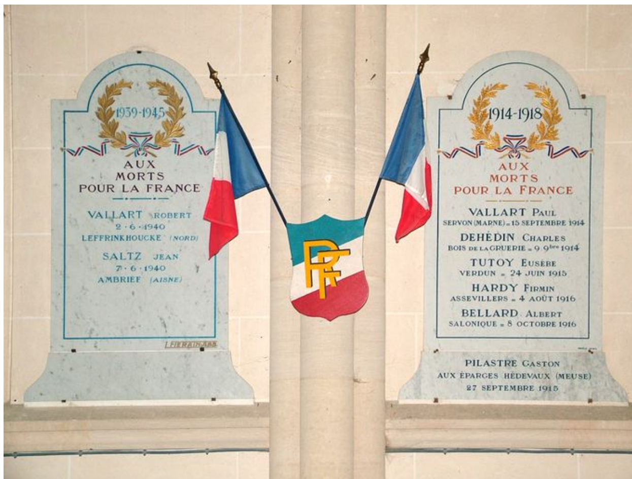
Tableaux commémoratifs des morts des deux guerres mondiales, marbre, 1ère moitié du 20e siècle.