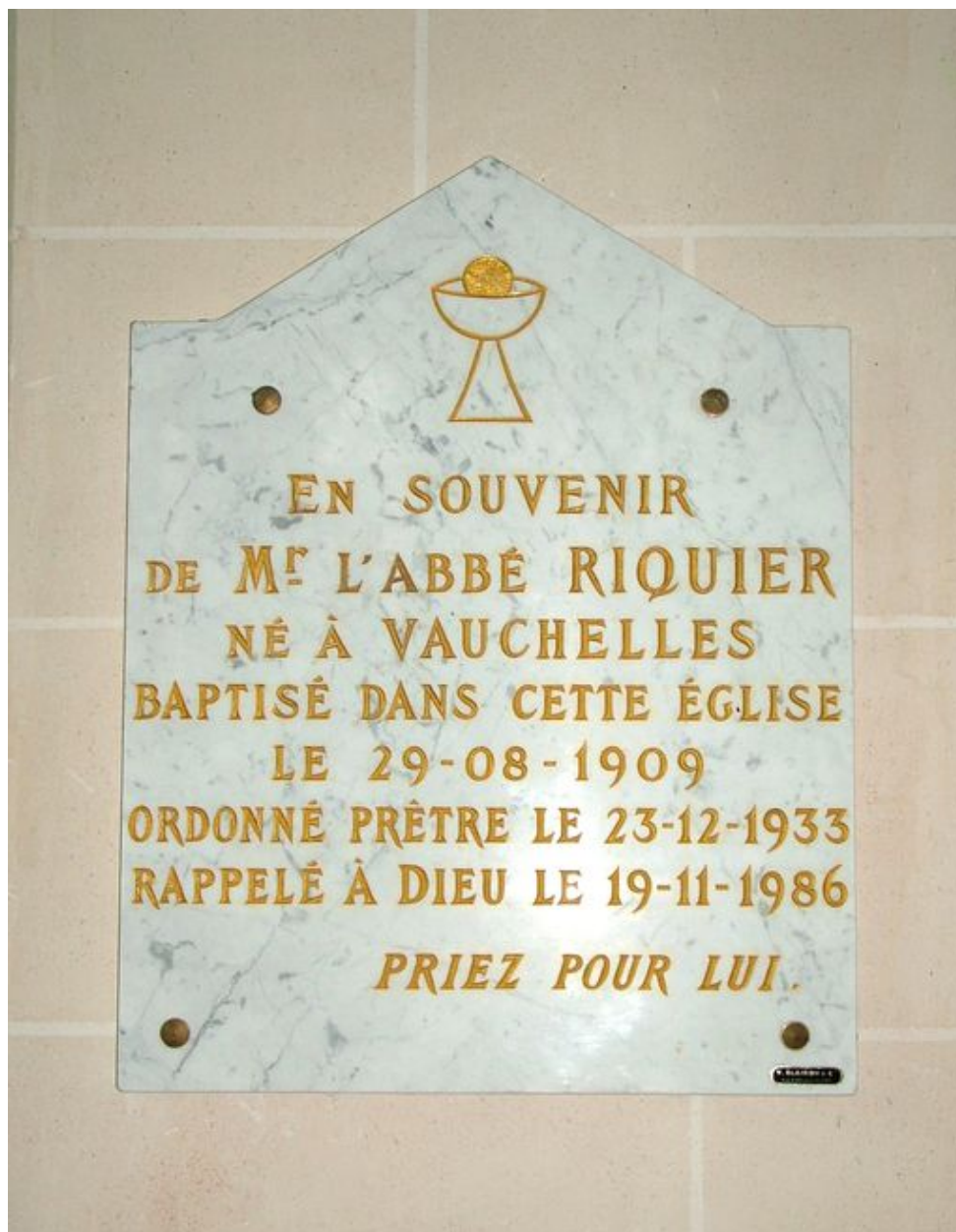
Plaque commémorative de l'abbé Riquier, marbre, 4e quart du 20e siècle.