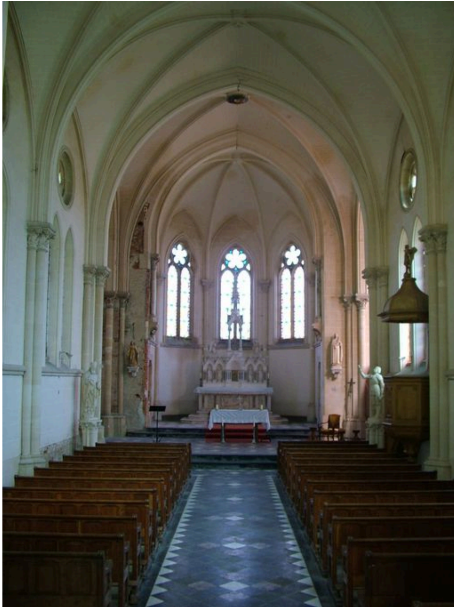
Vue générale de l'intérieur de l'église.