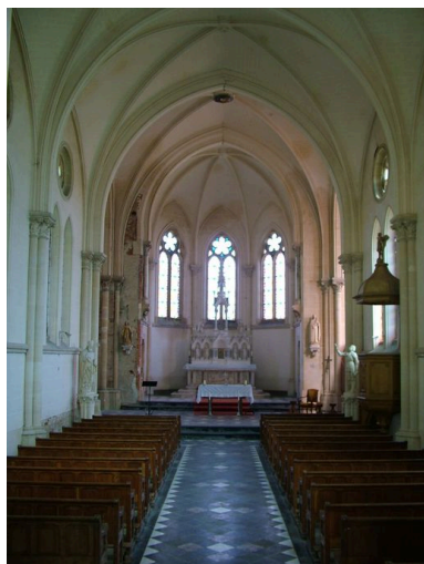
Vue générale de l'intérieur de l'église.