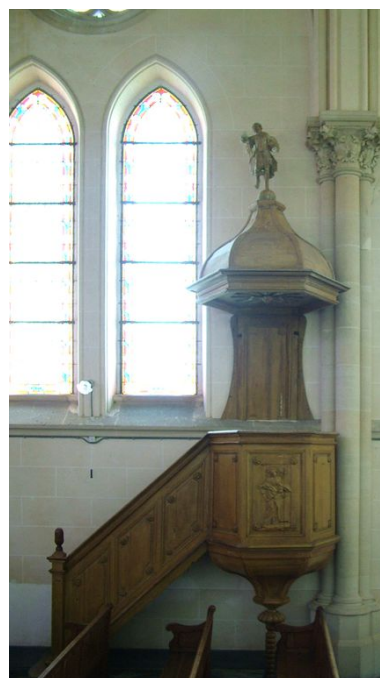
Chaire à prêcher, chêne, 4e quart du 19e siècle.