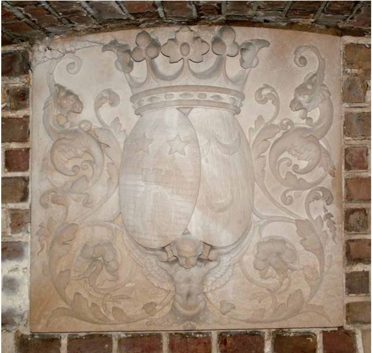
Bas-relief de la crypte aux armoiries d'alliance des familles de Sauzay et des Essarts.