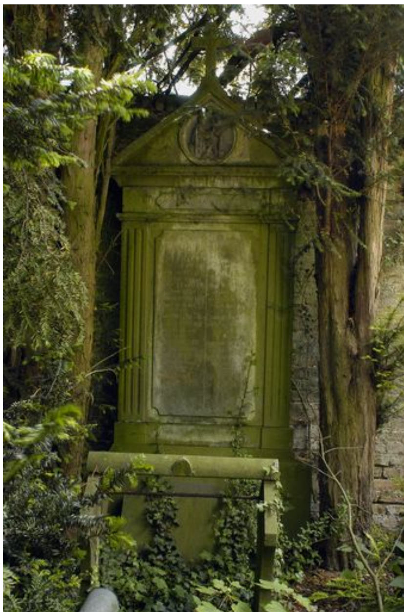
Vue de la stèle.