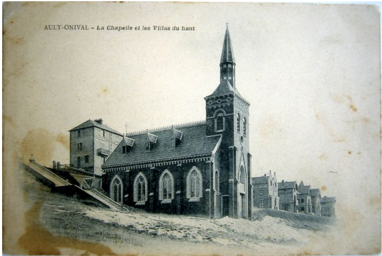
Carte postale, 1er quart 20e siècle.