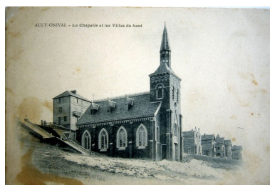
Carte postale, 1er quart 20e siècle (coll. part.). IVR22_20058000605XAB