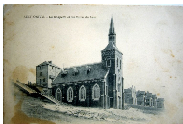
Carte postale, 1er quart 20e siècle.