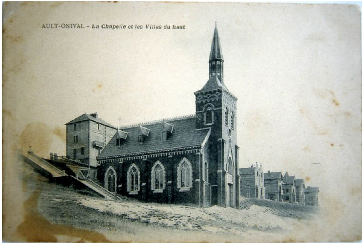
Carte postale, 1er quart 20e siècle.