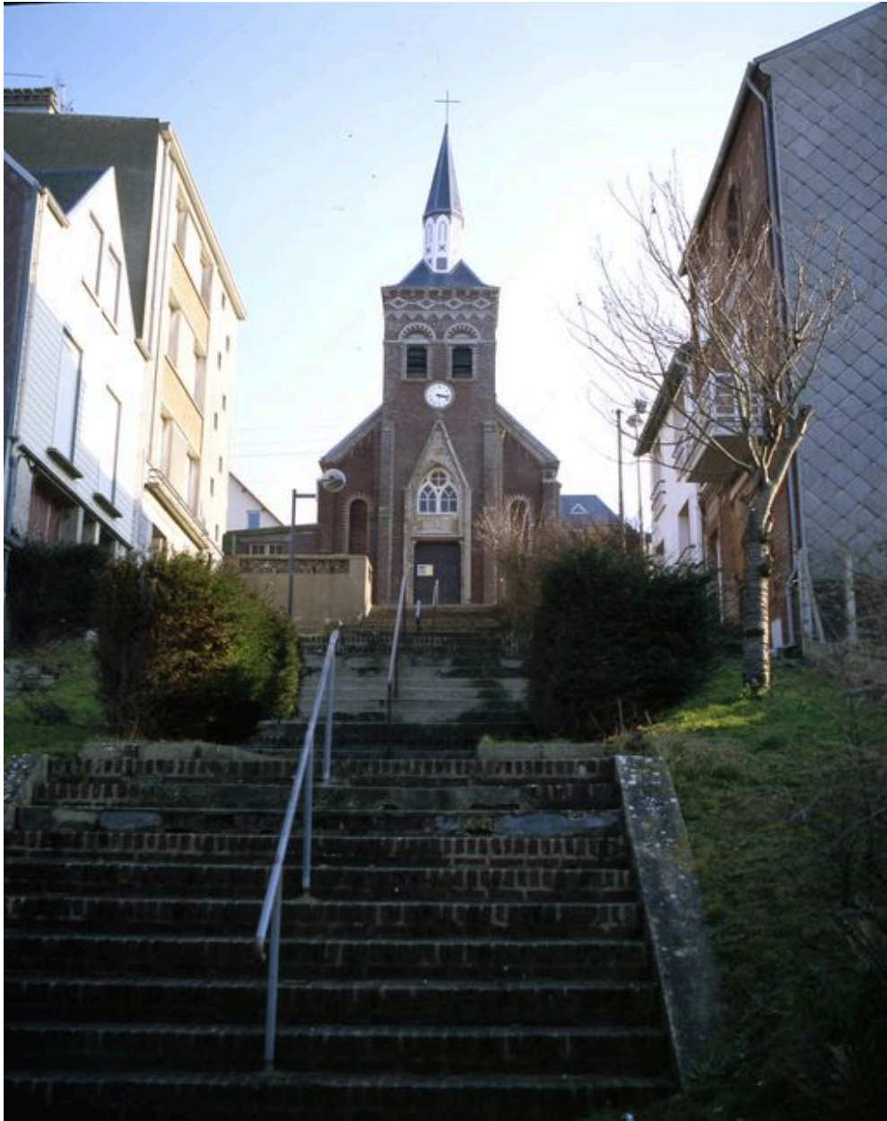
La chapelle vue depuis la rue de Saint-Valery.