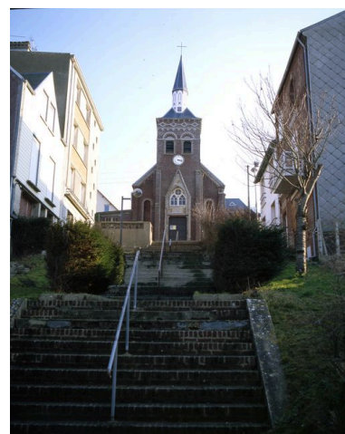
La chapelle vue depuis la rue de Saint-Valery.