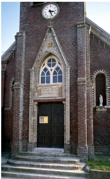
Détail de la façade occidentale.

IVR22_20058000954XA