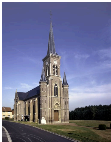
Vue générale, depuis le sud-est. IVR22_20038001107VA