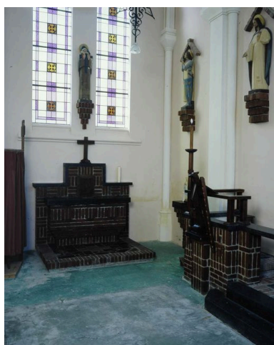
Vue de la chapelle Sainte- Thérèse (bras sud du transept).