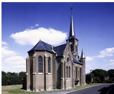
Vue générale depuis le sud-ouest. IVR22_20038000824VA