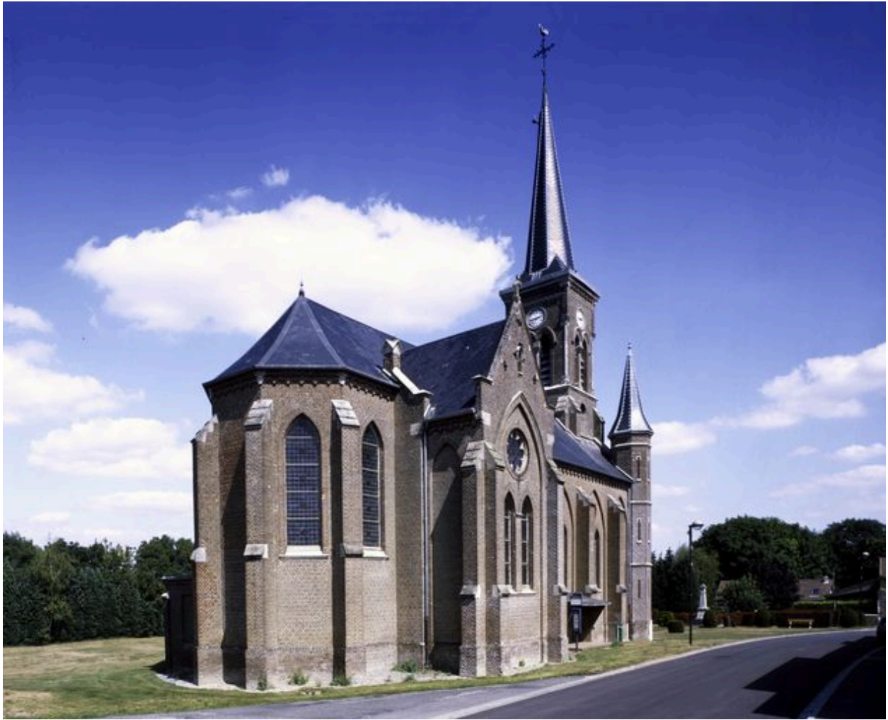
Vue générale depuis le sud-ouest.