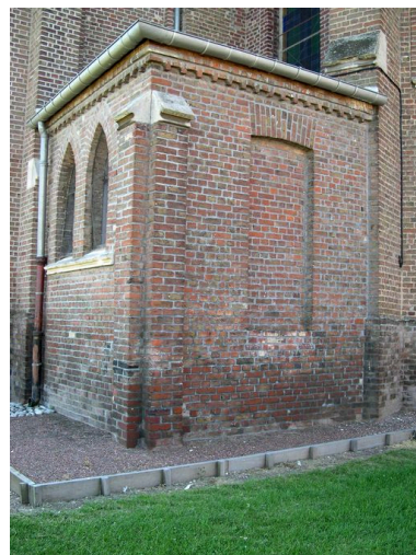
La sacristie.