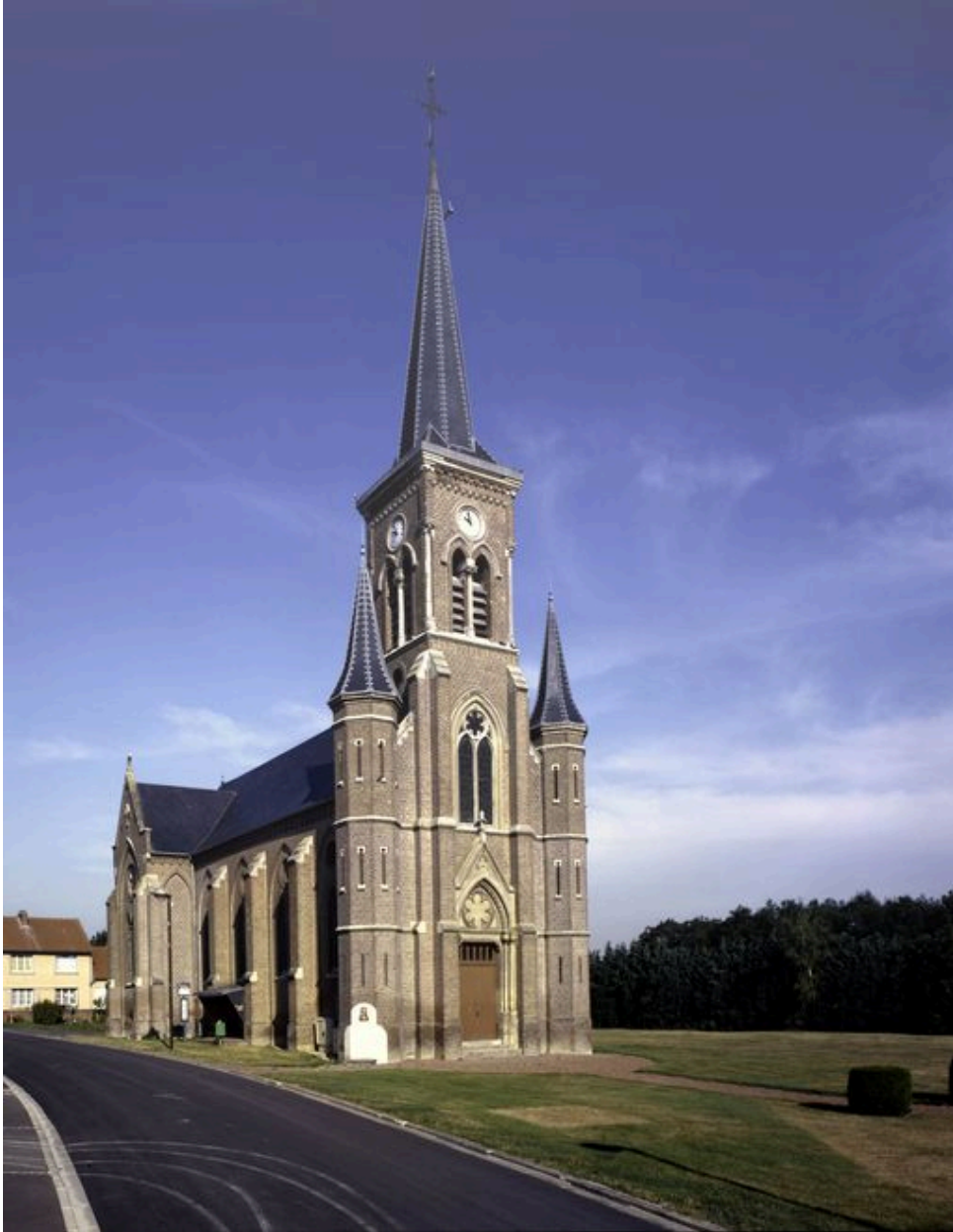
Vue générale, depuis le sud-est.