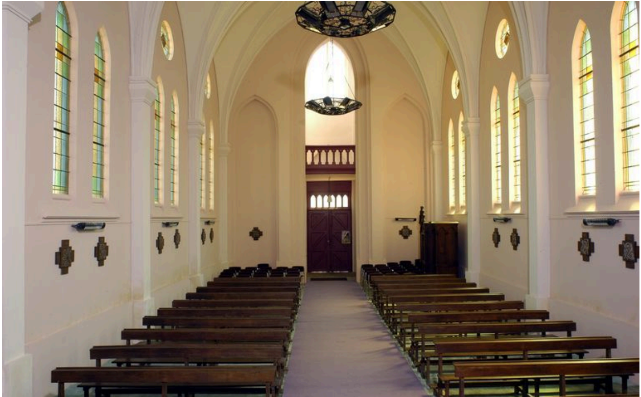
Vue intérieure vers l'entrée.