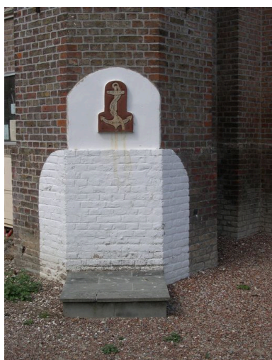
Monument aux morts. IVR22_20038010693NUCA