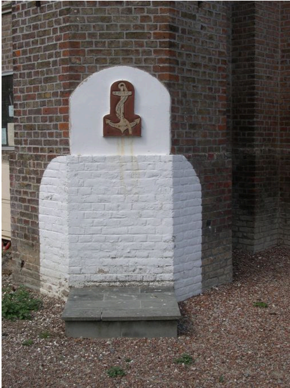
Monument aux morts.