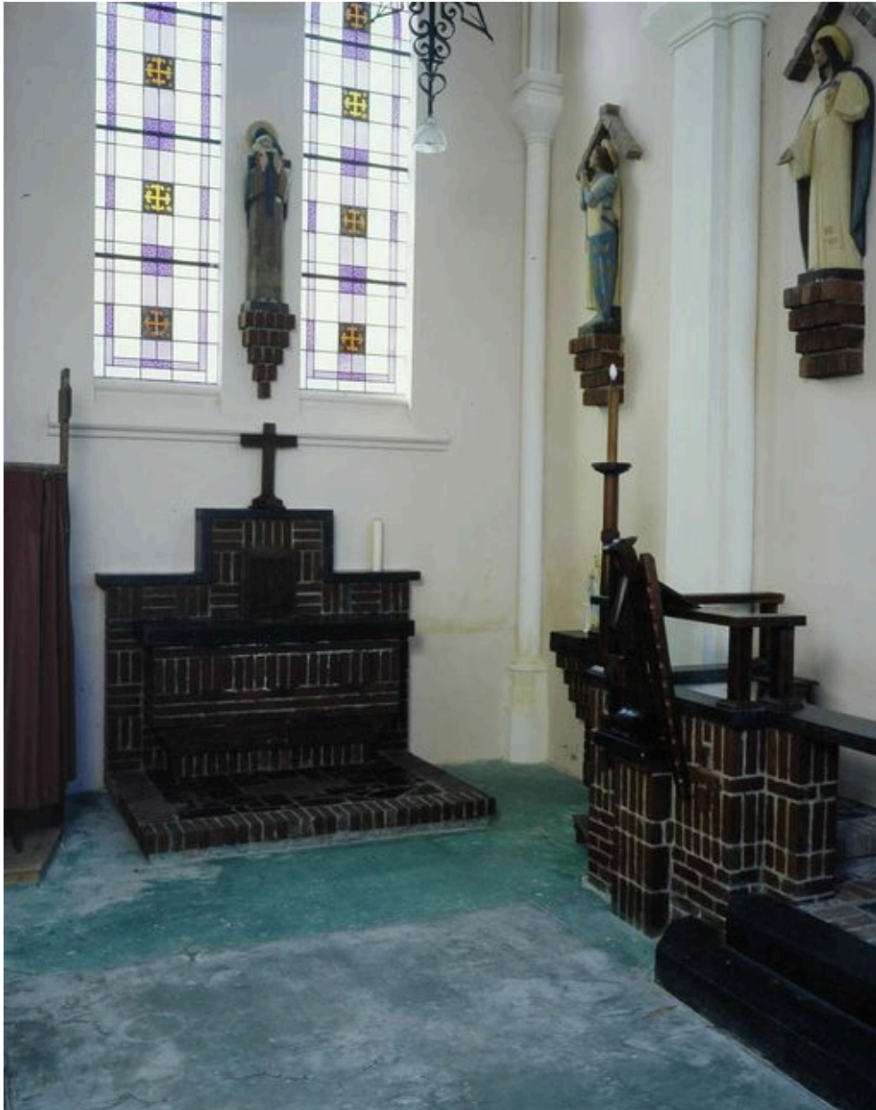
Vue de la chapelle Sainte-Thérèse (bras sud du transept).