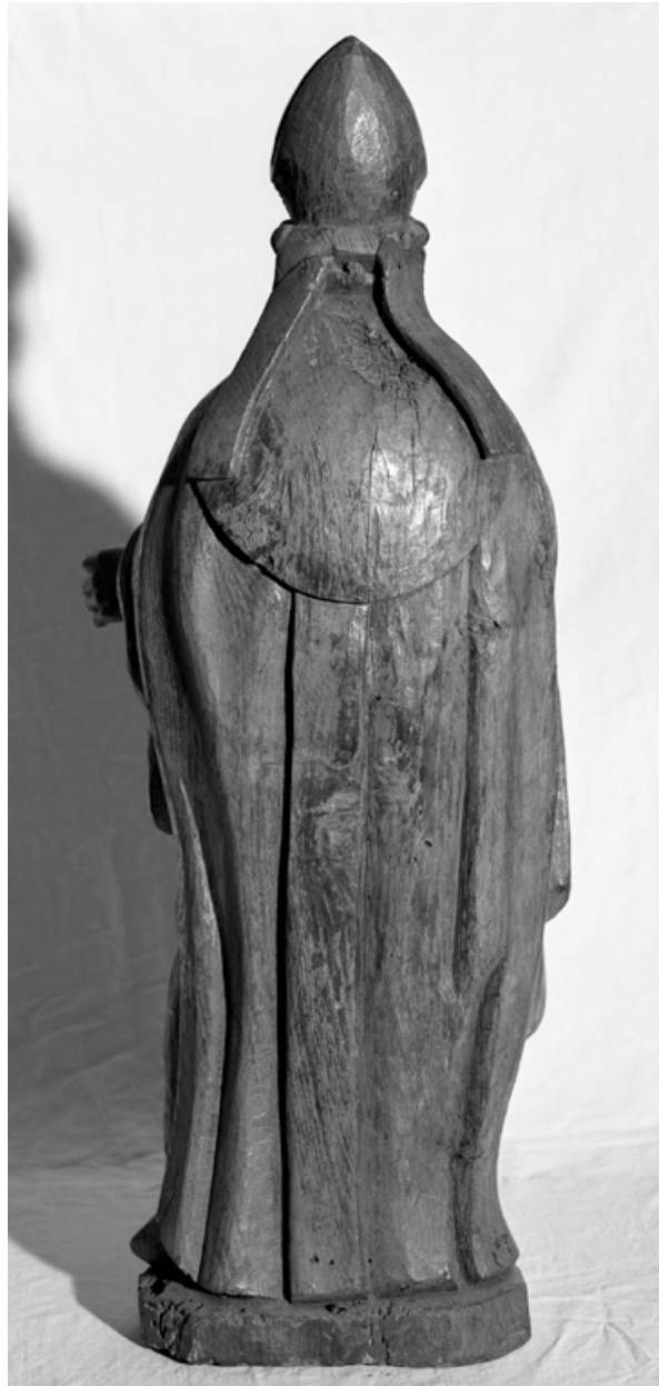
Statue de saint Martin, chêne, XVIIIe siècle : vue de dos.