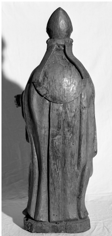
Statue de saint Martin, chêne, XVIIIe siècle : vue de dos. IVR22_19910200815X