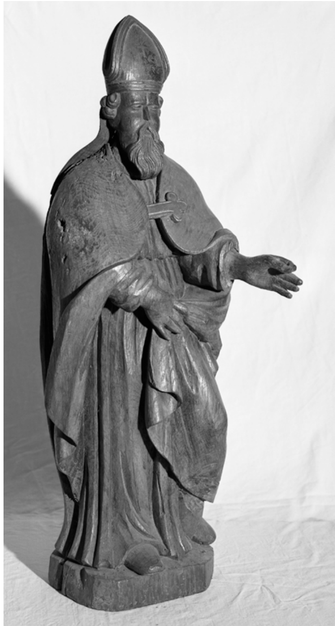
Statue de saint Martin, chêne, XVIIIe siècle.