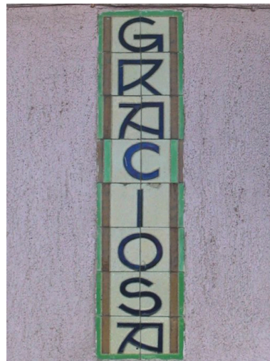
Détail des carreaux de céramique portant appellation. IVR22_20058002764NUCA