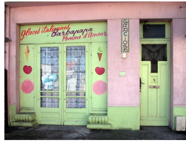
Détail de l'élévation du rez-de-chaussée.