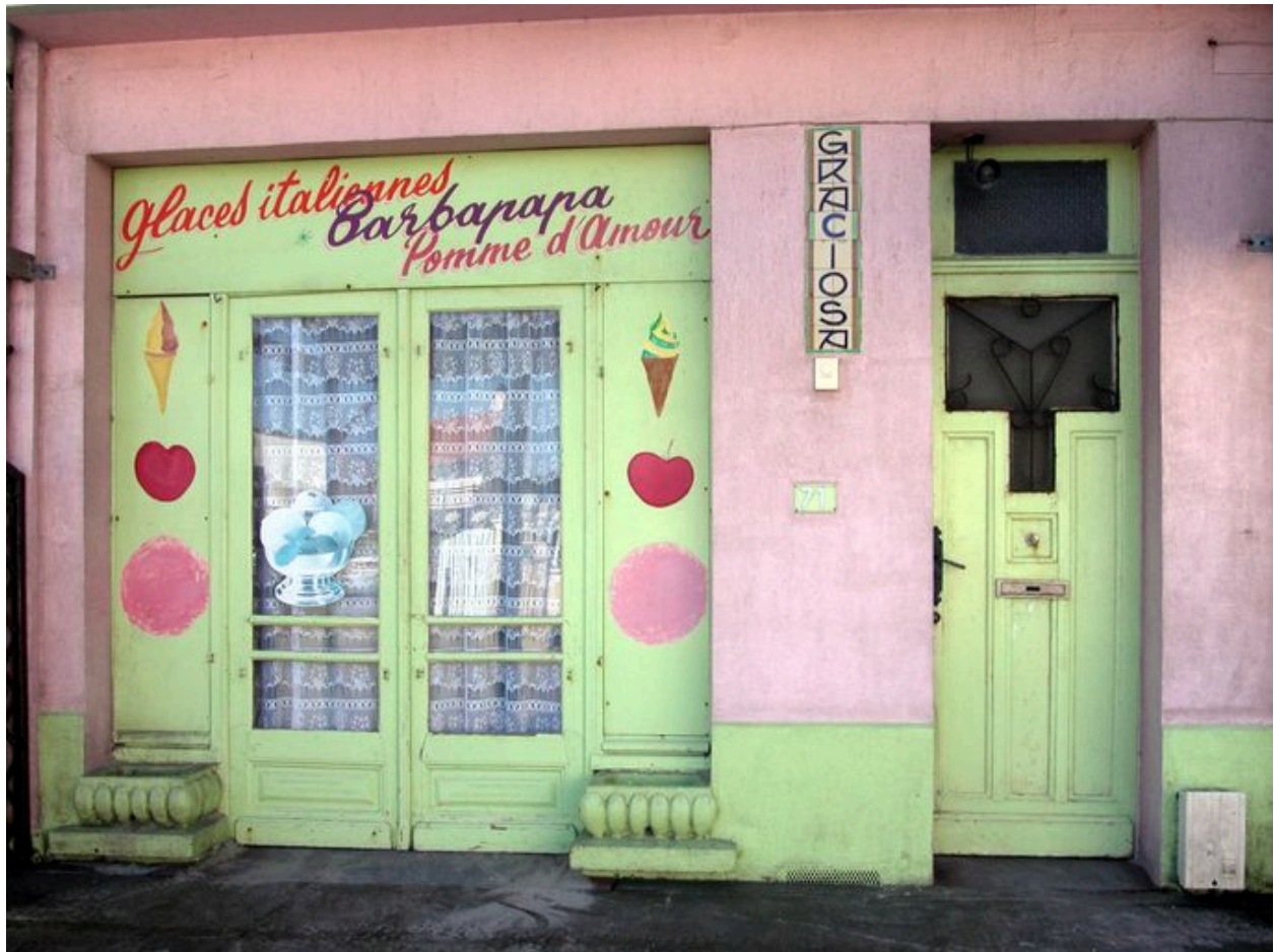
Détail de l'élévation du rez-de-chaussée.