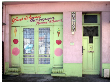
Détail de l'élévation du rez-de-chaussée.