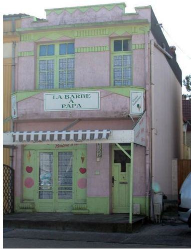
Vue d'ensemble. IVR22_20058002762NUCA