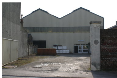
Cour et façade antérieure des entrepôts.

IVR22_20050205675NUCA