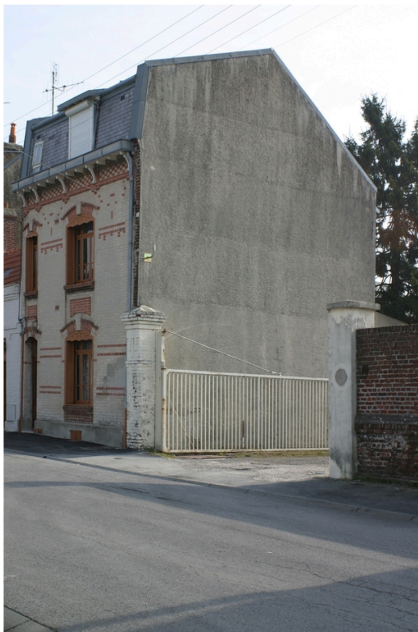
Entrée du site : la conciergerie.