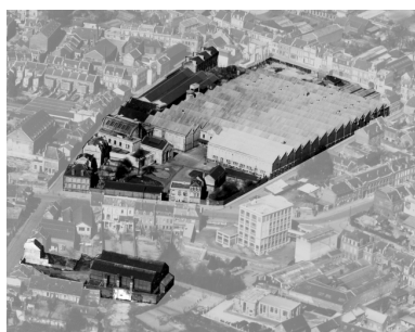
Vue aérienne du site dans les années 1930 : au premier plan, les entrepôts (BM Saint-Quentin).

Phot. Pillet Frédéric IVR22_20050205666NUCAB