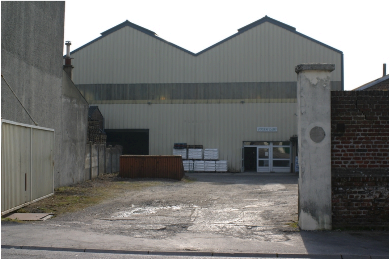
Cour et façade antérieure des entrepôts.