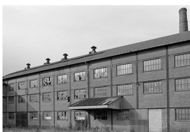
Atelier de fabrication, flanc sud. IVR22_19908001223Z