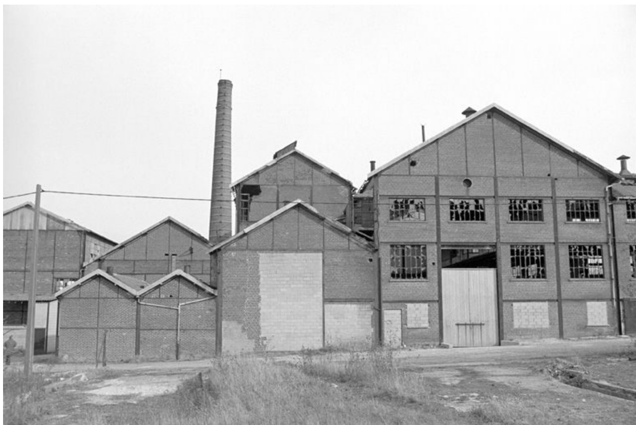
Atelier de fabrication, flanc ouest.