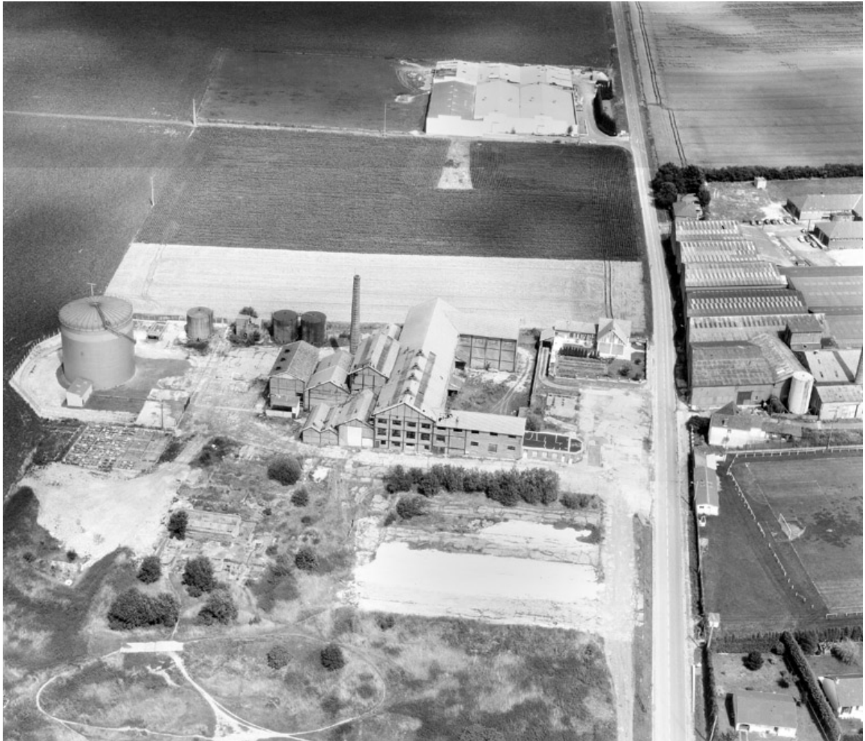
Vue aérienne, flanc ouest.