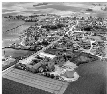
Vue aérienne, flanc est. IVR22_19888001290P