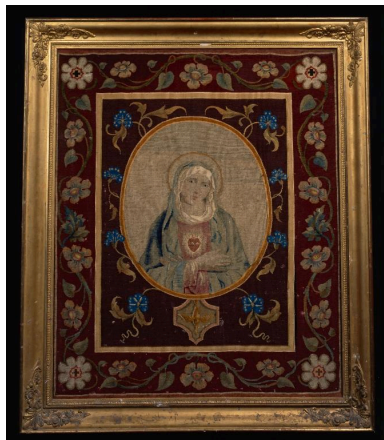
Vue générale. IVR22_19956000429XA