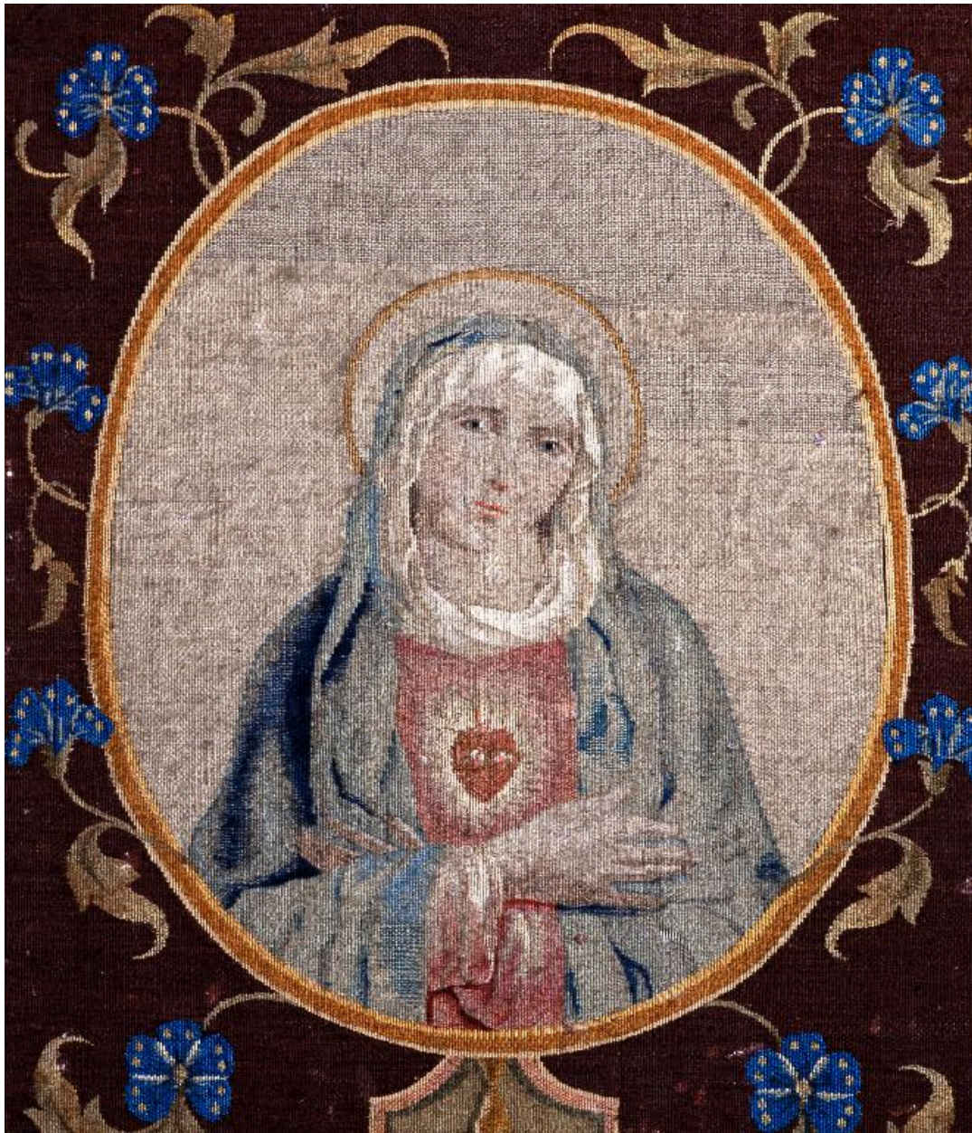
Détail du médaillon central.