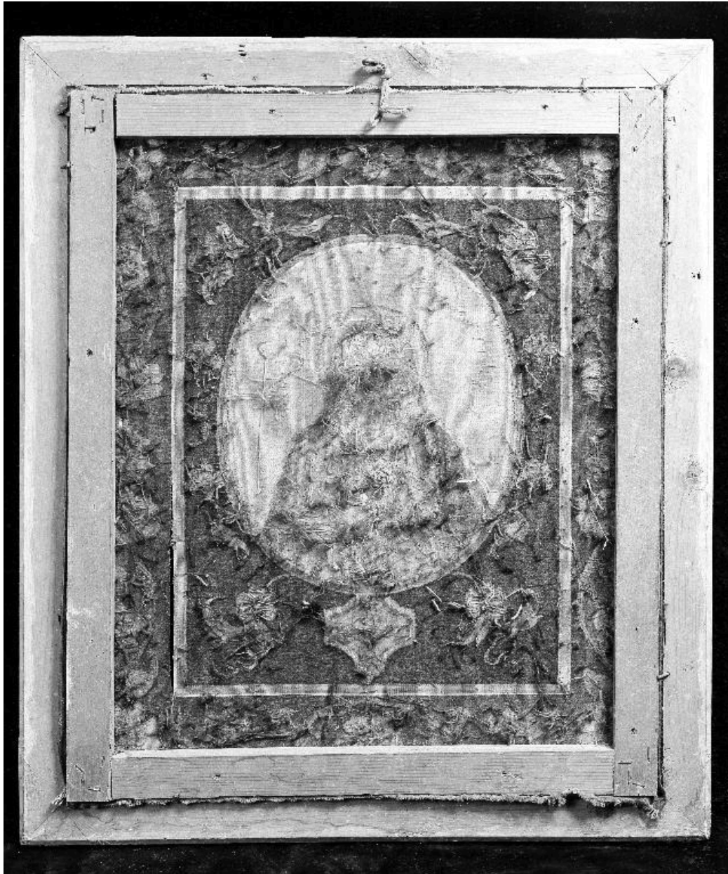
Vue du revers.