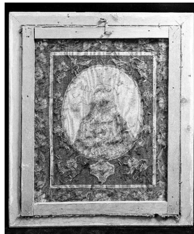
Vue du revers.