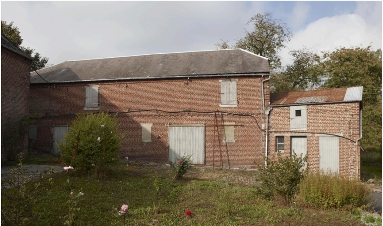
Vue de générale de l'écurie-grenier à grain et de la laiterie.