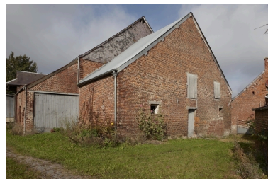
Vue des pignons de l'étable et de la grange. IVR31_20095903251NUCA