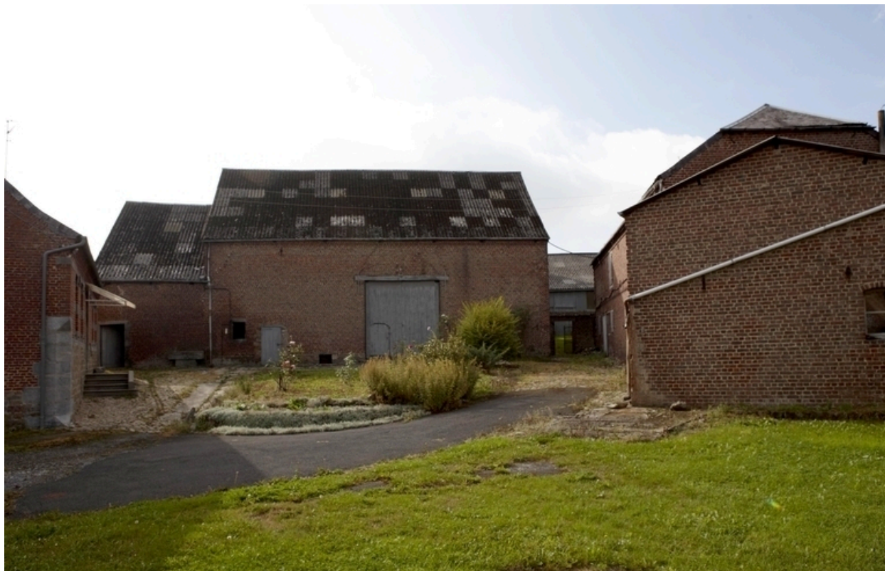
Vue générale, avec l'étable et la grange.