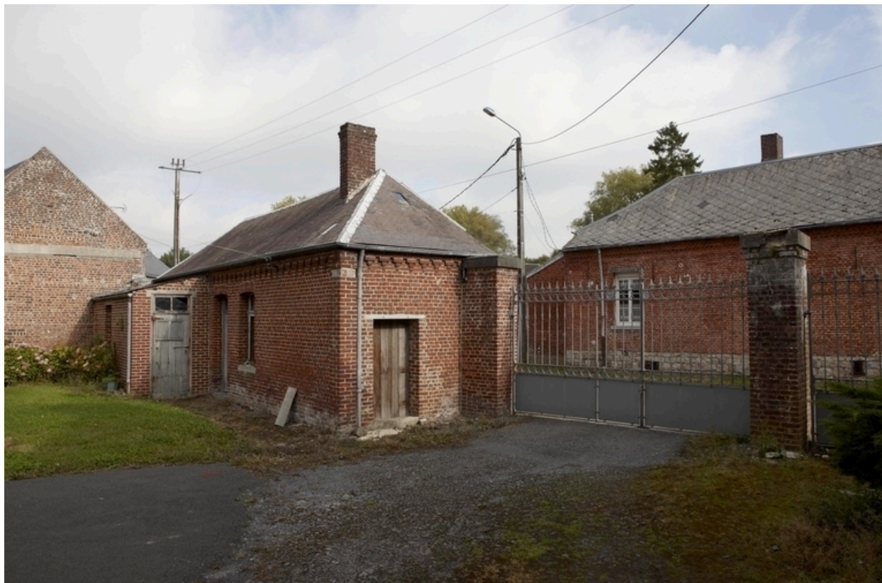
Vue de la maisonnette située à l'entrée.