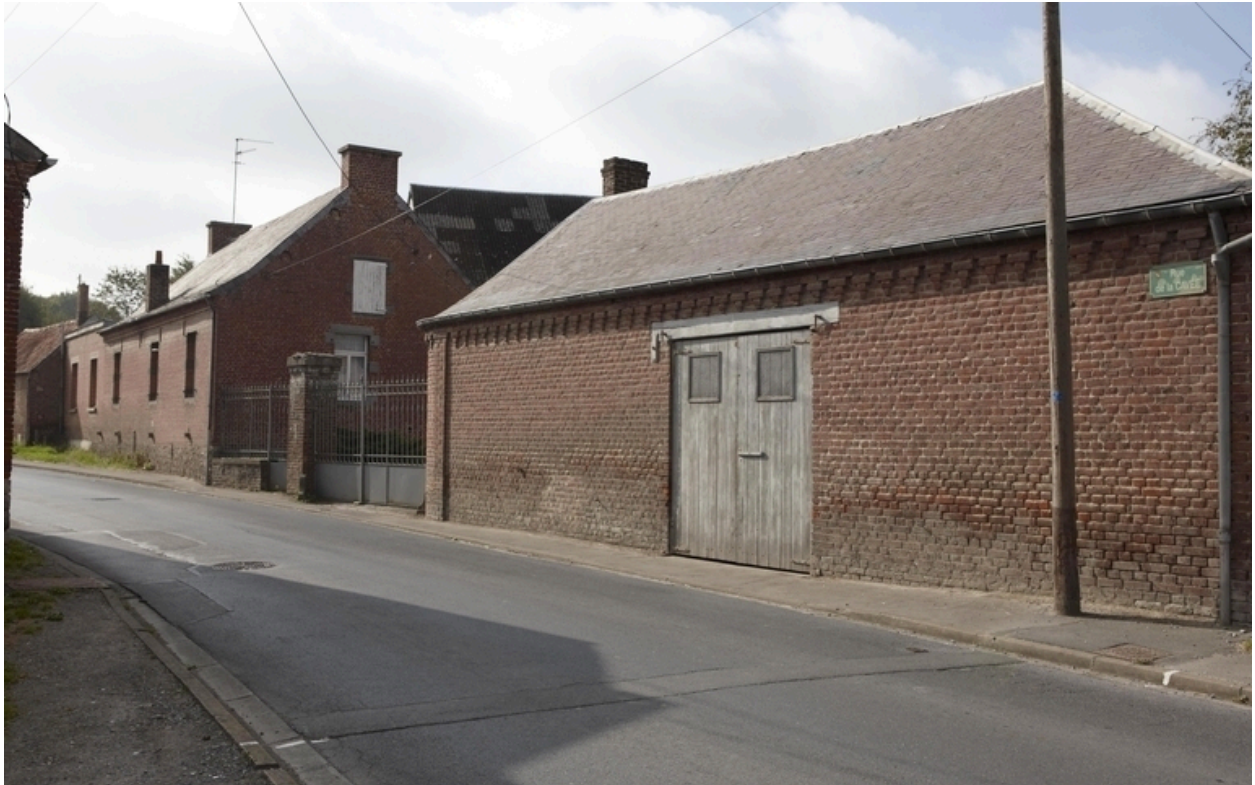
Vue générale de la ferme depuis la voie : le garage et le logis.