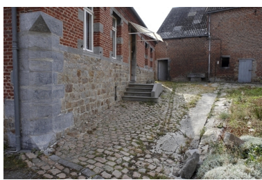
Détail du soubassement du logis.