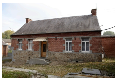
Vue générale du logis, depuis la cour.