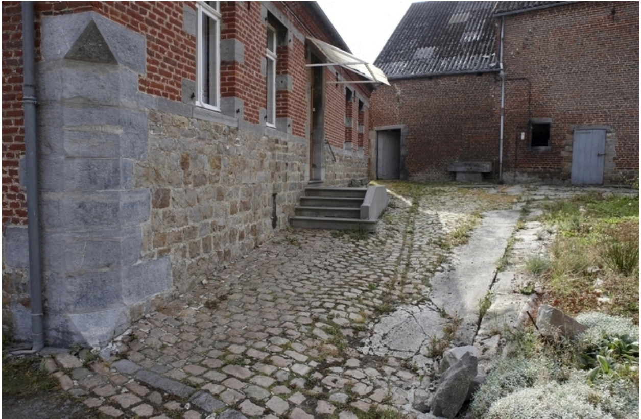
Détail du soubassement du logis.