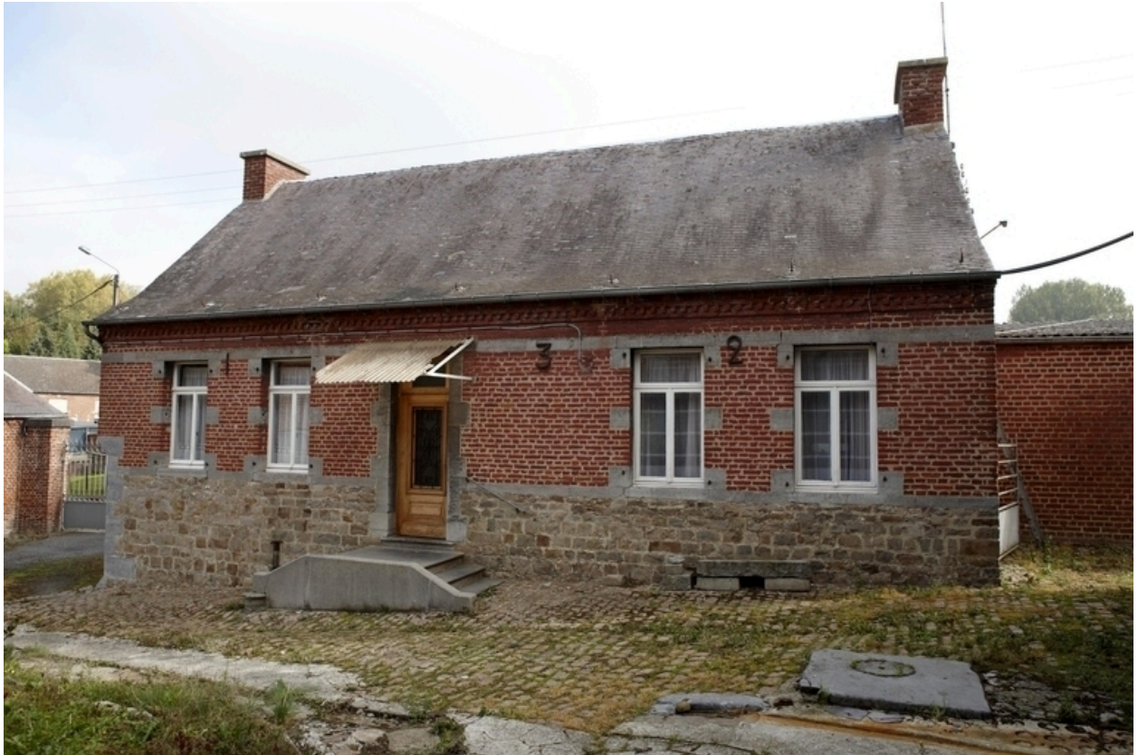
Vue générale du logis, depuis la cour.