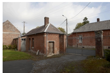
Vue de la maisonnette située à l'entrée. IVR31_20095903252NUCA