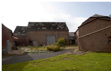
Vue générale, avec l'étable et la grange.