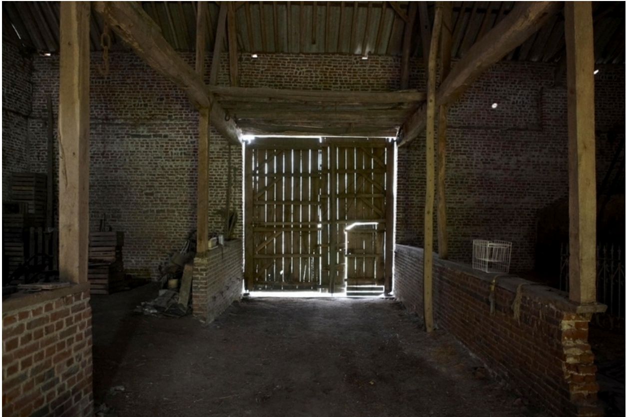
Vue intérieure de la grange.