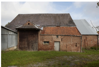
Vue du revers de la grange. IVR31_20095903208NUCA