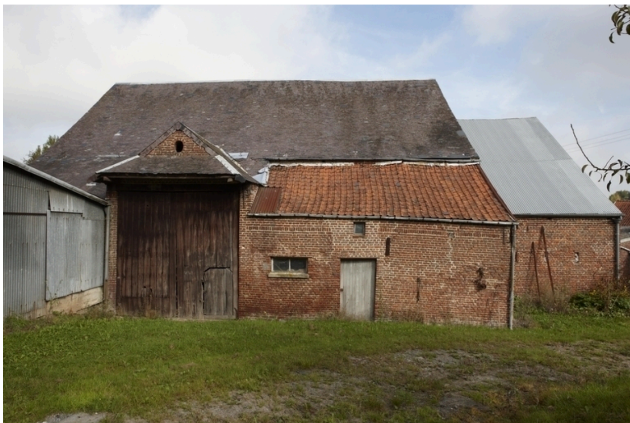
Vue du revers de la grange.