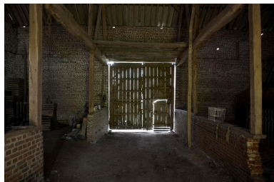
Vue intérieure de la grange.