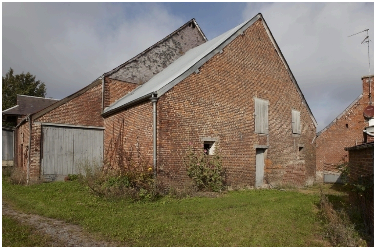
Vue des pignons de l'étable et de la grange.