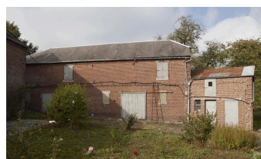
Vue générale de l'écurie- grenier à grain et de la laiterie.