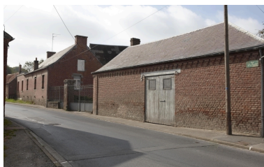
Vue générale de la ferme depuis la voie : le garage et le logis. IVR31_20095903257NUCA

IVR31_20095902597NUCA