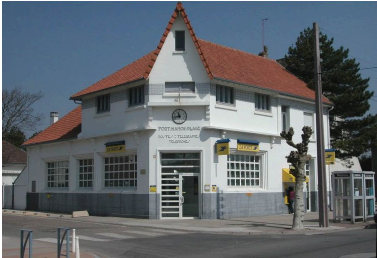
Vue d'ensemble depuis l'avenue.