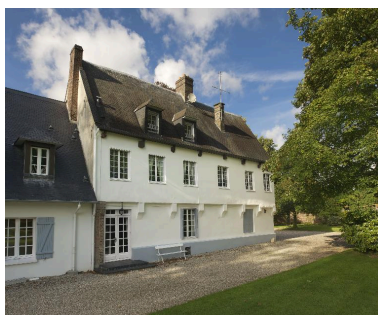
Façade antérieure de logis du 16e siècle.