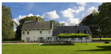
Façade postérieure. IVR22_20158000843NUC2AQ