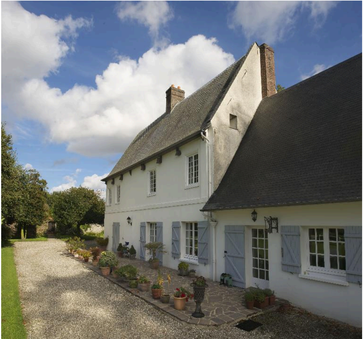
Façade postérieure du logis du 16e siècle.