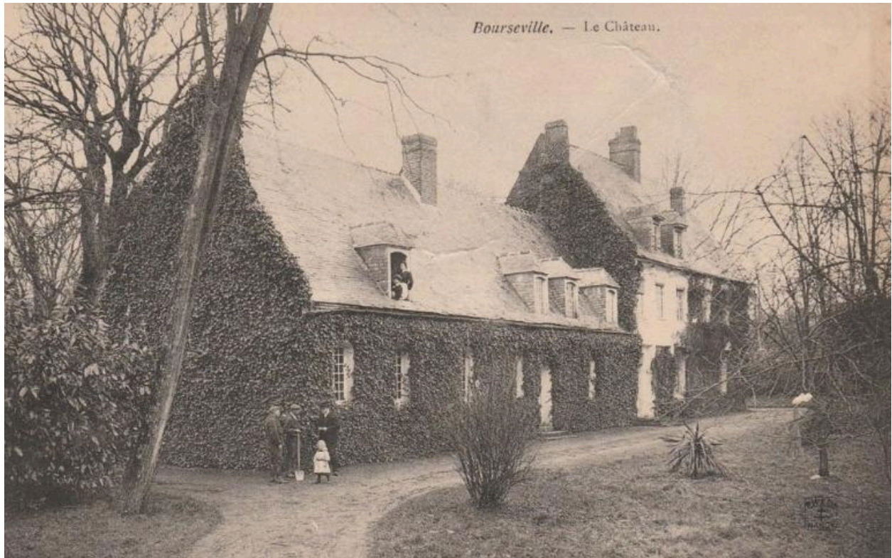
Vue générale, vers 1910.