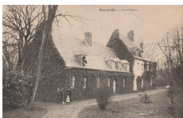
Vue générale, vers 1910 (coll. part.).

Phot. Archives départementales de la Somme IVR22_20158006626NUCA