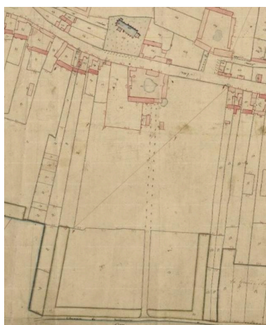
Extrait du cadastre napoléonien, section F, dite du Bourg, 1825 (AD Somme ; 3P 2192/5).

Phot. Archives départementales de la Somme IVR22_20158006626NUCA