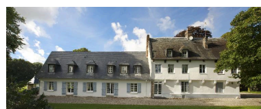
Façade antérieure. IVR22_20158000842NUC2AQ

IVR22_20158005103NUCA