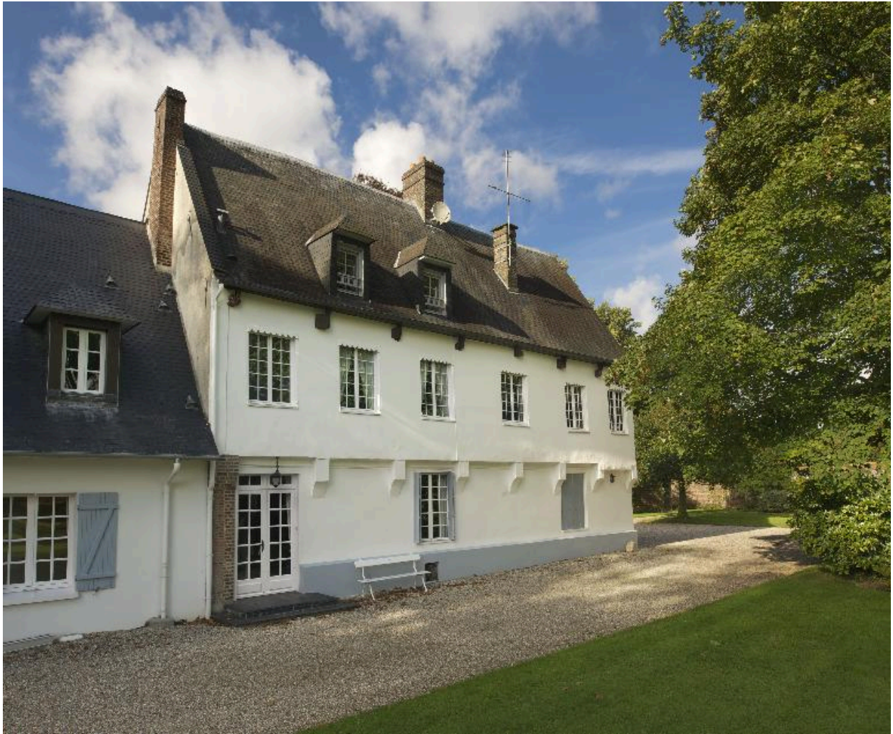
Façade antérieure du logis du 16e siècle.