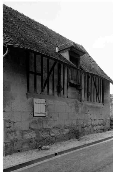
Remise. IVR22_19856000776X