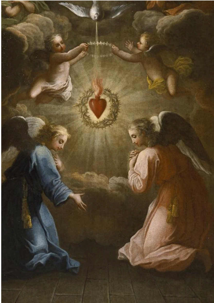
Détail de la partie inférieure : deux anges agenouillés adorent le Sacré-Cœur de Jésus.