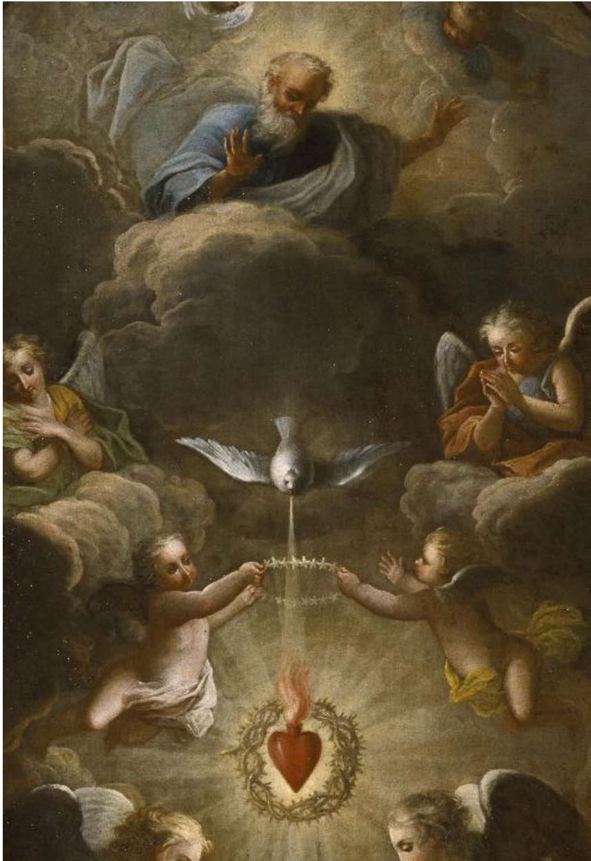
Détail de la partie supérieure : Dieu le Père, la colombe du Saint-Esprit et le Sacré-Cœur de Jésus.