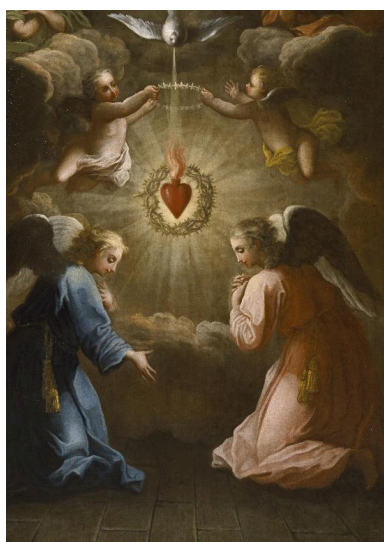
Détail de la partie inférieure : deux anges agenouillés adorent le Sacré-Cœur de Jésus. IVR22_20010202192ZA