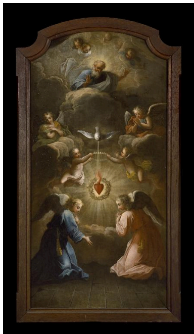
Vue générale du tableau.