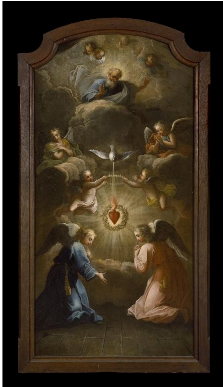
Vue générale du tableau.