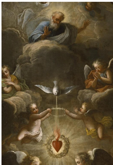
Détail de la partie supérieure : Dieu le Père, la colombe du Saint-Esprit et le Sacré-Cœur de Jésus.