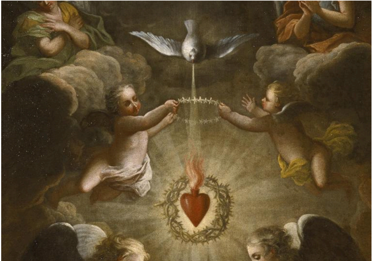
Détail de la partie centrale : le Saint-Esprit planant au-dessus du Sacré-Cœur de Jésus.