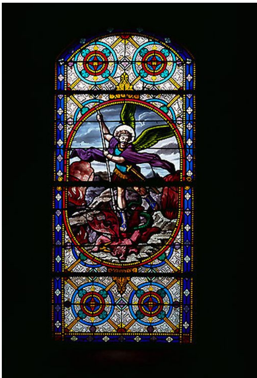
Baie 6 : saint Michel terrassant le dragon.