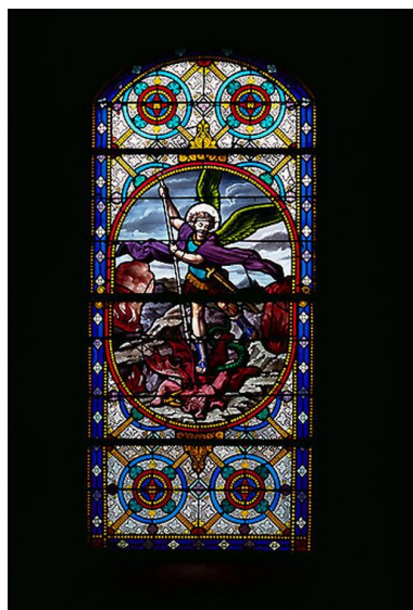
Baie 6 : saint Michel terrassant le dragon.