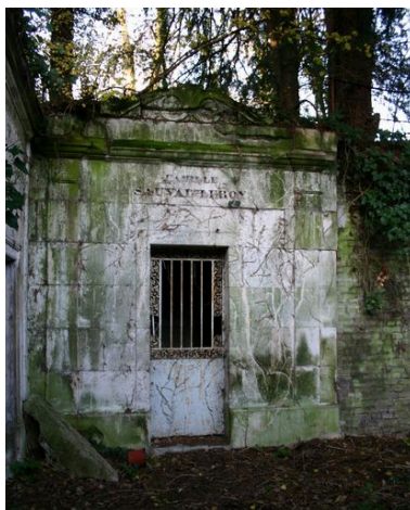
Vue rapprochée. IVR22_20088000930NUCA