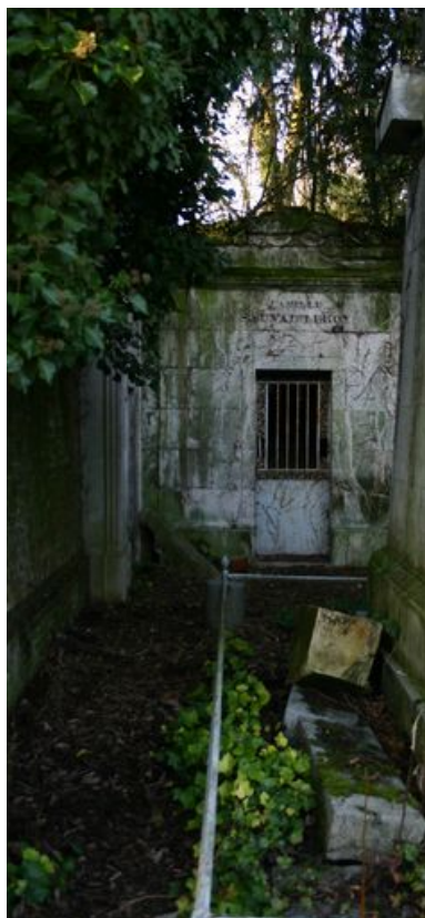
Vue générale. IVR22_20088000929NUCA