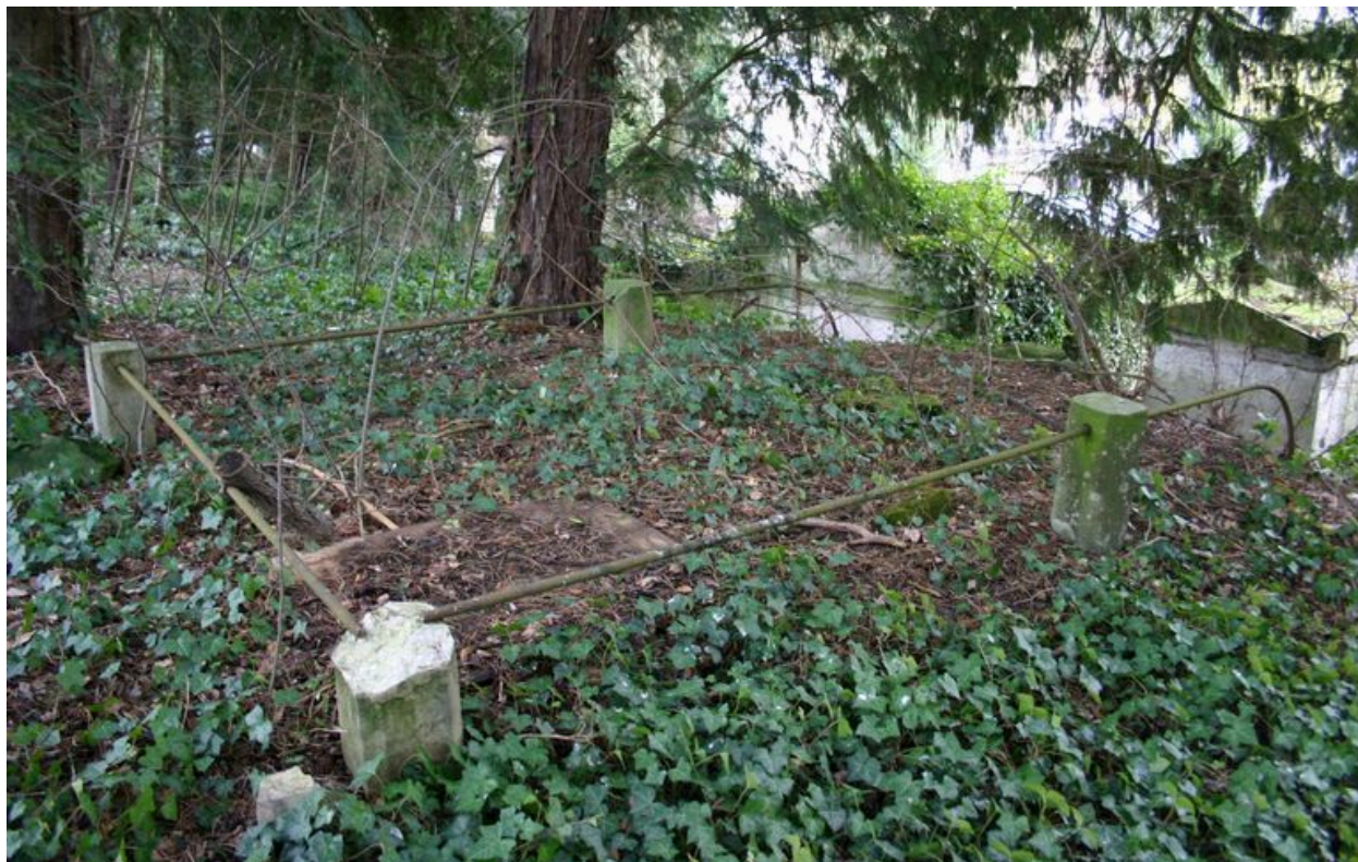
Vue de la terrasse.