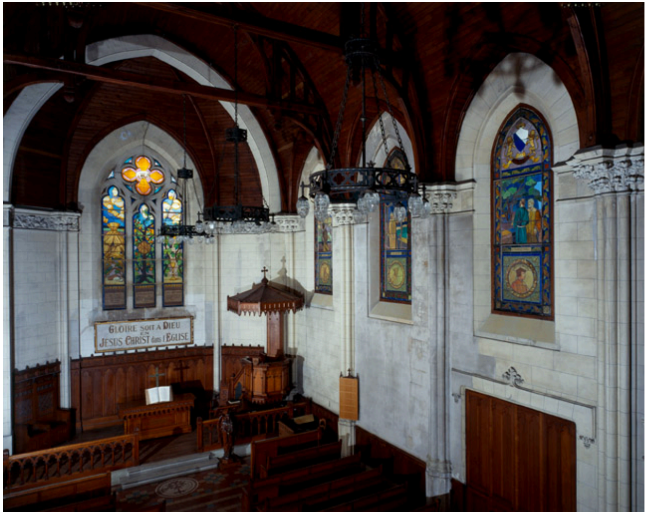
Vue intérieure prise de la tribune.