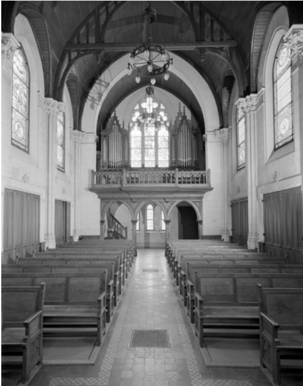
Vue intérieure, du chœur vers l'entrée.