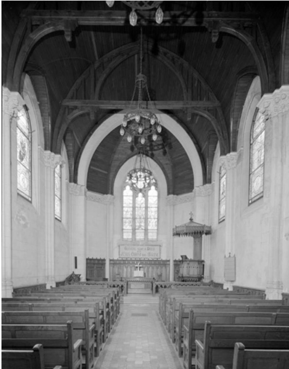
Vue intérieure, de l'entrée vers le chœur.