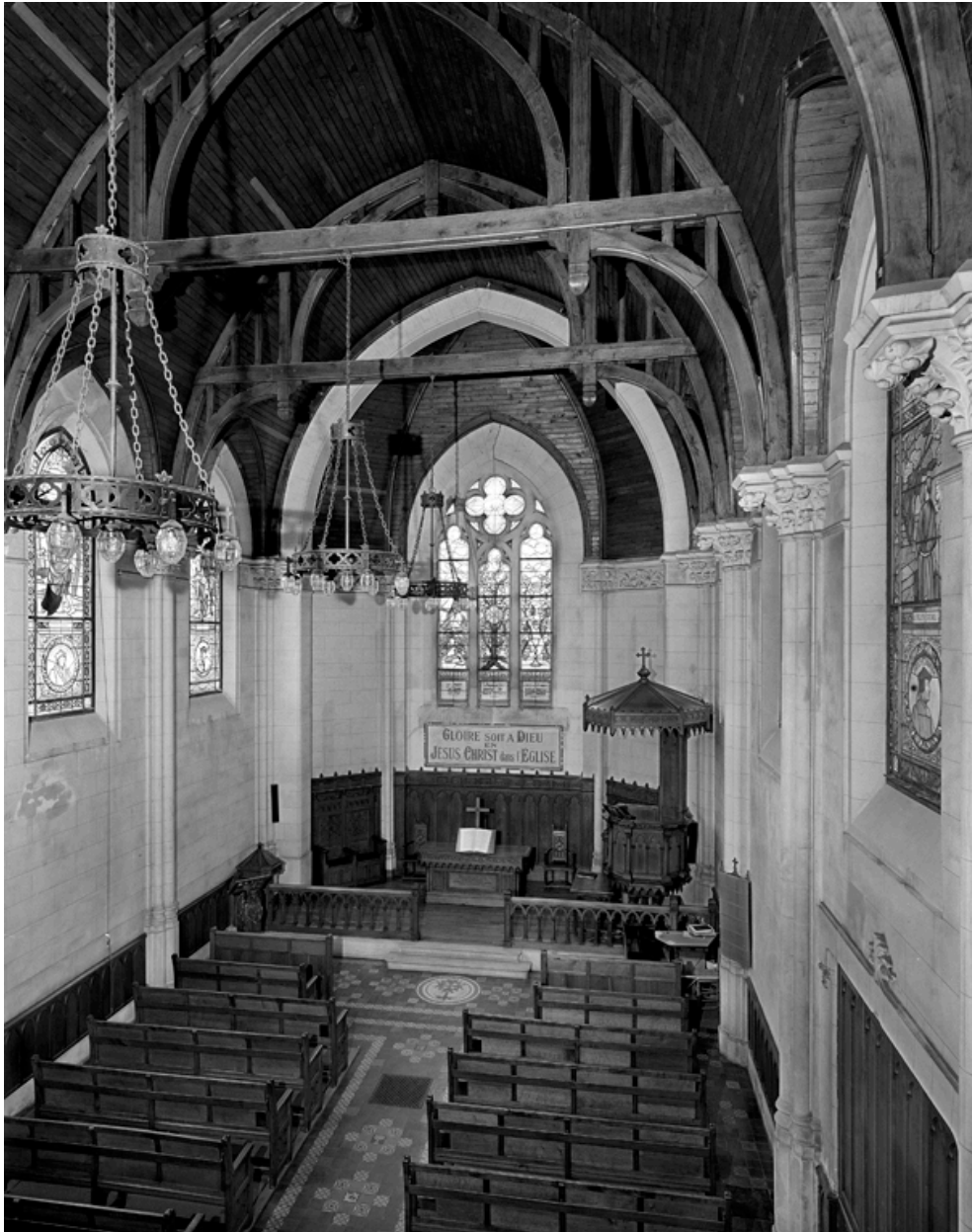
Vue intérieure depuis la tribune d'orgue, détail du chœur.