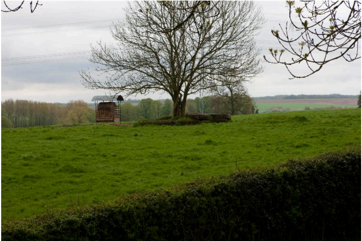
Bunker de tir hexagonal.