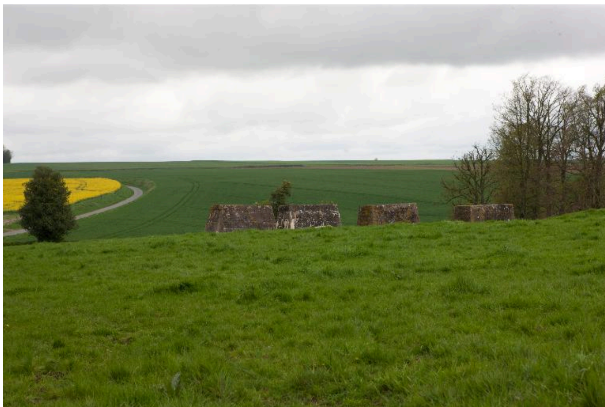
Plots de la rampe de lancement.