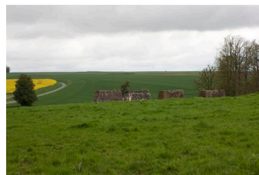
Plots de la rampe de lancement.