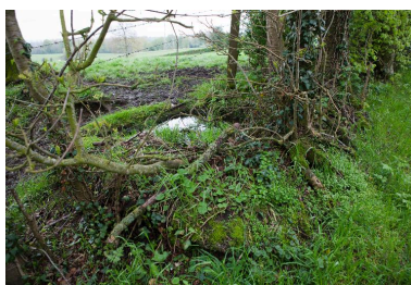
Réserve d'eau.