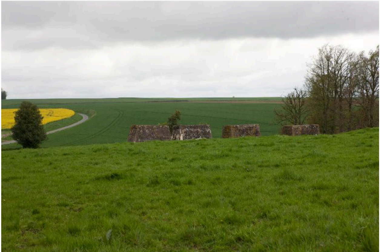
Plots de la rampe de lancement.