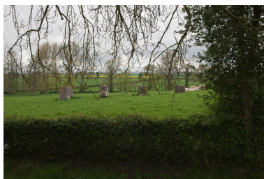
Plots de la rampe de lancement.