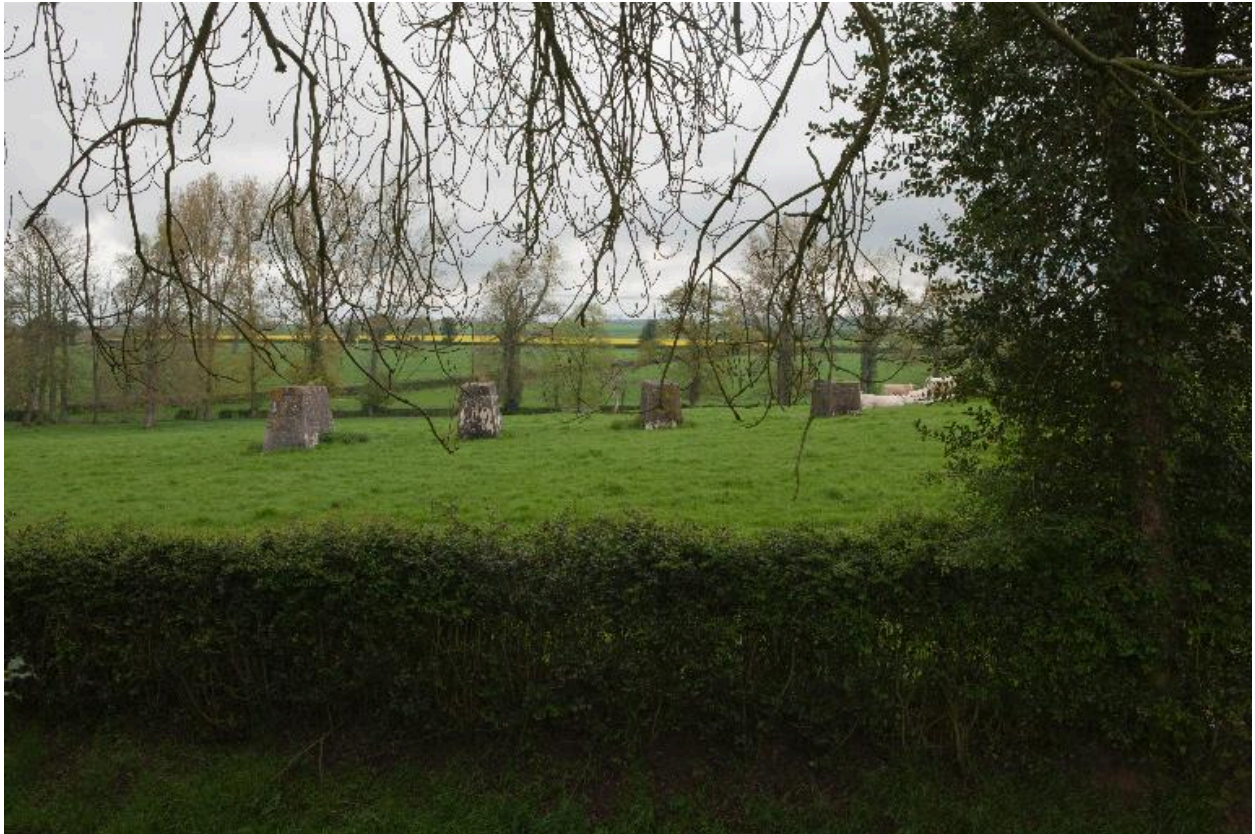
Plots de la rampe de lancement.