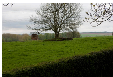
Bunker de tir hexagonal.