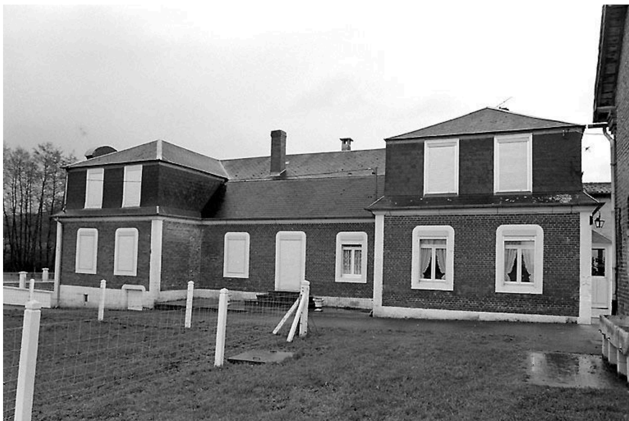
Elévation nord du logis.