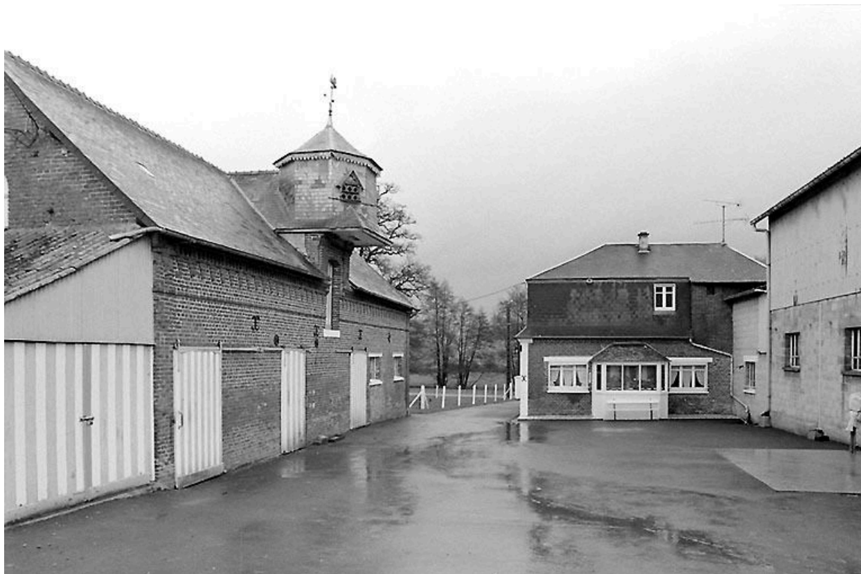
Vue de la ferme depuis le nord-ouest.