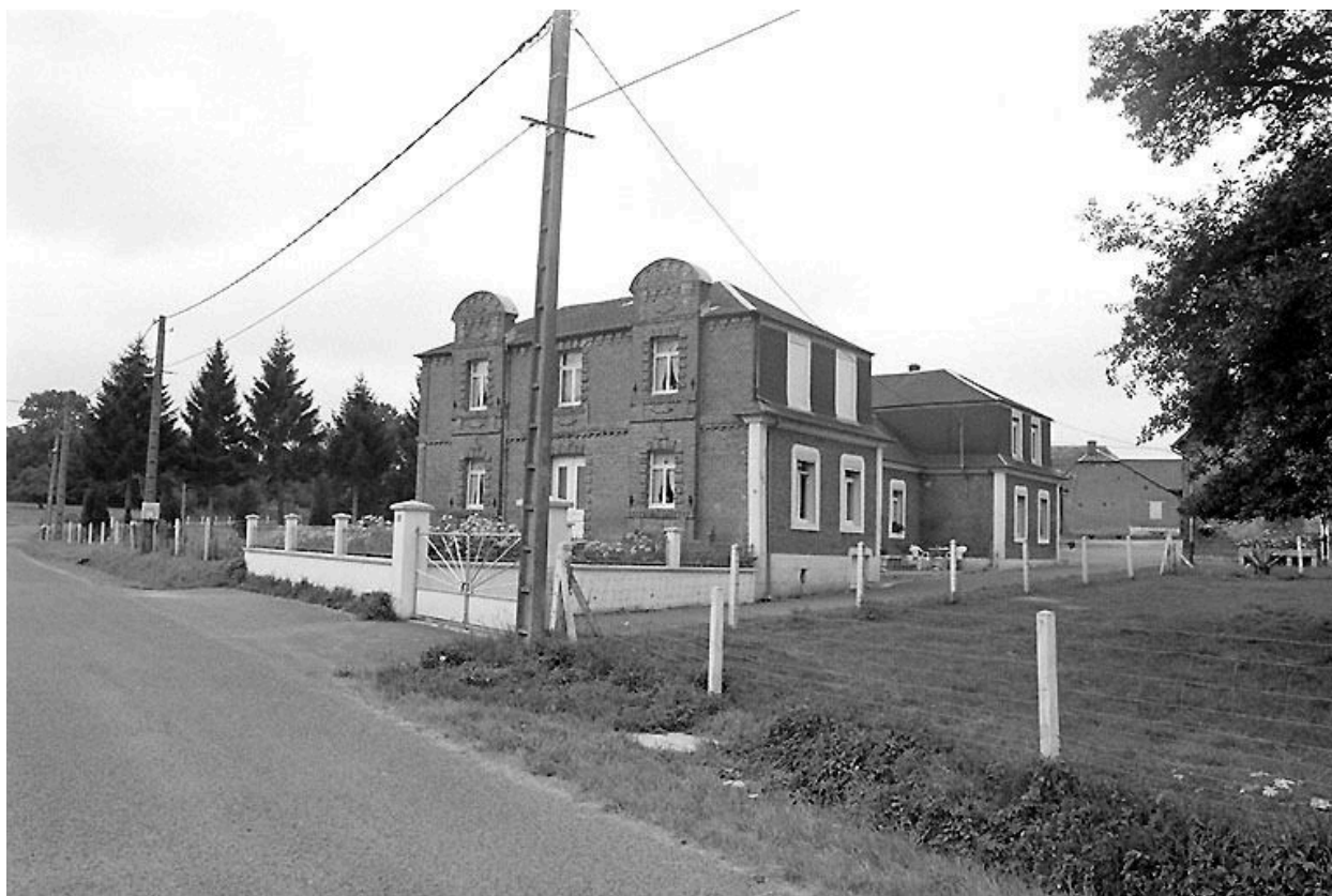
Vue d'ensemble du logis depuis le nord-est.