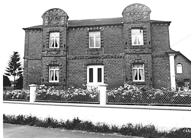
Elévation orientale du logis. IVR22_19980203075Z