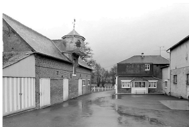
Vue de la ferme depuis le nord-ouest. IVR22_19970202395Z