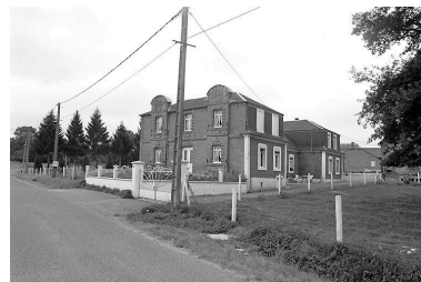
Vue d'ensemble du logis depuis le nord-est. IVR22_19980203074Z