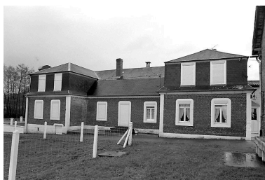
Elévation nord du logis. IVR22_19970202393Z