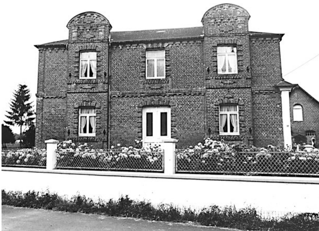
Elévation orientale du logis.