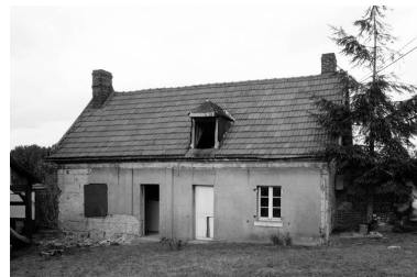
Logis. Elévation antérieure. IVR22_19856000981X