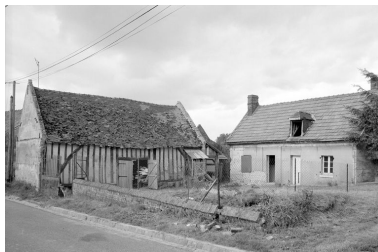
Vue générale. IVR22_19856000982X