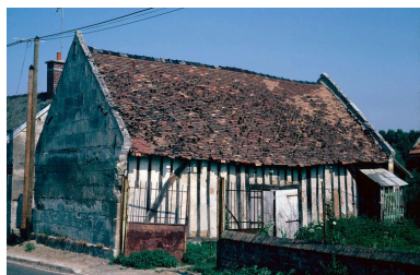
Grange.