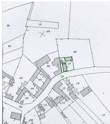
Plan de situation. Extrait du plan cadastral de 1982, section AB 107.