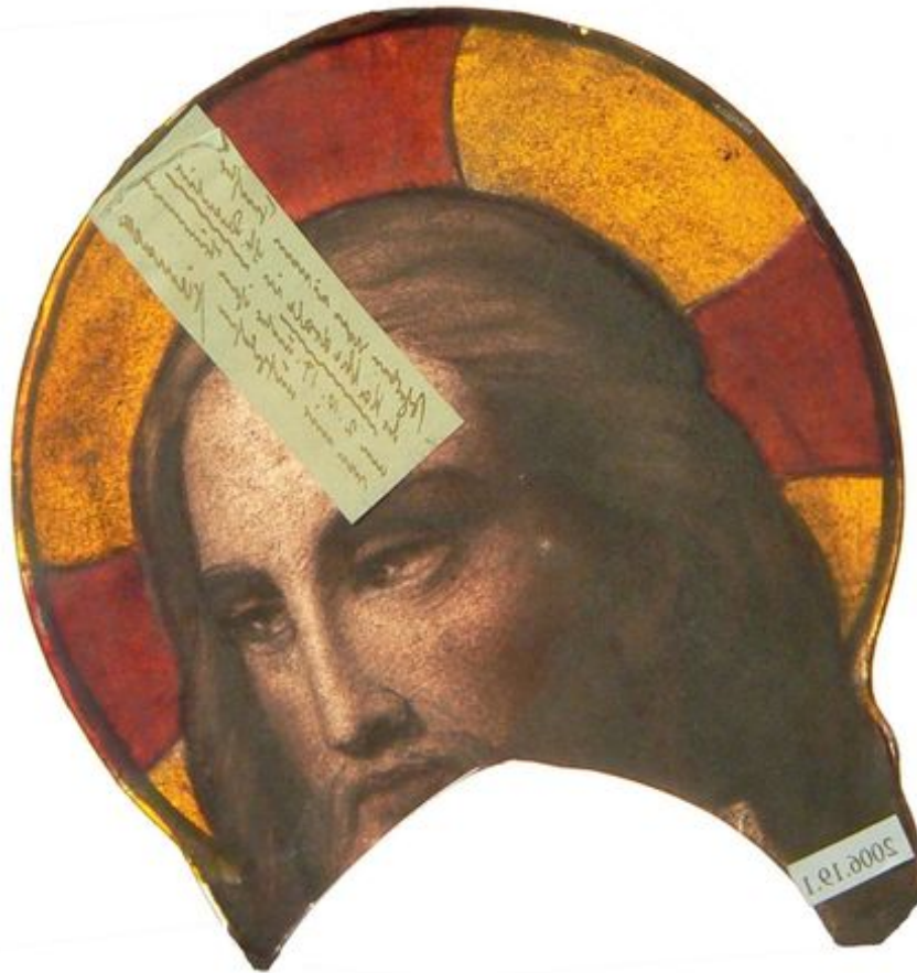
Visage du Christ, provenant de la scène de l'Apparition à Marie-Madeleine.