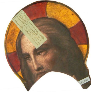
Visage du Christ, provenant de la scène de l'Apparition à Marie-Madeleine.