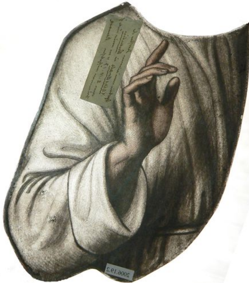
Elément du Christ, provenant de la scène de l'Apparition à Marie-Madeleine.