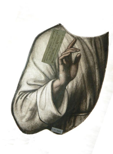
Élément du Christ, provenant de la scène de l'Apparition à Marie-Madeleine. IVR22_20110201097NUCA