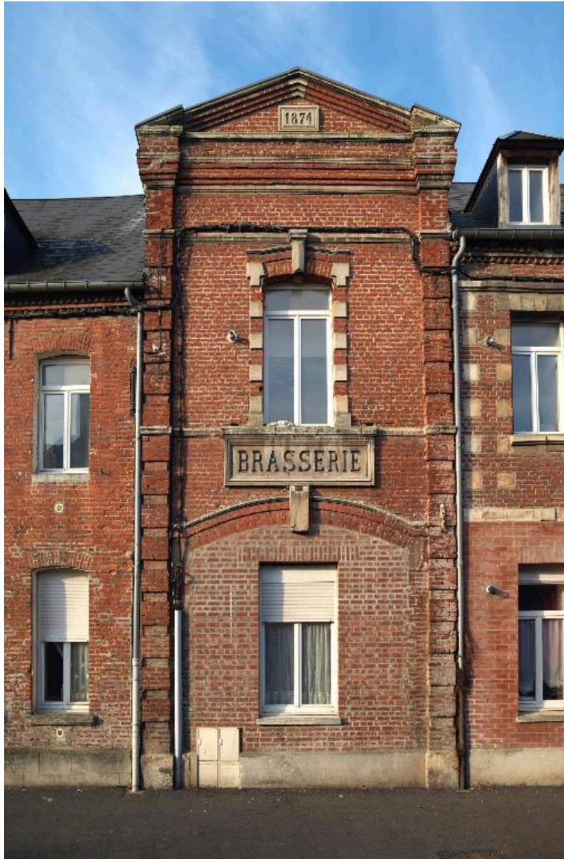
La travée centrale de l'ancienne brasserie.

IVR22_20158001057NUC2A Auteur de l'illustration : Marie-Laure Monnehay-Vulliet (c) Région Hauts-de-France - Inventaire général reproduction soumise à autorisation du titulaire des droits d'exploitation