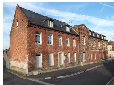
Vue générale, depuis le sud. IVR22_20158001055NUC2A