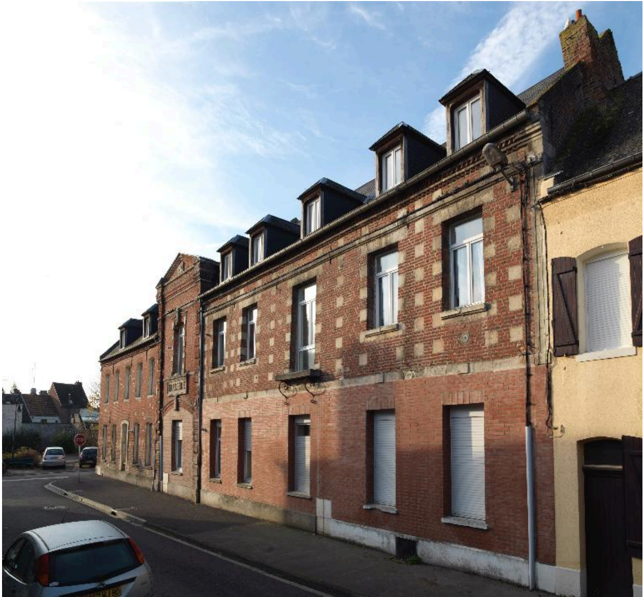
Vue générale depuis le nord.