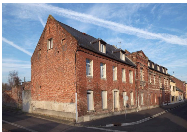
Vue générale, depuis le sud. IVR22_20158001054NUC2A

IVR22_20148005205NUCA