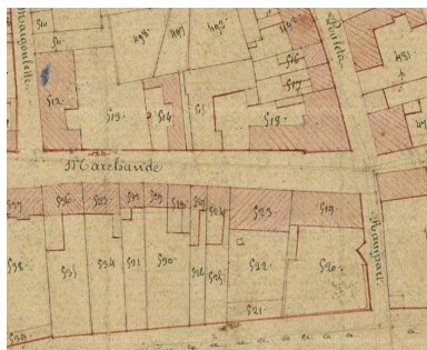
Extrait du cadastre napoléonien, vers 1826 (AD Somme ; 3 P 2011/3).

IVR22_20148005205NUCA