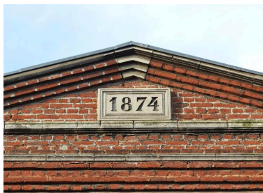
Date gravée sur le fronton.