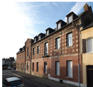
Vue générale depuis le nord. IVR22_20158001056NUC2A