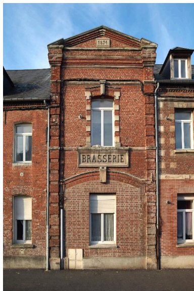
La travée centrale de l'ancienne brasserie.

IVR22_20158001057NUC2A