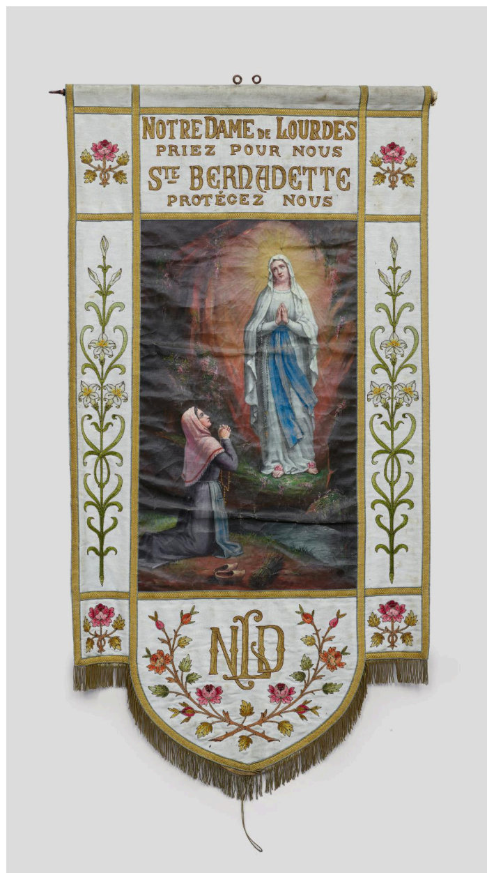
Bannière de procession (n°3), recto.