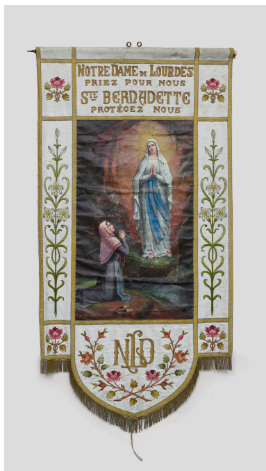
Bannière de procession (n°3), recto. IVR32_20236200529NUCA