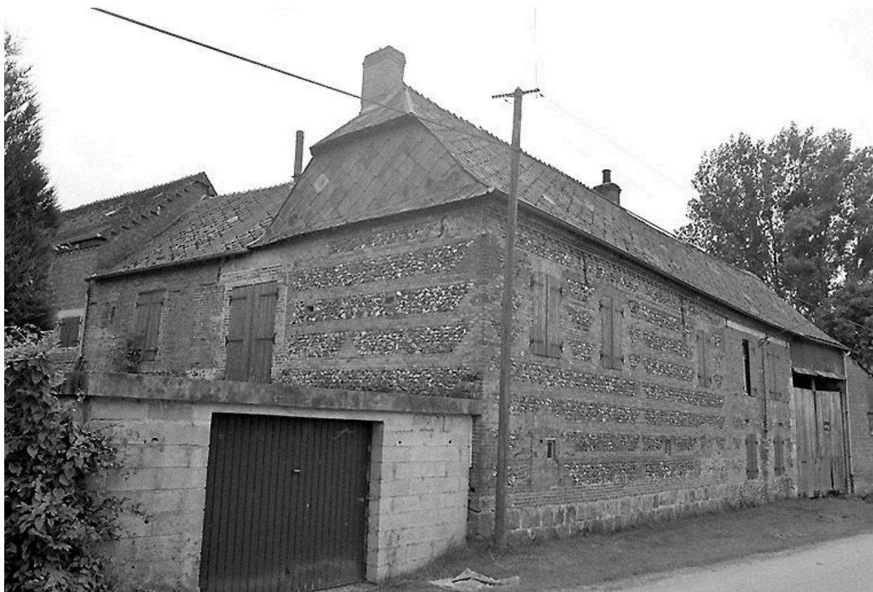
Vue générale depuis le nord-est.