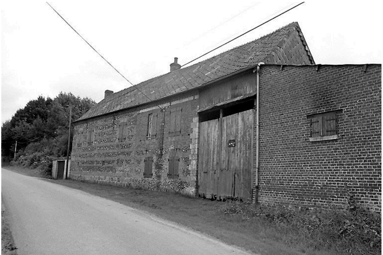
Vue depuis la rue : porche donnant accès à la cour intérieure.