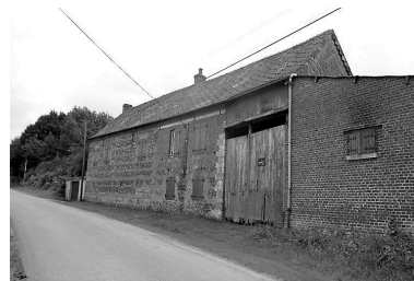
Vue depuis la rue : porche donnant accès à la cour intérieure. IVR22_19980202340Z