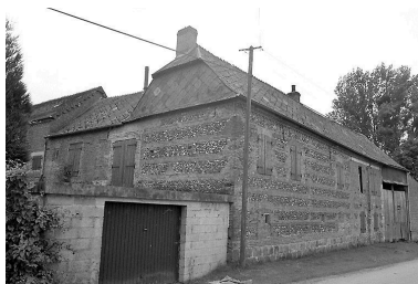
Vue générale depuis le nord-est.