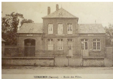
Ancienne école des filles d'Yzengremer, début 20e siècle (coll. part.). IVR22_20158005380NUCA