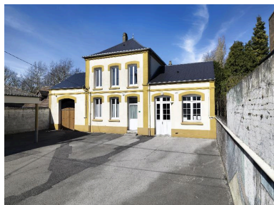
Façade antérieure. IVR22_20158000099NUC2A