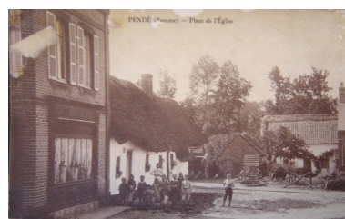
Vue de la place de l'église, avec ancienne chaumière attenante au café. IVR22_20078005011NUCAB