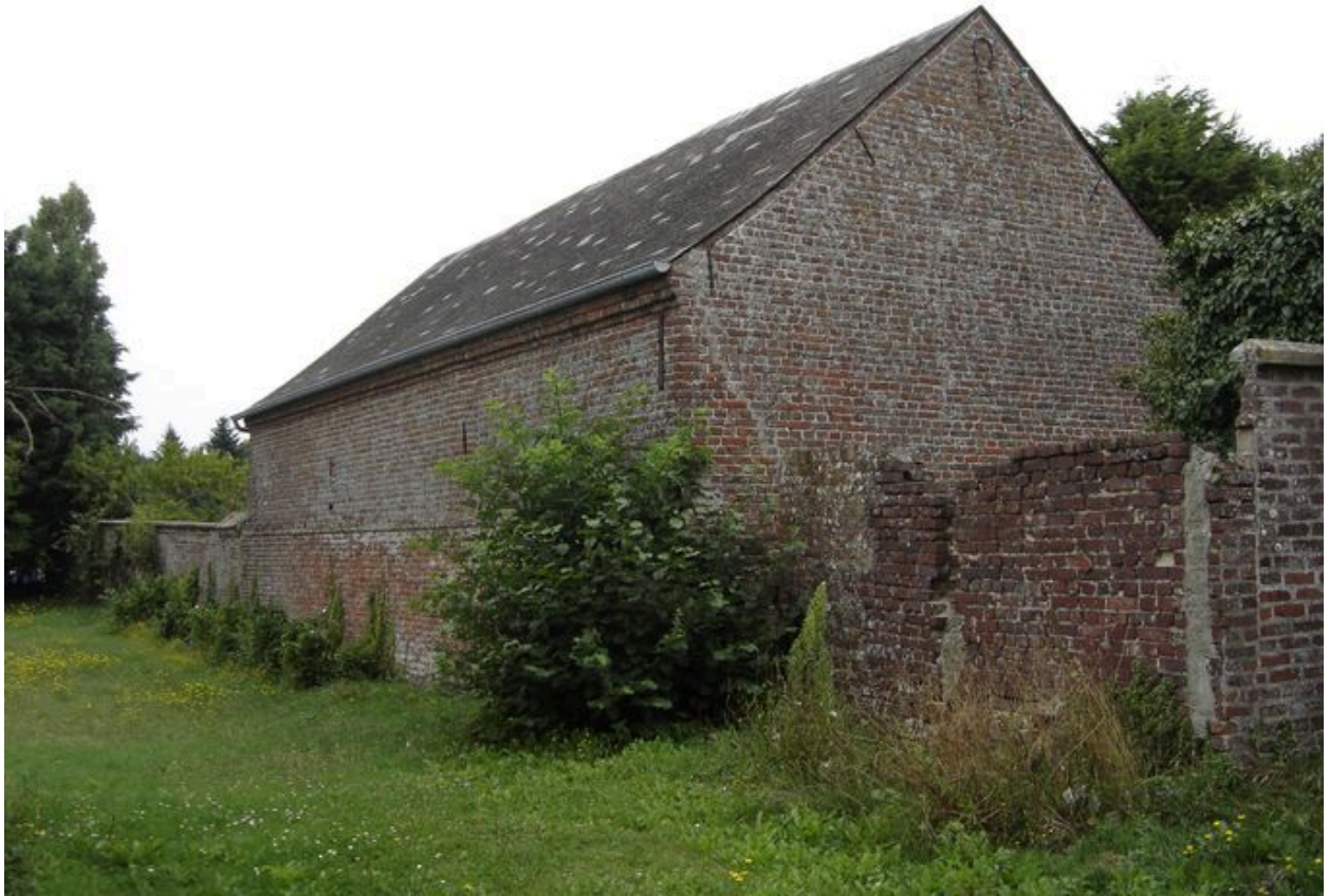
Vue postérieure du bâtiment agricole en fond de cour.