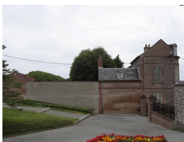
Vue latérale.