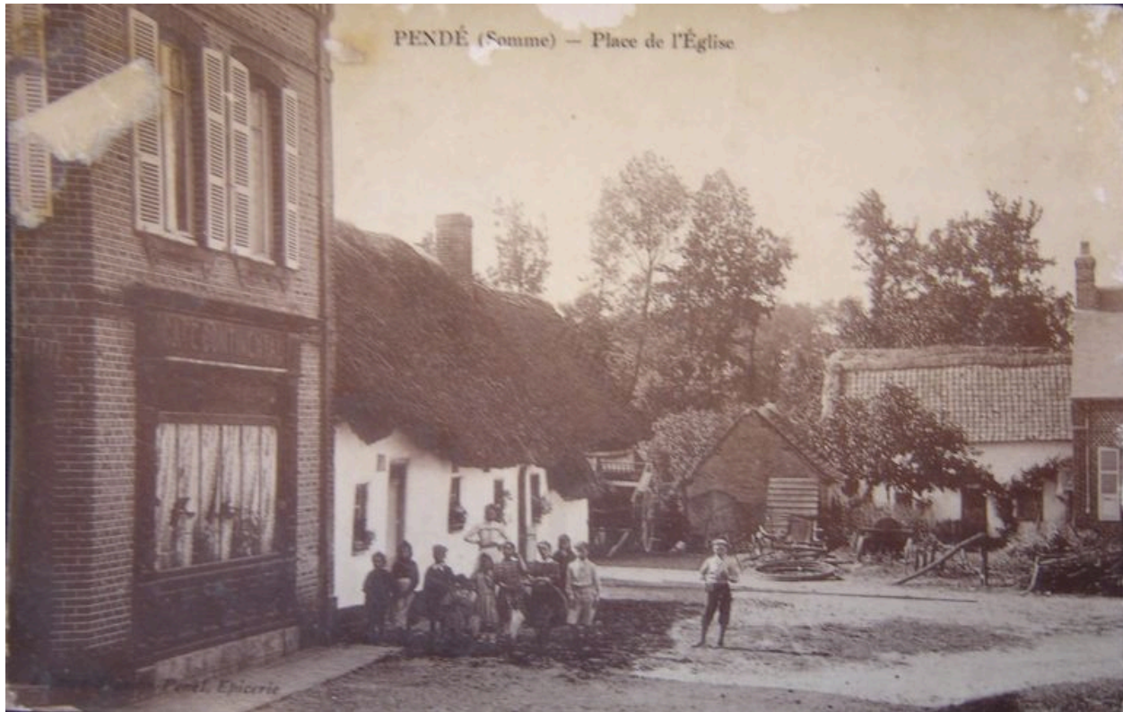
Vue de la place de l'église, avec ancienne chaumière attenante au café.