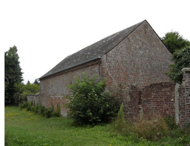
Vue postérieure du bâtiment agricole en fond de cour. IVR22_20068005083NUCA