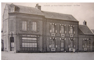
Vue du café au début du 20e siècle.