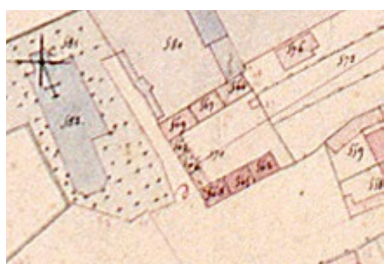
Extrait du cadastre napoléonien présentant la ferme en 1832.

Phot. Monnehay-Vulliet Marie-Laure IVR22_20068005944XAB