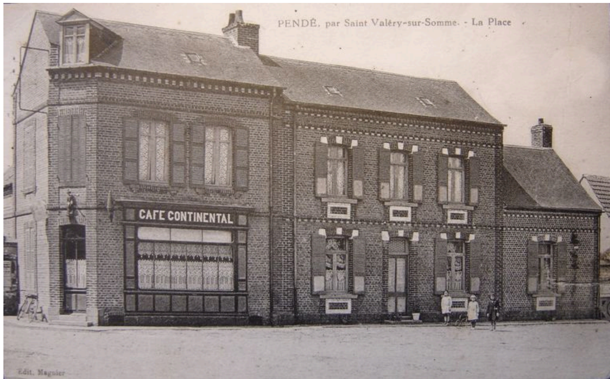
Vue du café au début du 20e siècle.