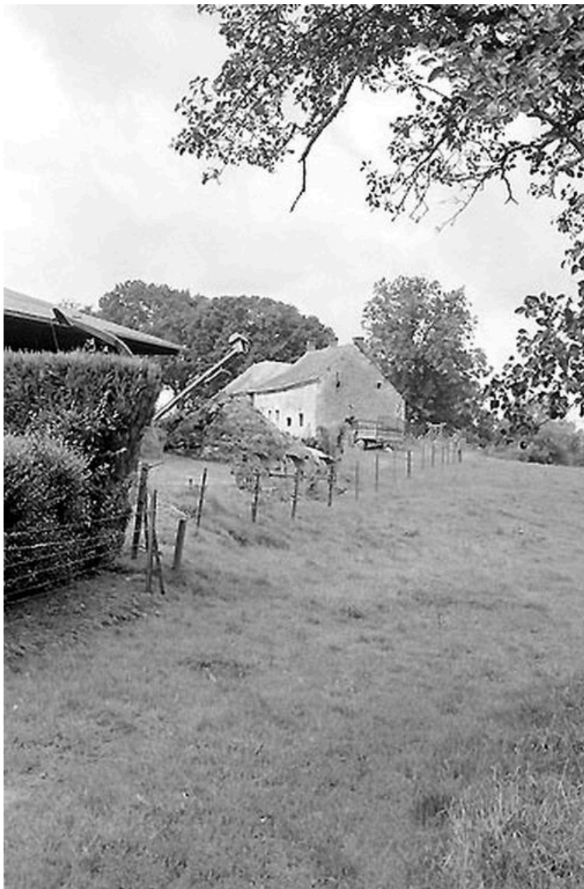
Vue depuis la rue.