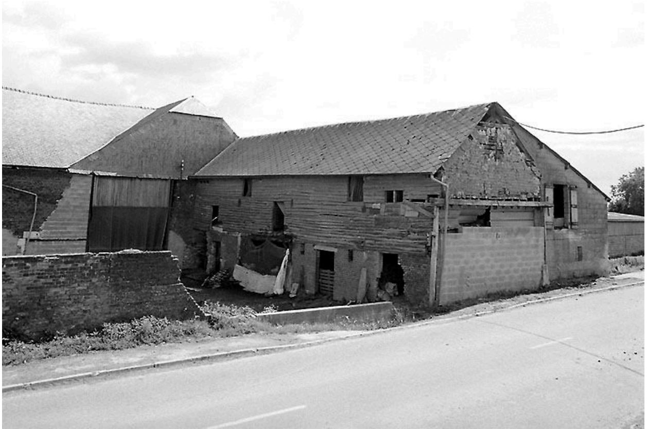
Etable et grange.