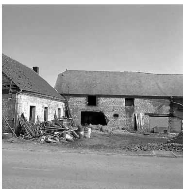
Etable à vaches attenante au logis.