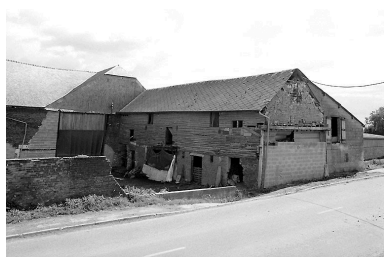
Etable et grange.