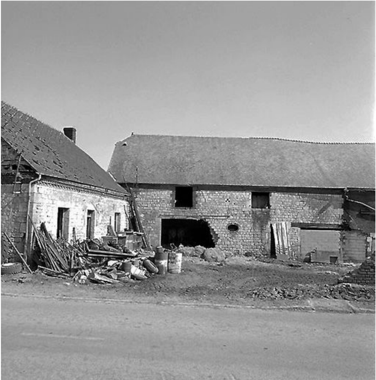
Etable à vaches attenante au logis.