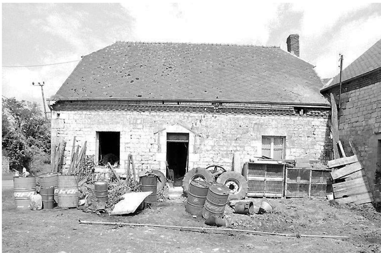
Façade antérieure du logis.