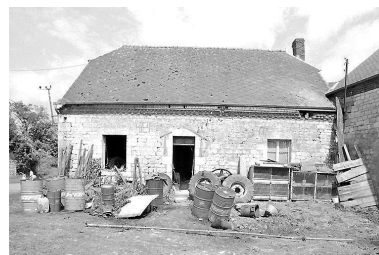
Façade antérieure du logis. IVR22_19980202532Z