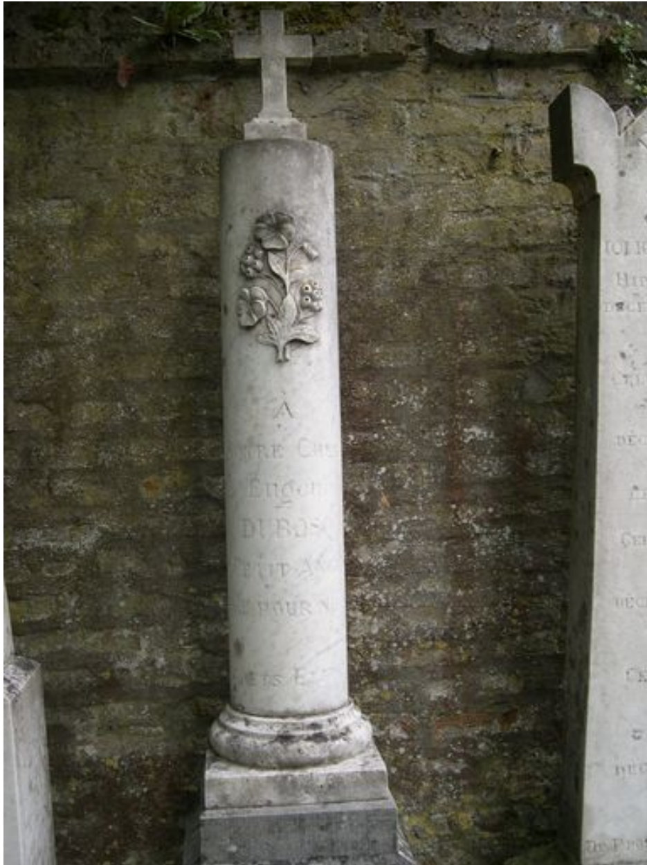
Colonne funéraire d'Eugène Dubosq, vers 1881.