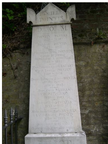
Stèle funéraire de la famille Pointin, vers 1922.