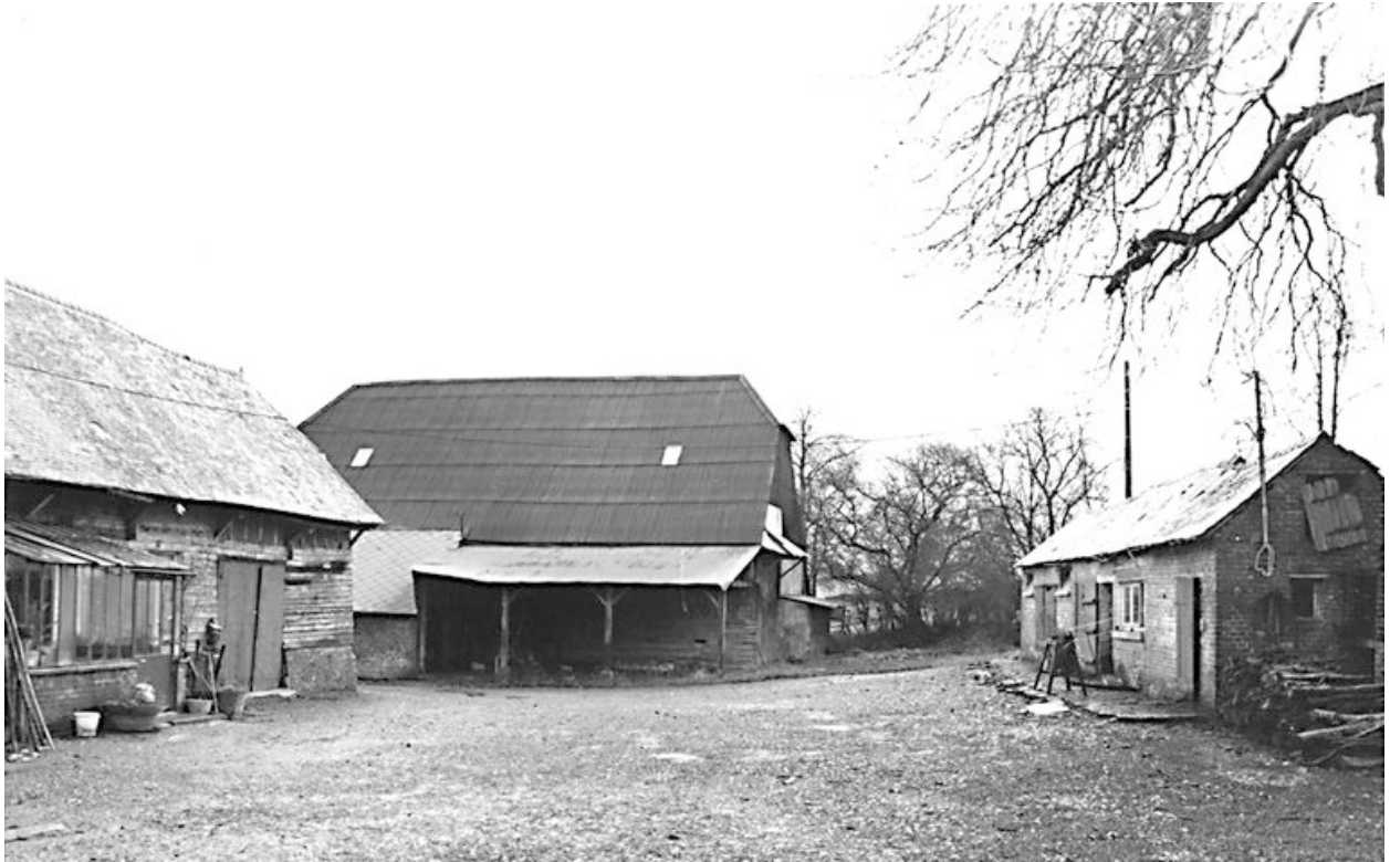
Grange et porcherie.