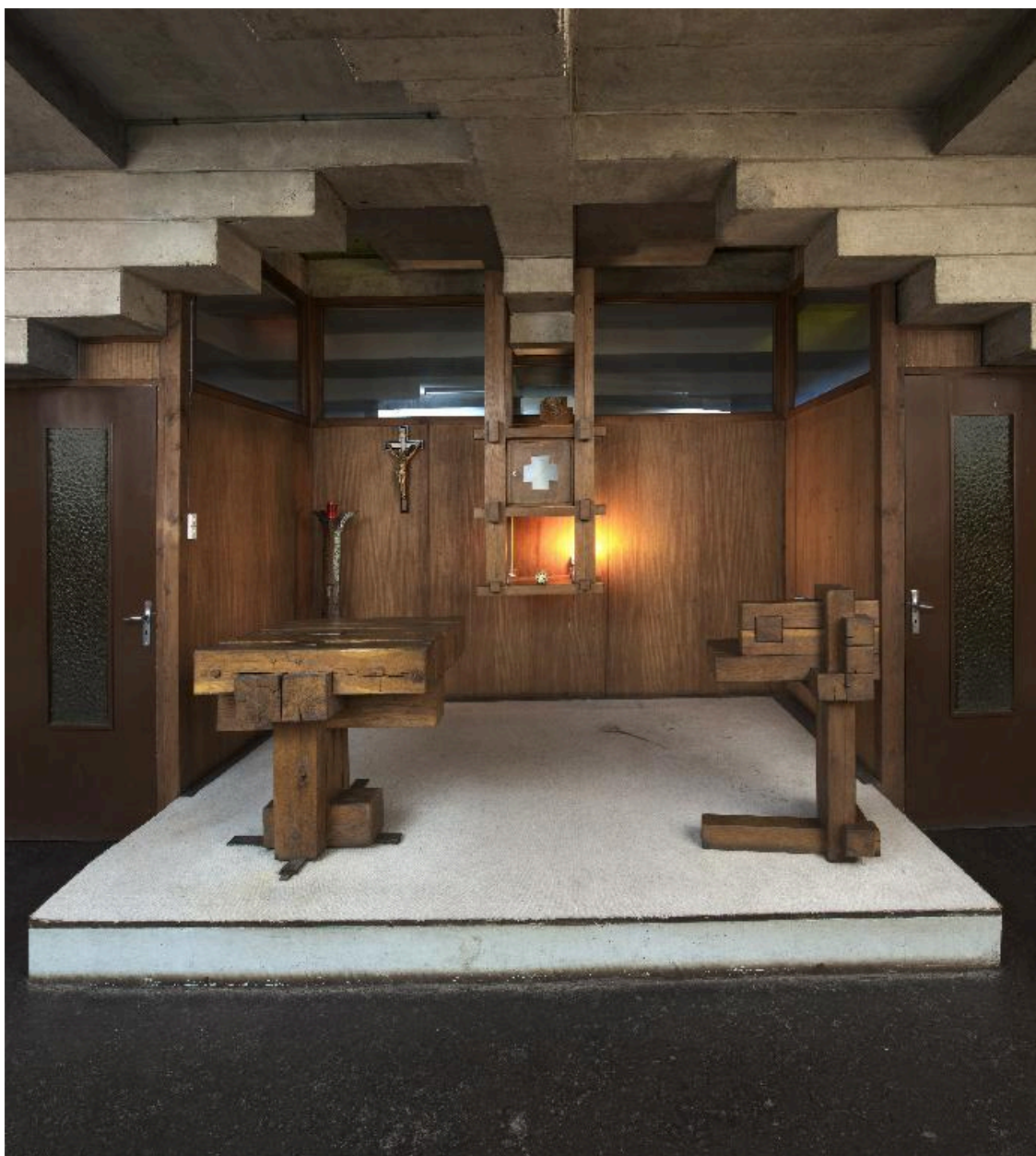
Mobilier du chœur de la chapelle de semaine : autel, tabernacle, ambon.