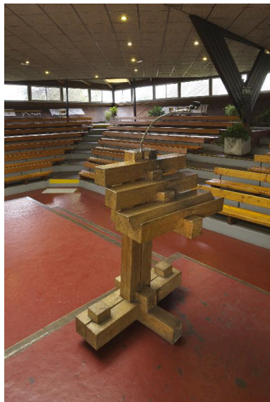
Ambon.