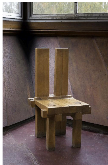
Siège de célébrant. IVR32_20170200392NUC2A