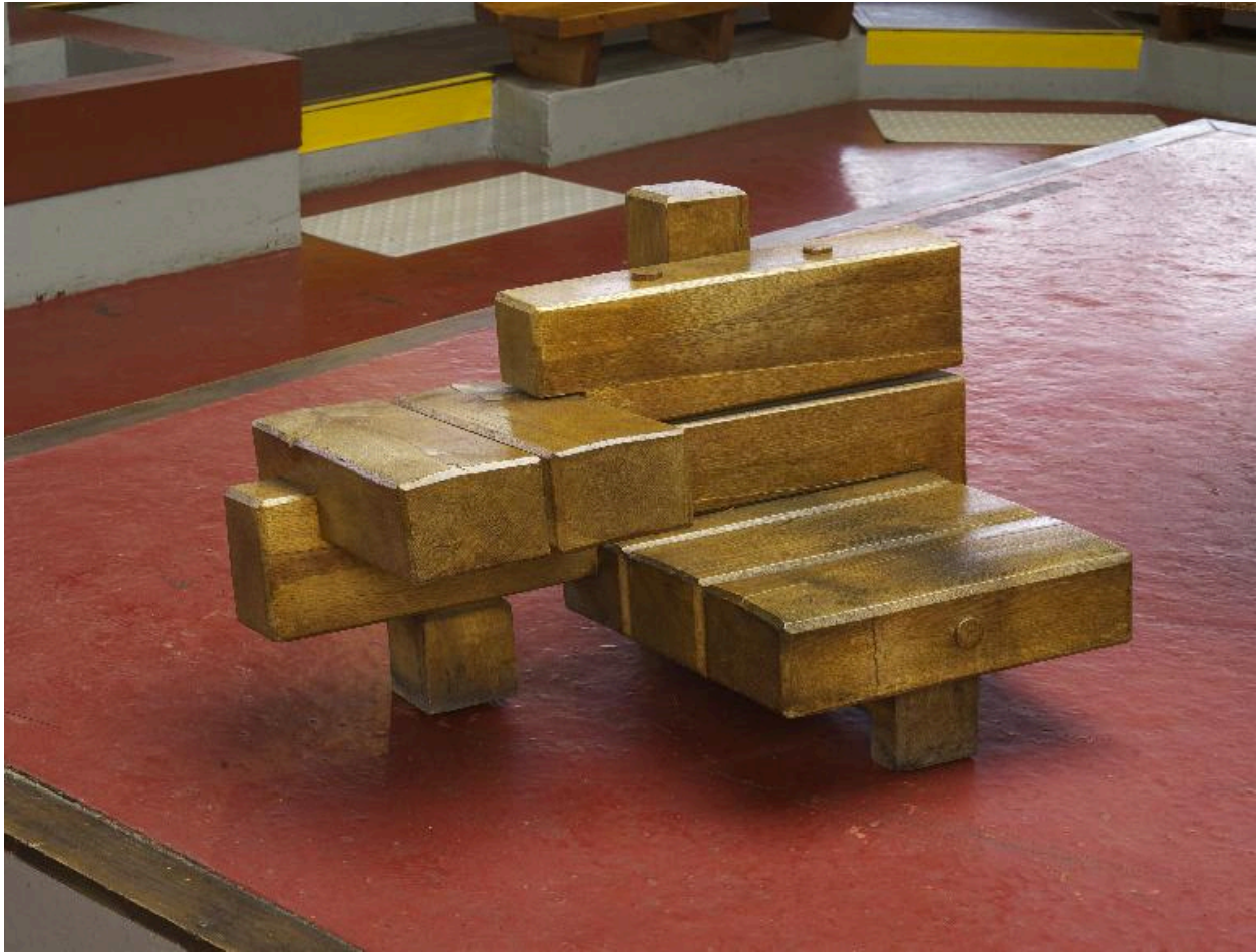
Siège de célébrant.