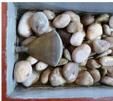
Vue de détail sur le déversoir des fontes baptismaux. IVR32_20170205437NUCA