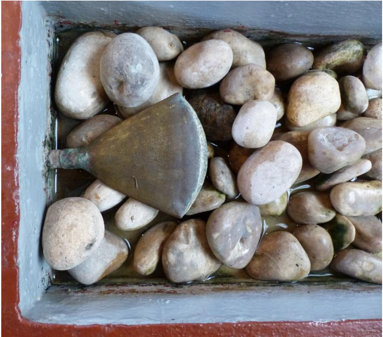
Vue de détail sur le déversoir des fonts baptismaux.