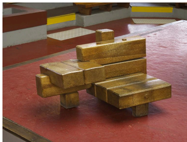
Siège de célébrant. IVR32_20170200390NUC2A