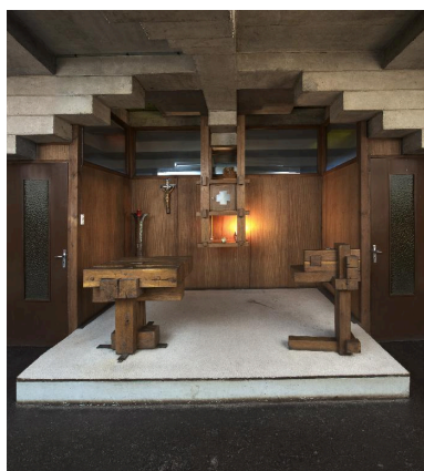
Mobilier du chœur de la chapelle de semaine : autel, tabernacle, ambon.