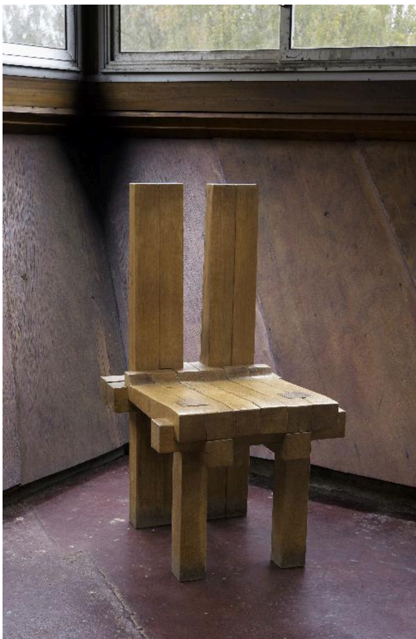
Siège de célébrant.