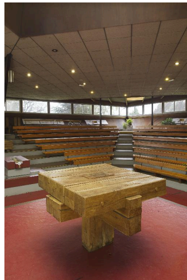
Autel.