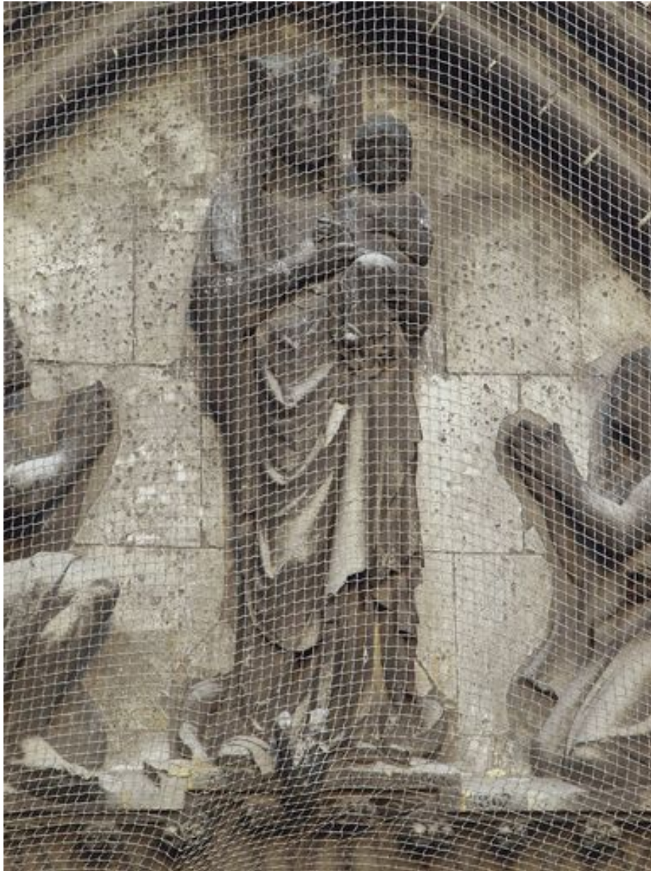
La Vierge à l'Enfant