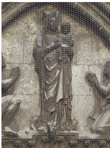
La Vierge à l'Enfant IVR31_20106202638NUCA