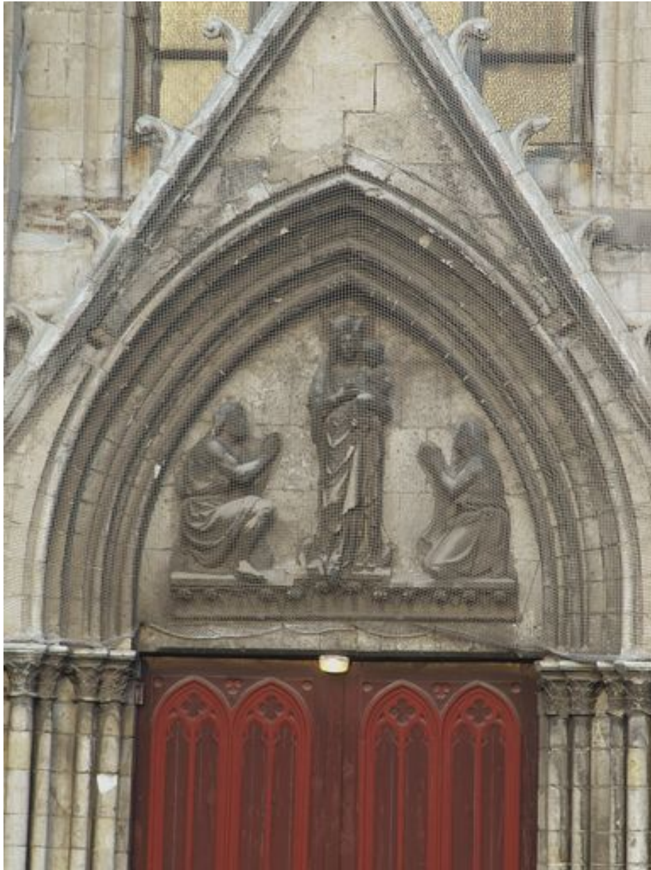
Portail principal, vue partielle : tympan, haut-relief, gâble