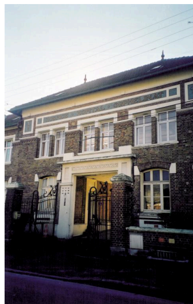
Le bâtiment d'entrée.