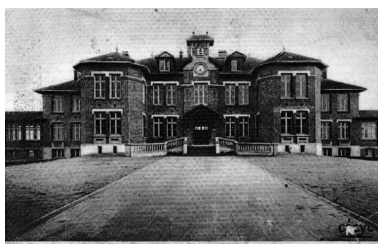
Le bâtiment principal, carte postale (AD Somme ; 8 Fi 1498). IVR22_20158005386NUCA