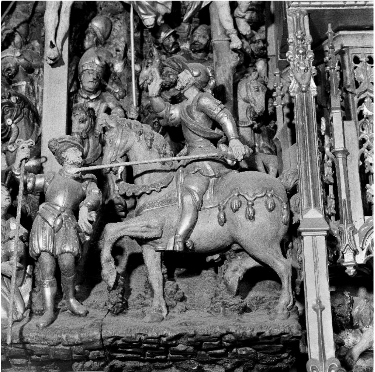
Détail de la partie inférieure de la scène centrale de la Crucifixion.