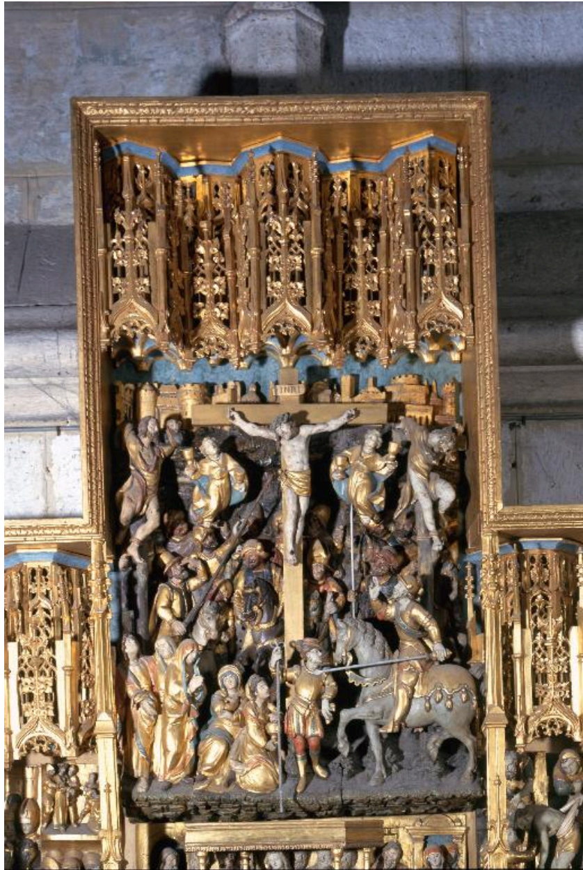
Vue de détail : la Crucifixion.