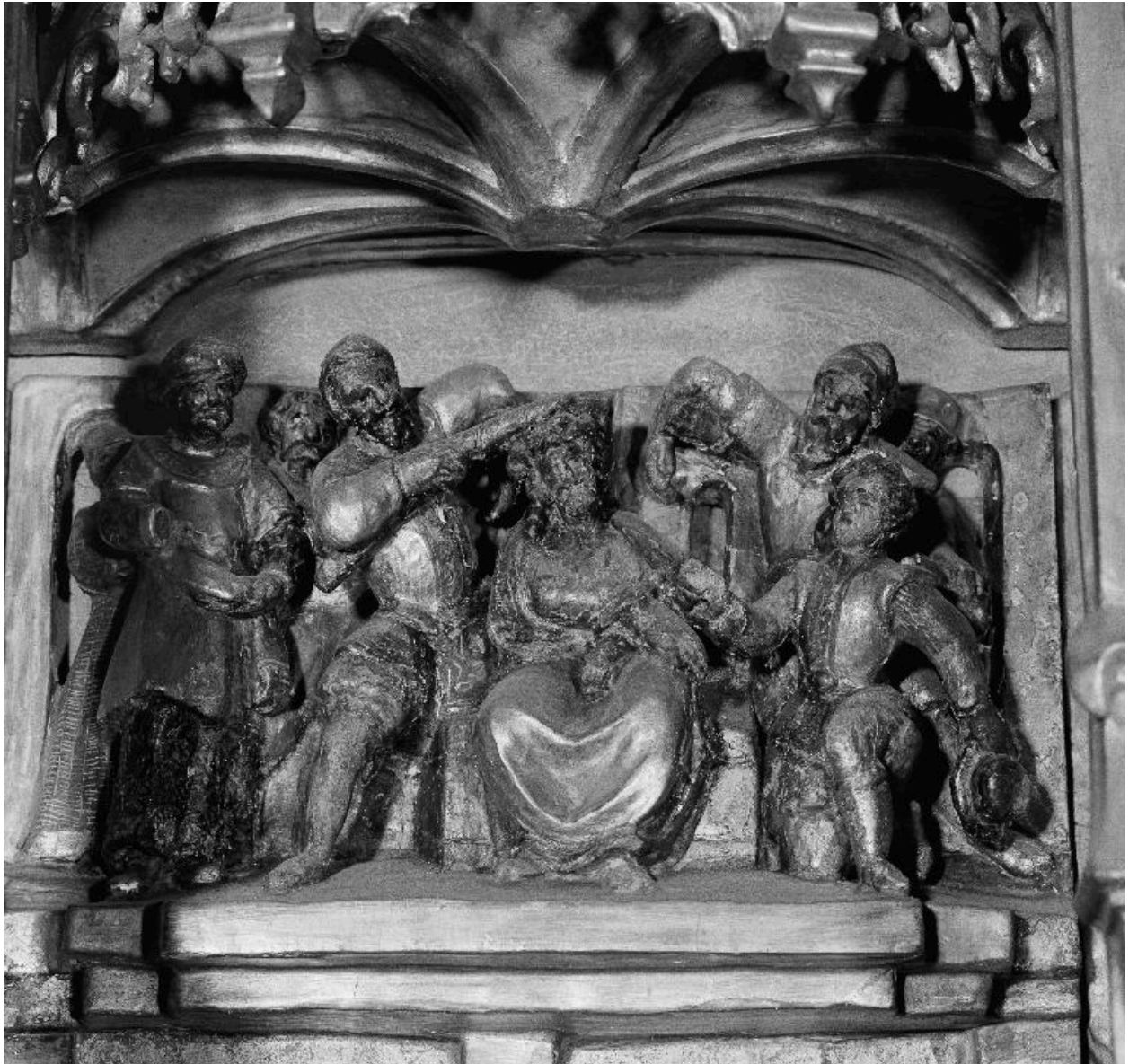
Détail de la scène de la Flagellation : Dérision du Christ.