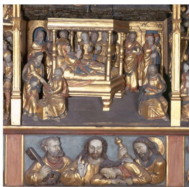
Vue de détail : Mort de la Vierge. IVR22_19966003458XA