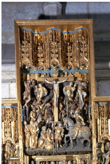
Vue de détail : la Crucifixion.