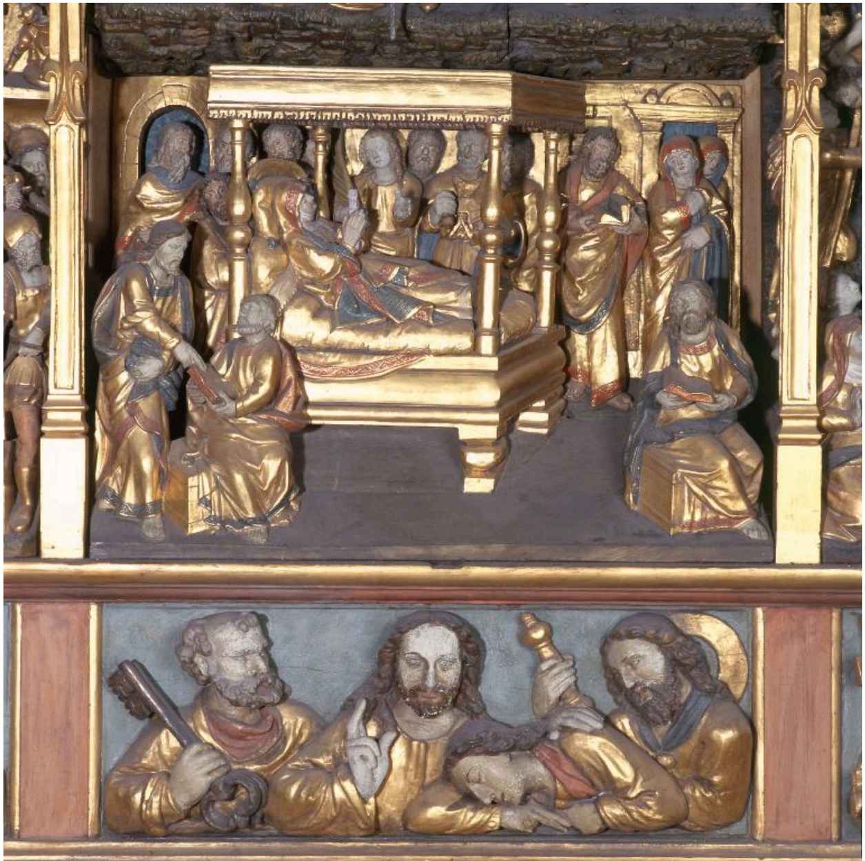
Vue de détail : Mort de la Vierge.