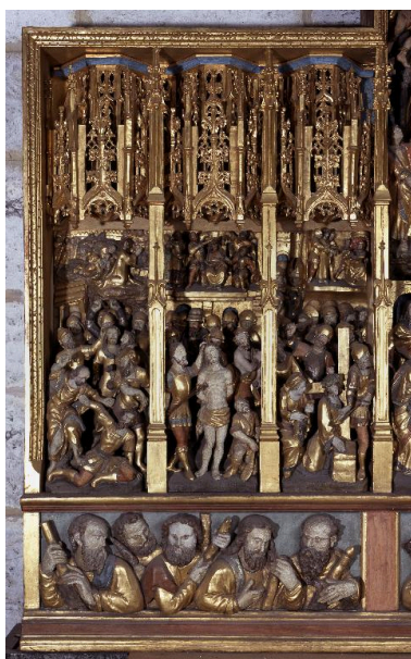
Détail de la partie gauche : Arrestation du Christ, Flagellation, Portement de croix.