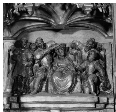
Détail de la scène de la Flagellation : Dérision du Christ. IVR22_19966003349X