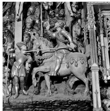
Détail de la partie inférieure de la scène centrale de la Crucifixion.