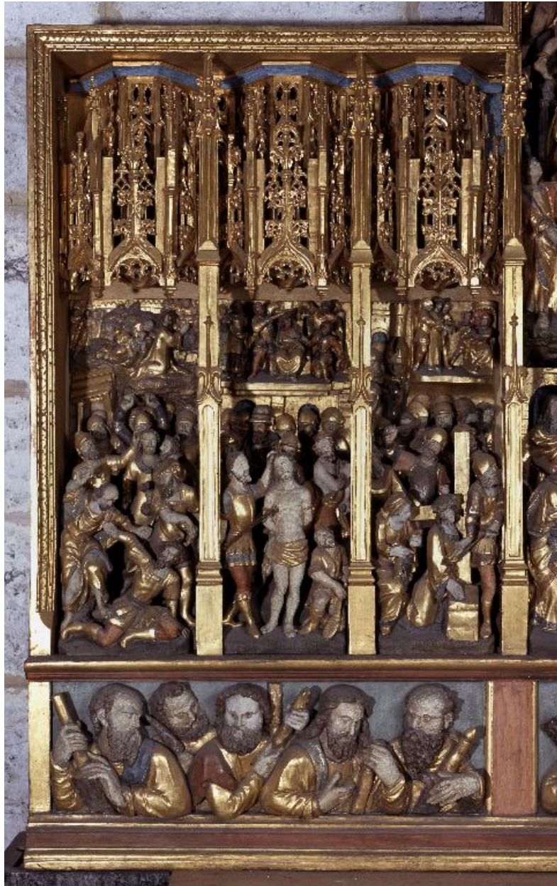
Détail de la partie gauche : Arrestation du Christ, Flagellation, Portement de croix.