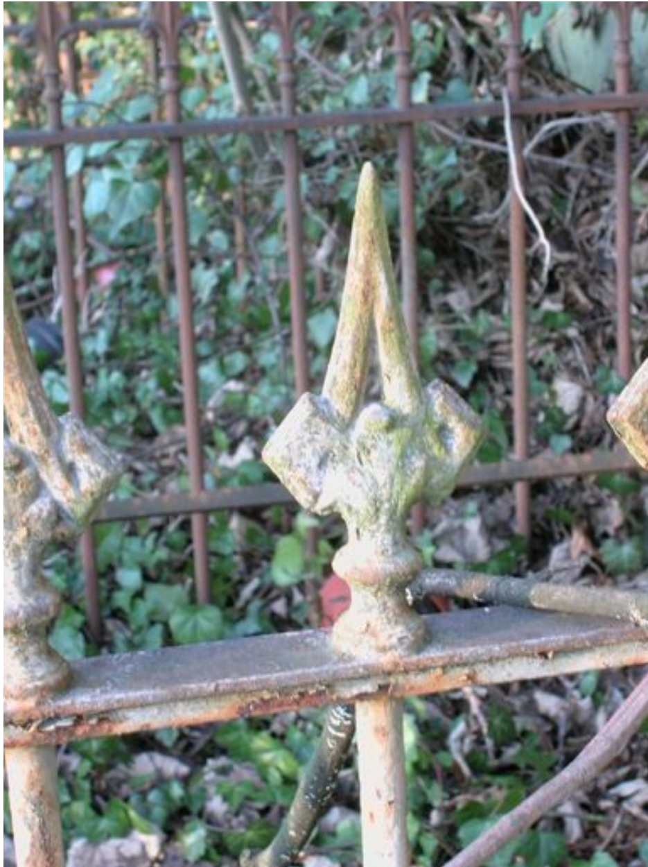
Vue de la grille. Détail des fers de lance.