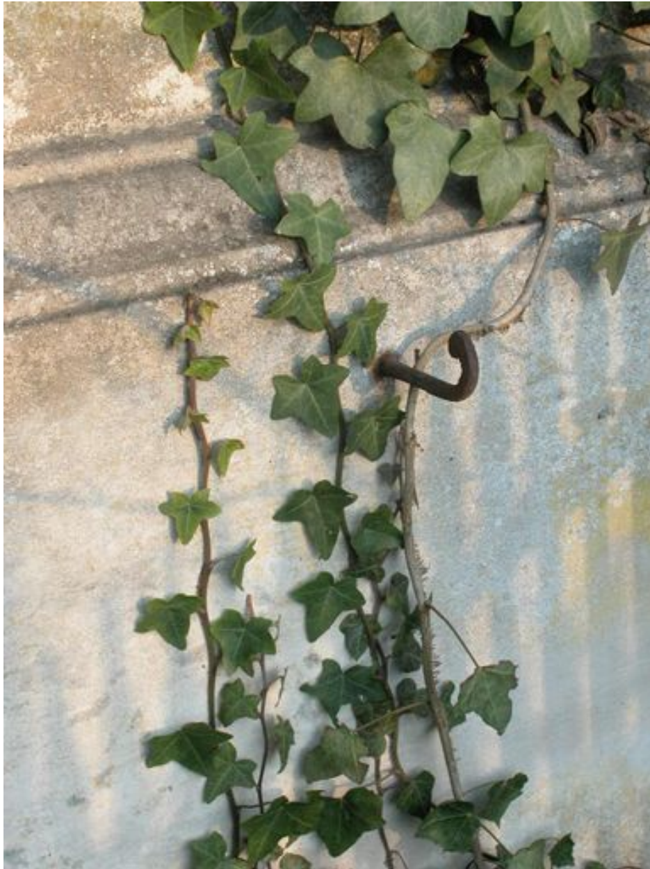
Détail du crochet à couronnes.