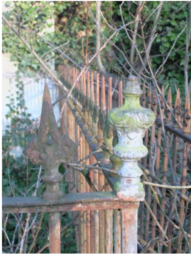
Vue de la grille. Détail de l'ornementation d'angle.