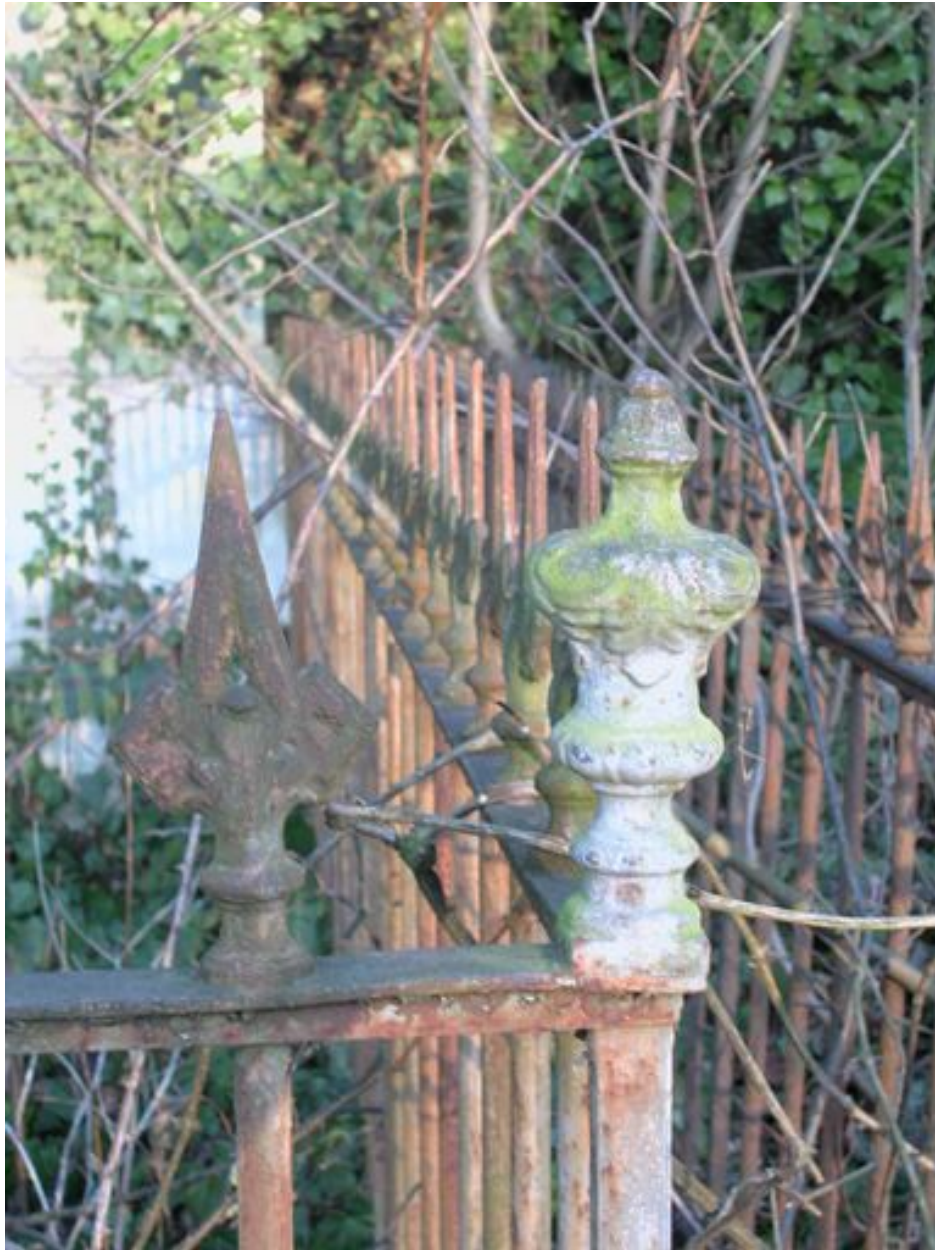
Vue de la grille. Détail de l'ornementation d'angle.