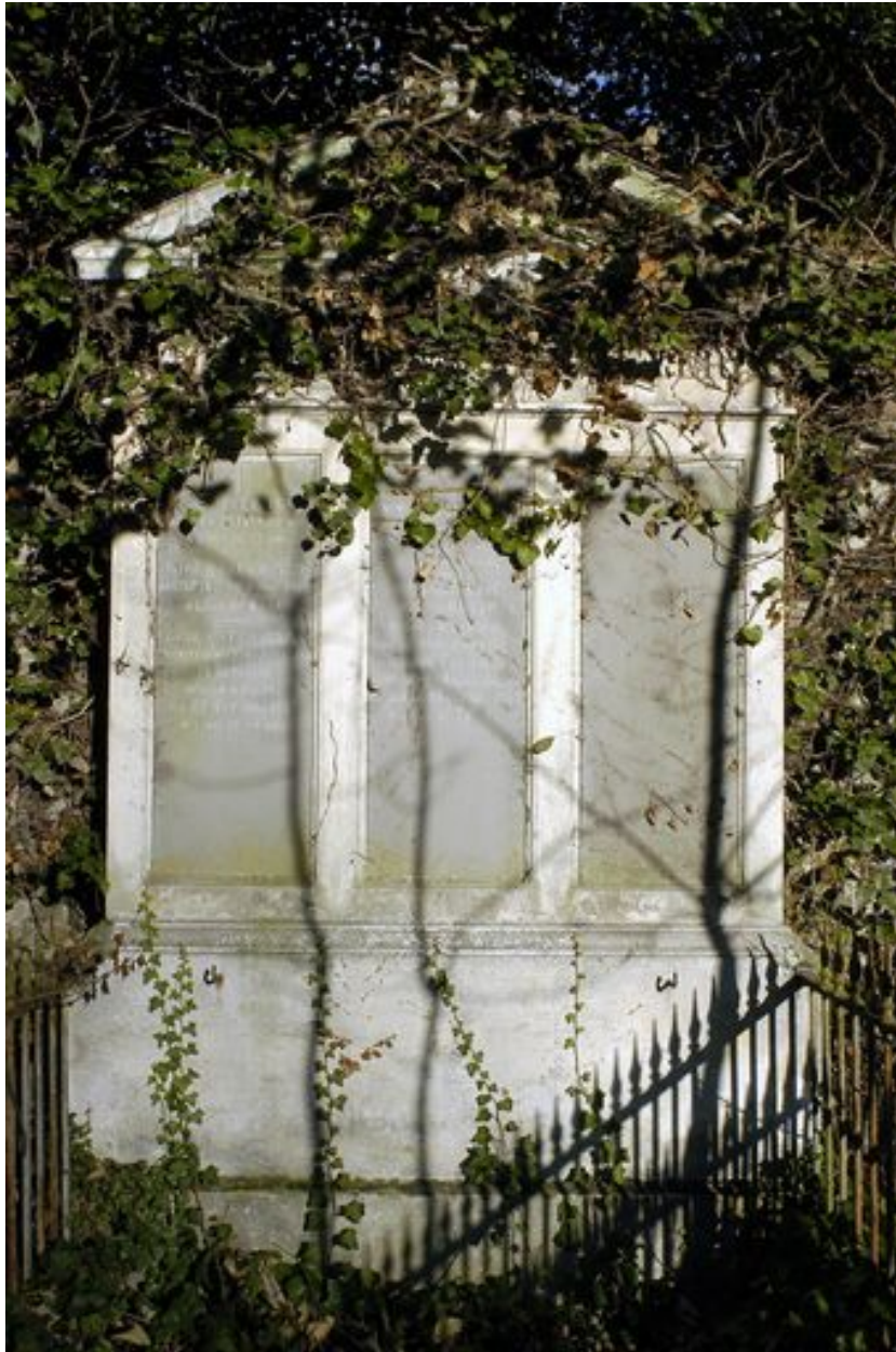
Vue de la stèle.