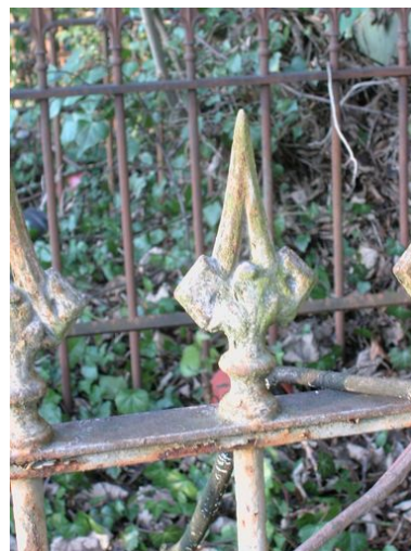
Vue de la grille. Détail des fers de lance. IVR22_20058002172NUCA