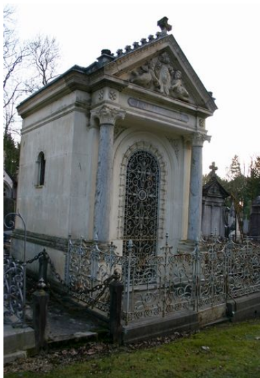
Vue générale, depuis le côté. IVR22_20088000275NUCA