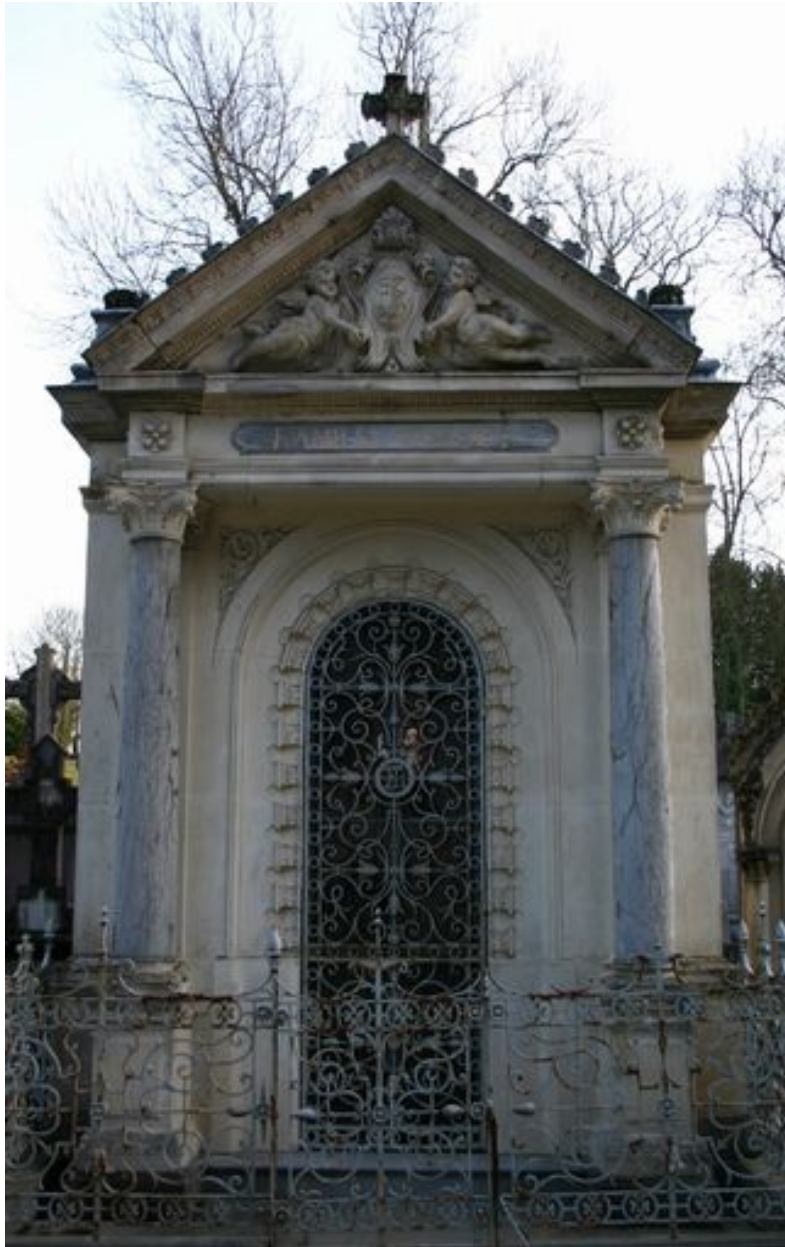
Vue rapprochée de la façade principale du tombeau-chapelle.