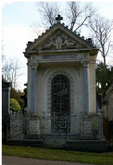
Vue générale. IVR22_20088000274NUCA