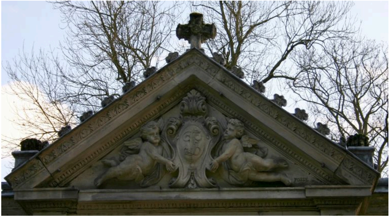
Vue de détail sur le décor sculpté du fronton (A. Fossé, sculpteur, 1881).