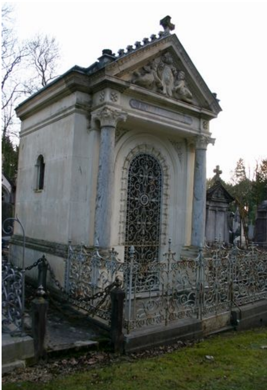
Vue générale, depuis le côté.