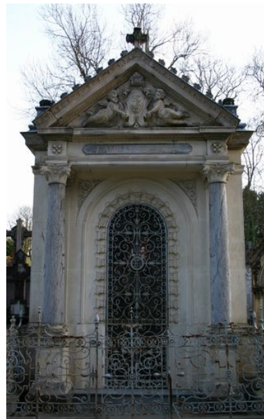
Vue rapprochée de la façade principale du tombeau-chapelle.