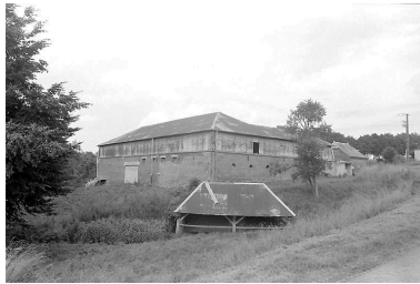
Vue générale, depuis le sud ouest, des bâtiments agricoles formant cour. IVR22_19980201478Z