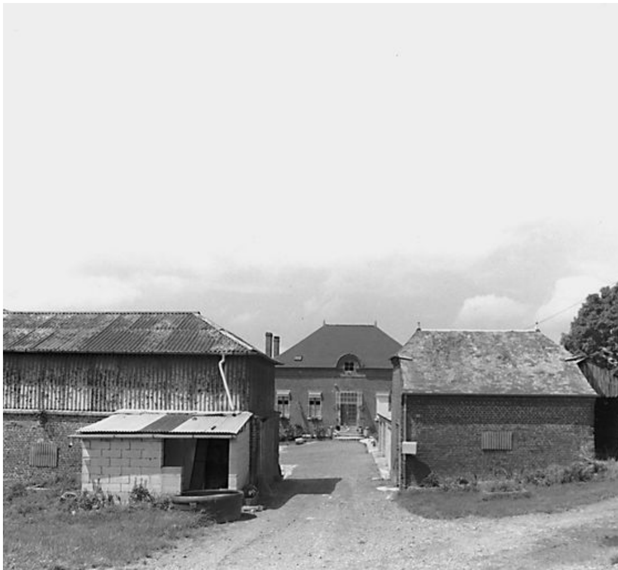
Vue depuis l'entrée : logis en fond de cour et logis agricole au premier plan.