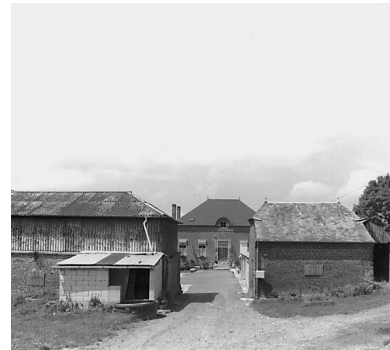
Vue depuis l'entrée : logis en fond de cour et logis agricole au premier plan. IVR22_19980201477Z