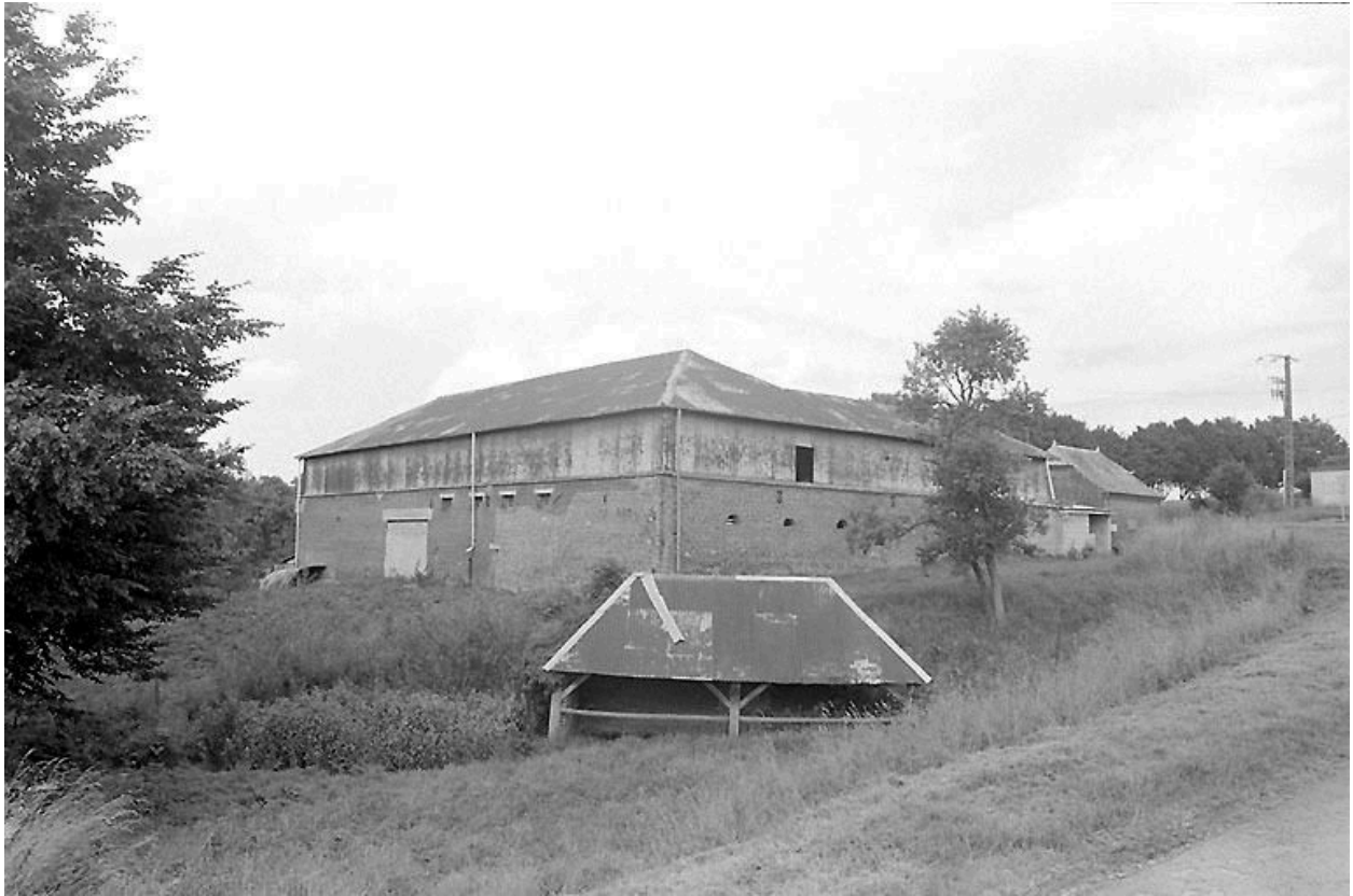
Vue générale, depuis le sud ouest, des bâtiments agricoles formant cour.