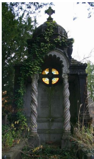
Tombeau en forme de niche monumentale, de style néobyzantin.