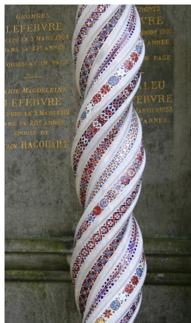
Détail de la colonne torsadée.