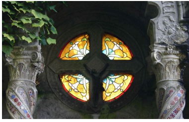
Verrière de style Art Déco. IVR22_20098001632NUCA