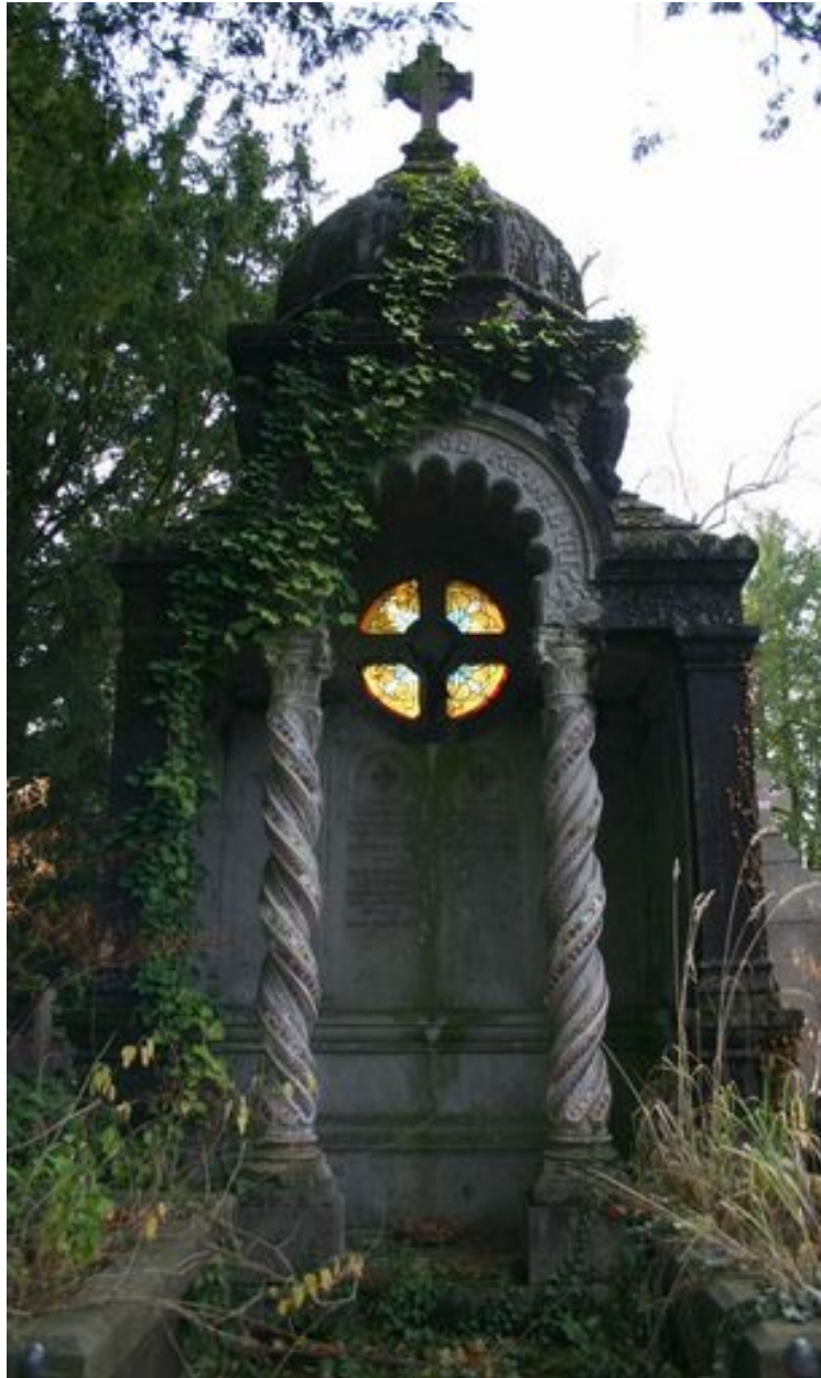
Tombeau en forme de niche monumentale, de style néobyzantin.