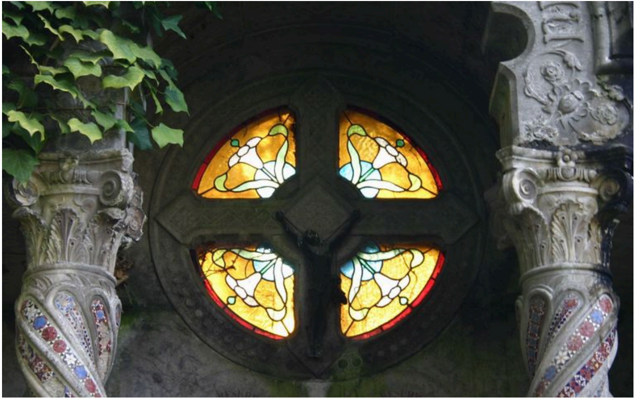
Verrière de style Art Déco.