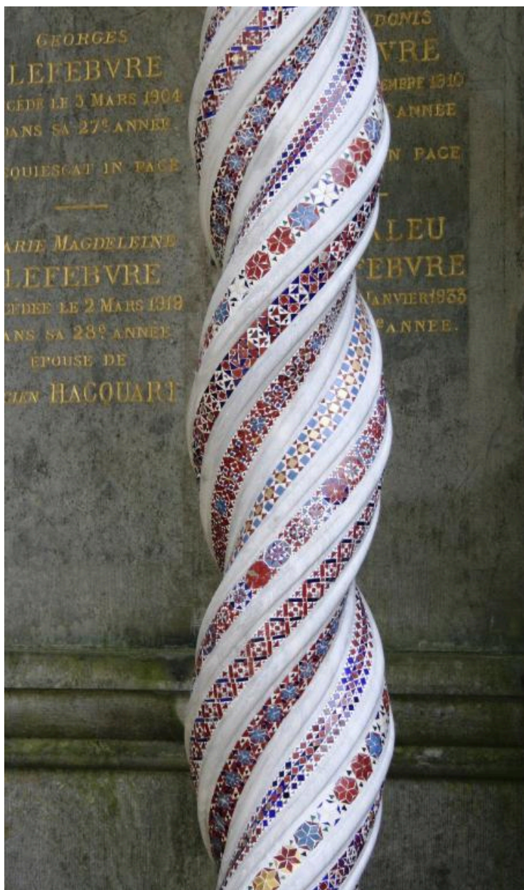
Détail de la colonne torsadée.